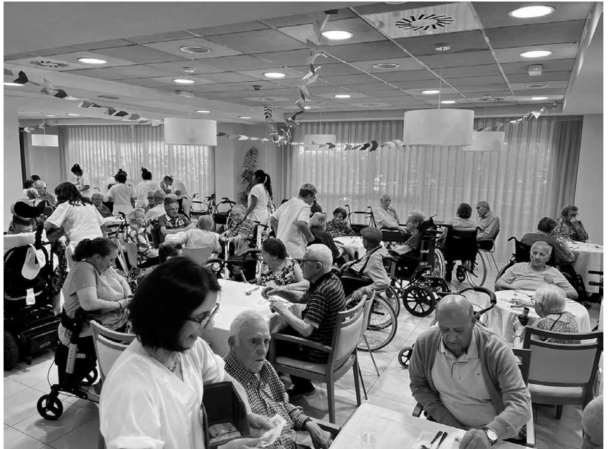
Residentes disfrutando de la fiesta.