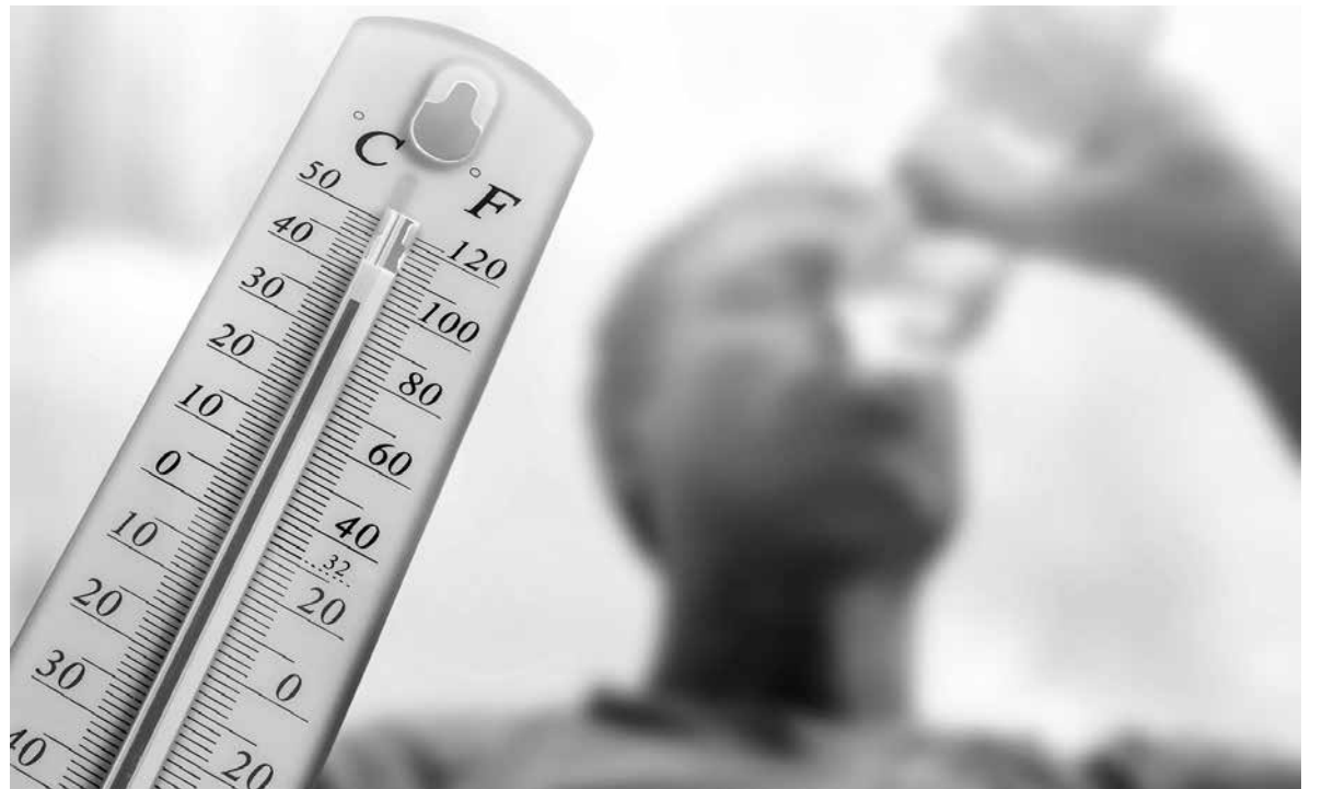
Los termómetros se disparan en verano y hay que cuidarse.

Durante los meses de verano, las altas temperaturas pueden afectar gravemente la salud, especialmente en las personas mayores. El golpe de calor ocurre cuando el organismo pierde la capacidad de regular su temperatura y esta aumenta por encima de los valores normales. En el adulto mayor, esto sucede con mayor facilidad debido a que el mecanismo de sudoración disminuye con la edad, existe menor sensación de sed y, en muchos casos, se asocian enfermedades crónicas o tratamientos que favorecen la deshidratación. Cuando el cuerpo no logra eliminar el exceso de calor, se produce una alteración del funcionamiento normal de órganos como el cerebro, el corazón y los riñones. Los síntomas pueden incluir cansancio intenso, mareos, dolor de cabeza, piel caliente y seca, confusión, somnolencia o pérdida de conocimiento. Ante estos signos, es importante buscar atención médica inmediata. Para prevenirlo, se recomienda mantener una buena hidratación, aunque no exista sensación de sed, evitar la exposición al sol en las horas de mayor calor, usar ropa ligera y fresca,