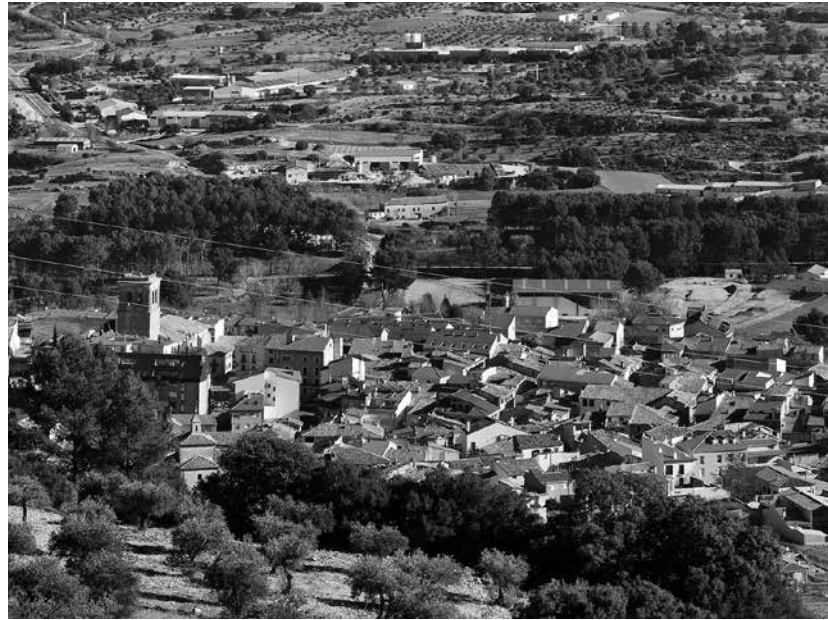
La localidad de Sacedón, en Guadalajara.

Algunos de nuestros residentes son de Sacedón. Esta es una localidad alcarreña situada junto al embalse de Entrepeñas, en plena comarca de La Alcarria. Su origen se remonta a la Edad Media y durante siglos estuvo vinculado a señoríos nobiliarios y a la actividad agrícola y ganadera. El crecimiento moderno del pueblo llegó en el siglo XX con la creación de los embalses de Entrepeñas y Buendía, que transformaron la zona en un importante destino turístico conocido como el Mar de Castilla. Entre los lugares más interesantes para visitar destacan la Iglesia de Nuestra Señora de la Asunción, de estilo renacentista; el cercano Monasterio de Monsalud, antigua abadía cister-