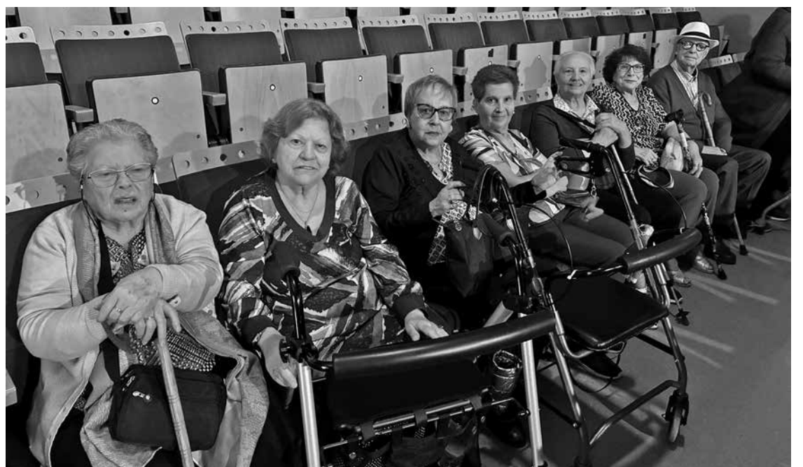
Nuestros residentes, en la actividad.

El 15 de abril acudimos a ver el espectáculo que ofrecía el conservatorio profesional de danza Carmen Amaya. El centro tuvo la deferencia al contar con nosotros para que pudiéramos disfrutar del espectáculo de primavera que ofrecen los alumnos. Quedamos encantados y es un placer siempre para nosotros contemplar el talento de las jóvenes promesas de la danza de nuestra ciudad. Fueron muy atentos para que nuestros mayores estuvieran confortables en el auditorio. Aplaudimos la iniciativa que tiene el conservatorio al contar con nuestro centro y