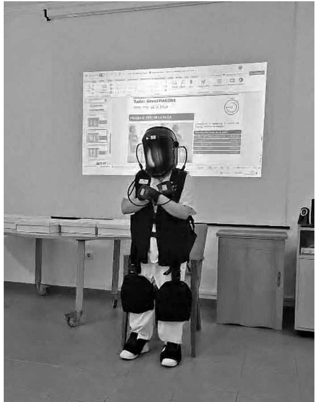
Personal utilizando el traje de lastres.

El equipo de Amavir Tejina participó recientemente en el taller GeroImagine, una enriquecedora formación organizada junto a Fresenius, centrada en la empatía y la comprensión del envejecimiento. Durante la jornada, los profesionales pudimos experimentar en primera persona algunas de las limitaciones físicas y sensoriales que viven muchas personas mayores gracias al uso de un traje simulador de envejecimiento o “traje de lastres”. Esta experiencia nos permitió comprender mejor las dificultades que pueden surgir en actividades cotidianas como caminar, levantarse o mantener el equilibrio. La formación reforzó la importancia de ofrecer una atención más humana, respetuosa y centrada en la persona. Sin duda, una experiencia muy positiva que nos ayuda a seguir mejorando la calidad de los cuidados y el acompañamiento que ofrecemos cada día a nuestros residentes.