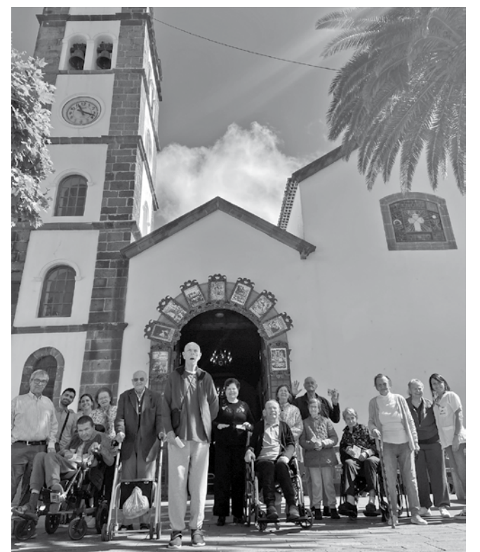
Grupo de residentes en la Iglesia de San Marcos.

y disfrutar de sus calles engalanadas, divirtiéndonos una mañana fuera del centro. Con este tipo de actividad pretendemos conseguir los siguientes objetivos: fomentar el envejecimiento activo, mejorar la calidad de vida y romper la rutina, además de fomentar la socialización e interacción.