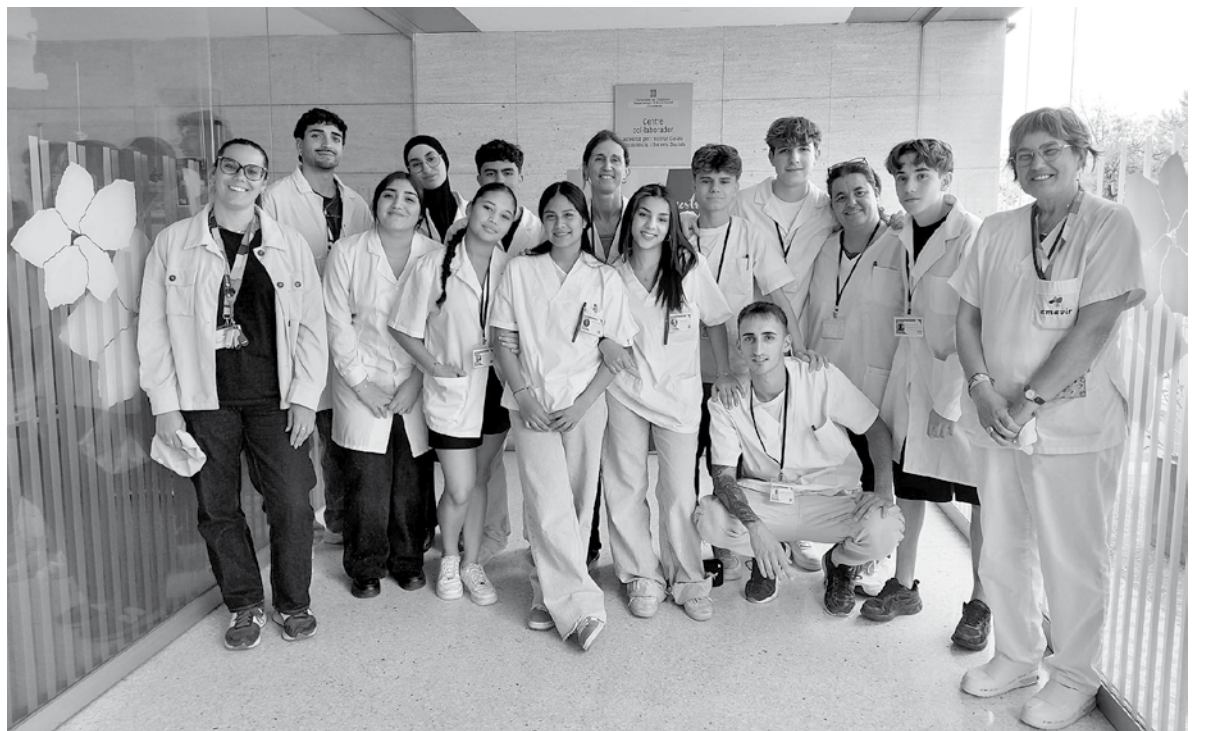
Alumnat de TCAE de l'IES Maremar a Amavir Teià.

A Amavir Teià desenvolupem un projecte de col·laboració amb l'alumnat de TCAE de l'IES Maremar, una iniciativa que vivim amb molta il·lusió i que ens permet apropar el centre a futurs professionals de l'àmbit socio sanitari. A través d'aquestes trobades, residents i estudiants comparteixen temps, experiències i aprenentatges en un entorn proper i enriquidor. Per al centre, és una oportunitat per fomentar la sensibilitat, el respecte i el valor de cuidar des de la relació humana.