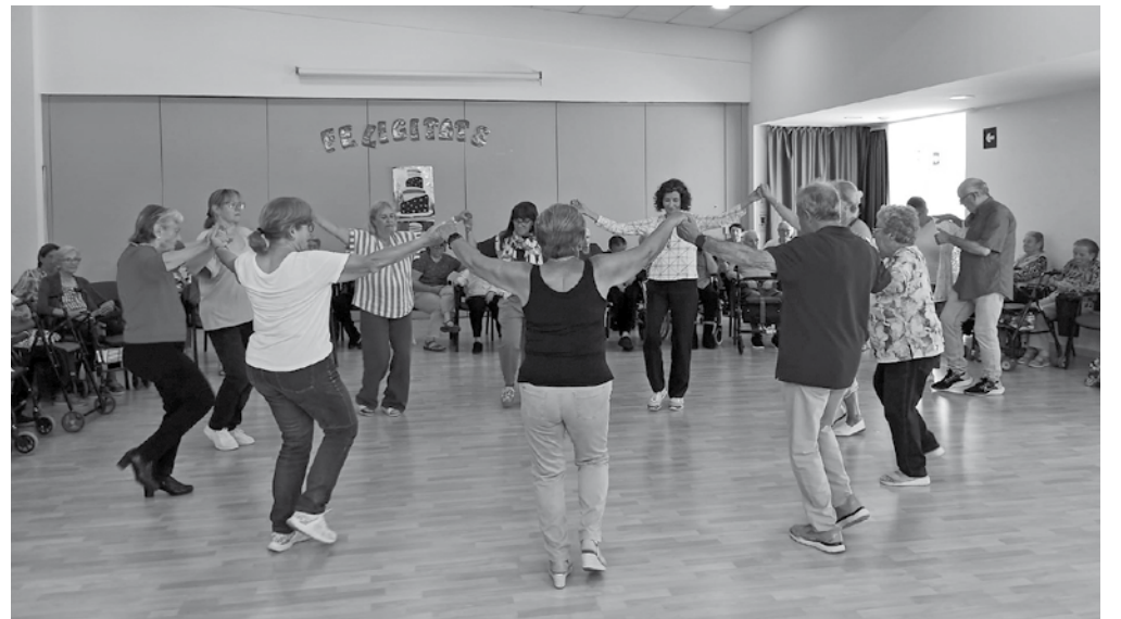
La música, el ball i la convivència van marcar la nostra celebració.

A Amavir Teià hem celebrat el nostre 21è aniversari amb una setmana molt especial, plena d'activitats adreçades a les persones residents, les famílies i els professionals. Durant diversos dies, el centre es va omplir de música, cultura, tradició i moments de convivència que ens van permetre compartir plegats una celebració tan significativa. El programa va incloure propostes per a tots els gustos: una missa rociera, actuacions musicals, exhibicions de sevillanes, una exposició dels treballs realitzats per les persones residents, sessions de musicoteràpia, exhibicions culturals, activitats compartides amb entitats del municipi i propostes a l'aire lliure, com ara un vermut al jardí o una jornada de petanca. Tampoc no hi va faltar la celebració dels aniversaris de les persones residents, un dels moments més emotius de la setmana. Com a cloenda, vam celebrar un dinar commemoratiu amb la presència de l'alcalde de Teià i d'altres representants municipals, que ens van vo-