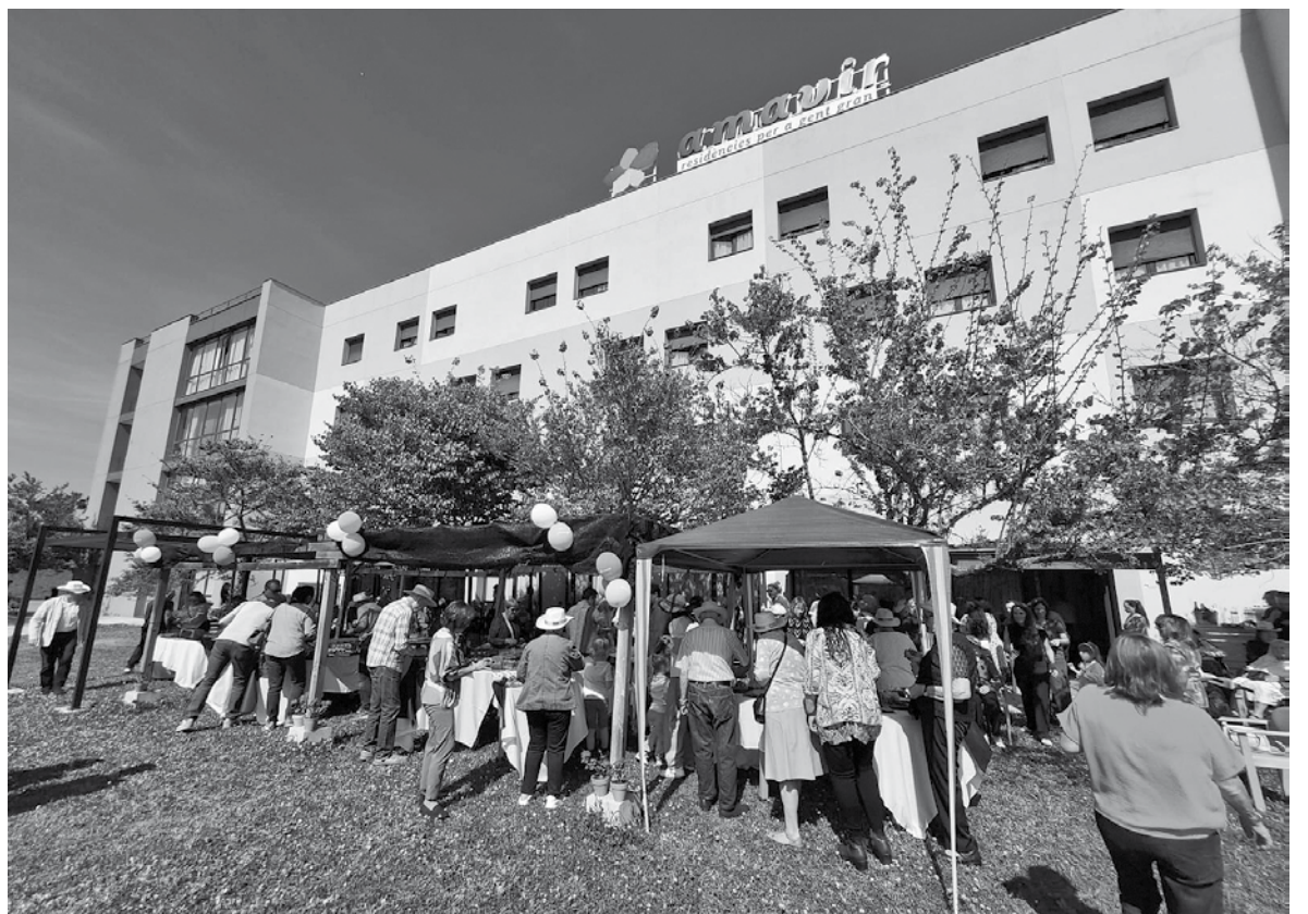
Celebrando el aniversario de la residencia.

El pasado 25 de abril celebramos el 17.º aniversario de nuestra residencia, una fecha muy especial que nos permitió compartir una jornada llena de alegría, cercanía y convivencia. Un año más, residentes, familiares y trabajadores nos reunimos para disfrutar juntos de un día diferente, marcado por un ambiente más informal y familiar. Durante la celebración pudimos vivir momentos muy emotivos, compartir conversaciones, sonrisas y experiencias que reflejan el cariño y la unión que forman parte de nuestro día a día. Este tipo de encuentros nos ayudan a fortalecer los lazos entre todos los que formamos parte de la residencia y a seguir creando recuerdos inolvida-