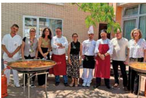
Visita de la alcaldesa de Teià (Barcelona) a Amavir Teià con motivo de la paellada organizada para celebrar con usuarios, familiares y trabajadores el 21.º aniversario de la residencia.