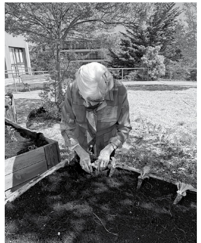
Residente cuidando plantas en el huerto.

Este año hemos puesto en marcha el huerto de la residencia, una iniciativa que está siendo acogida con mucha ilusión por parte de nuestros residentes. A lo largo de las últimas semanas, varios participantes han colaborado en la plantación de diferentes productos como pimientos, rábanos, tomates, lechugas y fresas. Además de disfrutar de la actividad al aire libre, los residentes podrán seguir de cerca el crecimiento de cada cultivo y participar en sus cuidados diarios hasta el momento de la cosecha. Esta experiencia fomenta la participación, el entretenimiento y el contacto con la naturaleza, convirtiéndose en una actividad muy enriquecedora para todos.