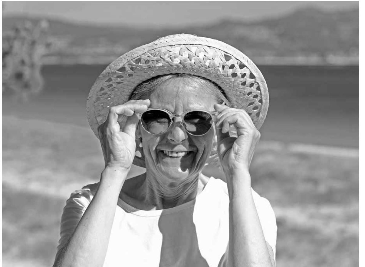
Es importante cubrirse cabeza, ojos, etc. para protegerse del sol.

Está empezando el buen tiempo, dejamos atrás las chaquetas y la ropa de invierno, ya salimos más al jardín y dejamos que nos bañe el sol. Este tiene un efecto muy importante para la salud, y también sobre nuestro ánimo, ya que hace que nos sintamos mejor y aumenta la sensación de felicidad. Físicamente actúa sobre el metabolismo de la vitamina D, por lo que favorece la captación de calcio por los huesos. Pero también tiene efectos que no son tan beneficiosos y son sobre la piel, por lo que tenemos que ir con cuidado cuando tomemos el sol para evitar quemarnos y que no salgan lesiones que podrían resultar nocivas. ¿Qué podemos hacer entonces? Debemos usar protectores solares con un nivel de protección alto porque con la edad nuestra piel se vuelve más delicada y además aparecen manchas que se incrementan con el