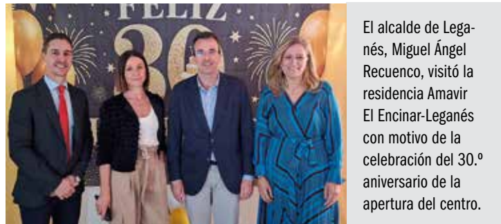
El alcalde de Leganés, Miguel Ángel Recuenco, visitó la residencia Amavir El Encinar-Leganés con motivo de la celebración del 30.º aniversario de la apertura del centro.