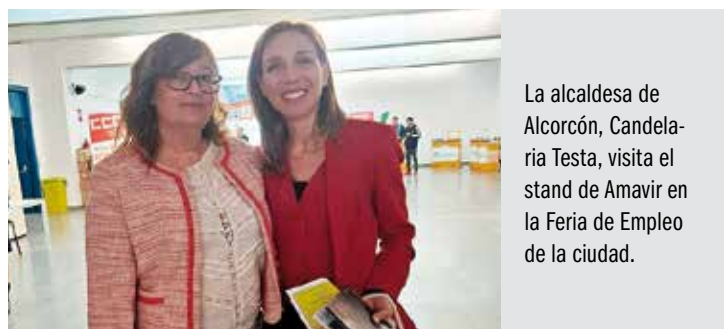
La alcaldesa de Alcorcón, Candalaria Testa, visita el stand de Amavir en la Feria de Empleo de la ciudad.