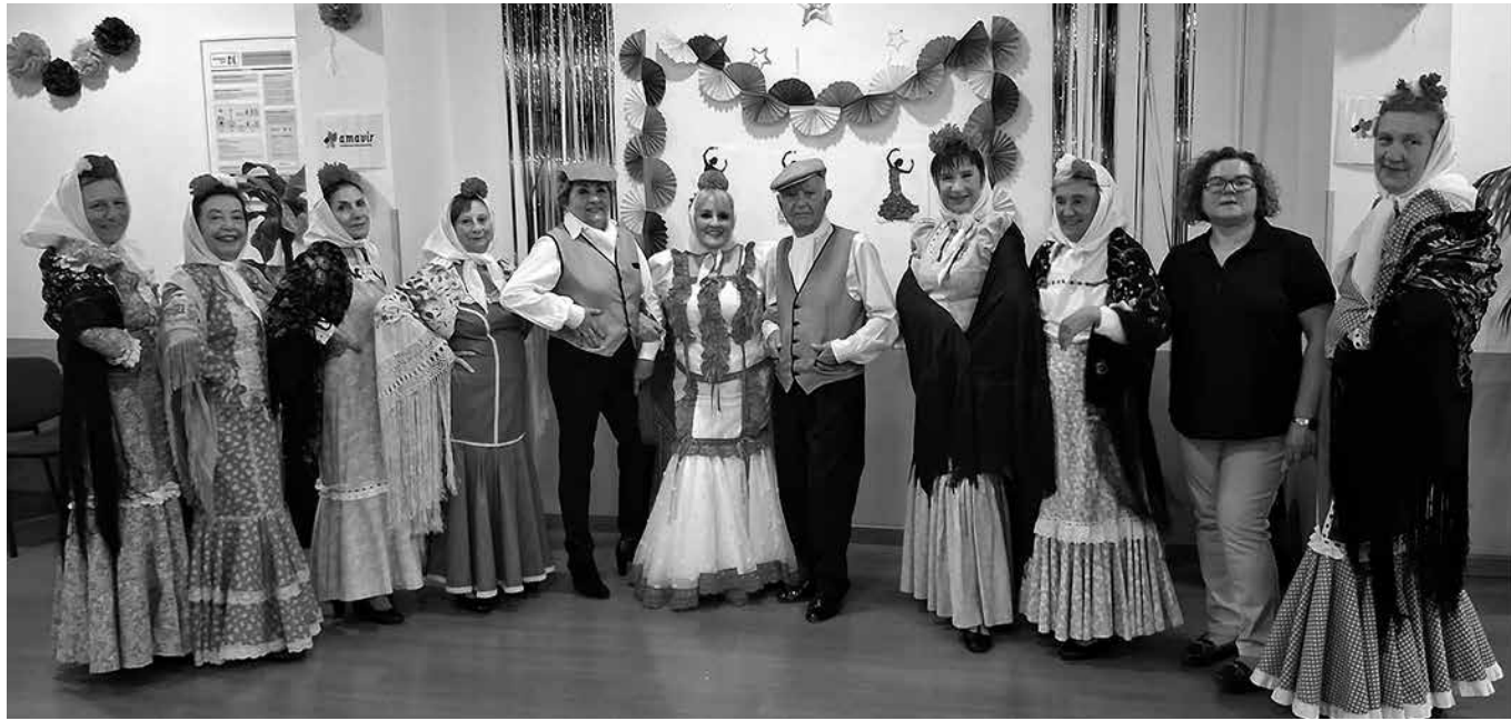
Hermandades del trabajo.

Cada mes de mayo, Madrid se llena de música, claveles y encuentros al aire libre para celebrar San Isidro, una de las fiestas más queridas de la ciudad. Familias y amigos se reúnen en parques y praderas para disfrutar de la tradición, compartir comida típica y escuchar chotis y canciones populares que forman parte de la historia madrileña. Muchos madrileños recuerdan especialmente las tardes en la Pradera de San Isidro, los puestos,