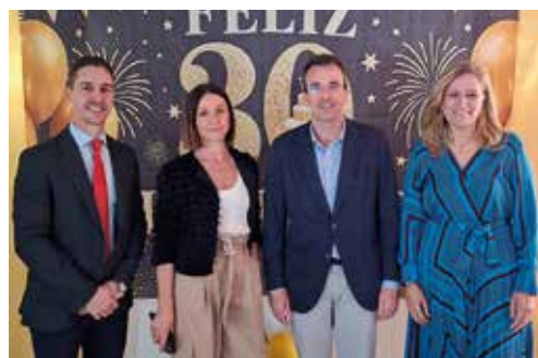
El alcalde de Leganés, Miguel Ángel Recuenco, visitó la residencia Amavir El Encinar-Leganés con motivo de la celebración del 30.º aniversario de la apertura del centro.