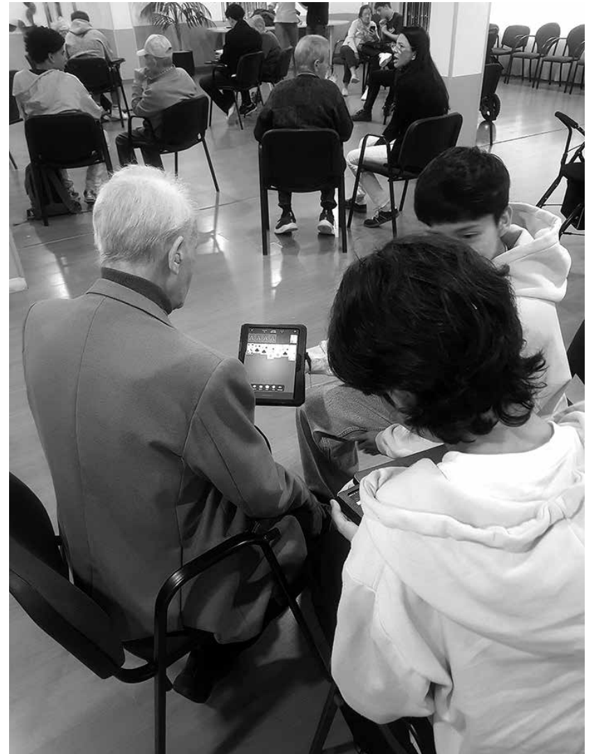
Nunca es tarde para aprender.

La digitalización ya no es solo cosa de jóvenes. Cada vez más personas mayores se animan a usar móviles, aplicaciones y servicios online para comunicarse, hacer gestiones o entretenerse. Lo que antes parecía complicado, hoy se ha convertido en una herramienta útil para mantenerse conectados con familiares y amigos. Es por ello por lo que en Amavir Vallecas hemos realizado talleres de digitalización, en colaboración con un colegio de la zona. Gracias a la iniciativa, nuestros residentes no solo aprenden a enviar mensajes por WhatsApp, pedir una cita médica o hacer compras por internet, sino que durante 8 sesiones, adolescentes y mayores establecen una conexión que va mucho más allá de lo digital. Mientras los adolescentes enseñan habilidades digitales, los residentes del centro comparten experiencia, consejos y formas distintas de entender la vida. La pregunta aquí sería ¿quién enseña a quién? Lejos de quedarse atrás, nuestros mayores están demostrando que nunca es tarde para aprender. Para muchos, la tecnología ya no es un obstáculo, sino una puerta abierta a la autonomía y la conexión social.