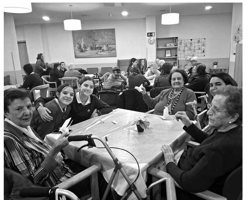
No recordamos días, sino momentos.

Los programas de actividades intergeneracionales tienen beneficios para ambos colectivos. Por ejemplo, nuestros mayores experimentan un aumento de su vitalidad y autoestima, y estos encuentros aumentan las oportunidades de aprender de los más pequeños, de forma que se potencian así las habilidades sociales y la empatía. Entre las generaciones implicadas, se produce también un intercambio de experiencias y transmisión de tradiciones y cultura popular, y también se da un aprendizaje por parte de los más pequeños de la historia. Además, con estas actividades se disminuyen los sentimientos de soledad y aislamiento que en ocasiones se sufren durante la vejez.