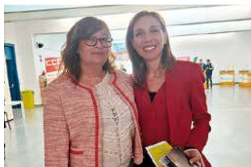
La alcaldesa de Alcorcón, Candalaria Testa, visita el stand de Amavir en la Feria de Empleo de la ciudad.