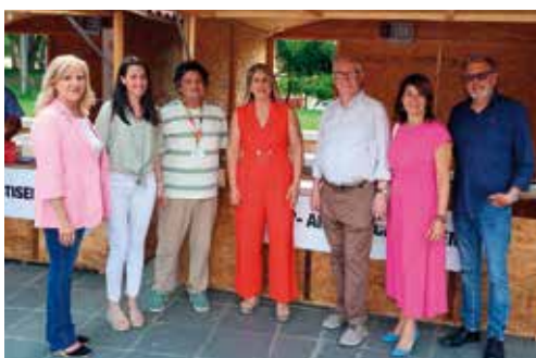
La alcaldesa de Cartagena, Noelia Arroyo, visita el stand de Amavir en la XVI Feria de Mayores de la ciudad.