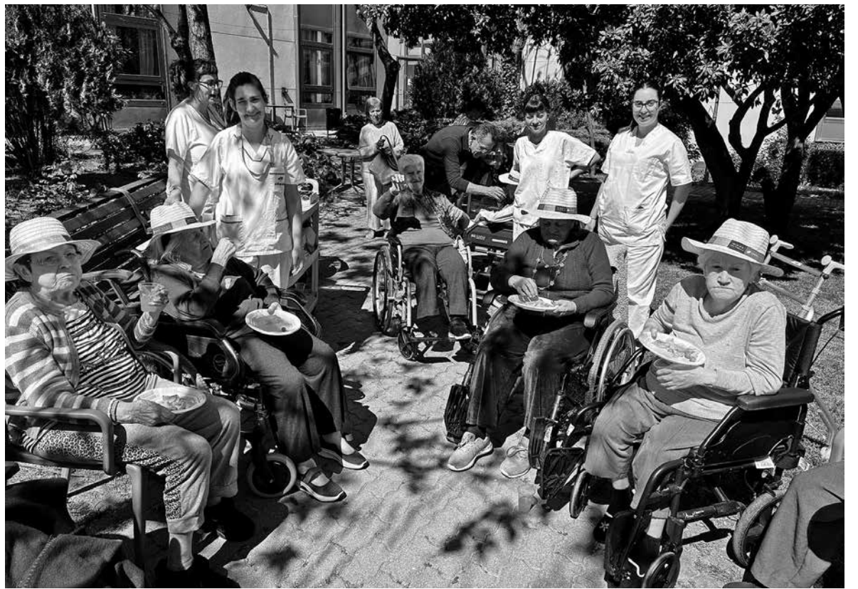
Residentes tomando el sol en el jardín.

Con la tan ansiada llegada de la primavera y las buenas temperaturas, en la residencia La Marina hemos comenzado la temporada de “Vermuts al sol”, una iniciativa pensada para que los residentes disfruten del aire libre, la música y los pequeños momentos compartidos con los compañeros y los trabajadores, intercambiando charlas y confidencias. Durante estas jornadas, y siempre que el tiempo acompañe, diferentes grupos reducidos de mayores salen al jardín de la residencia para disfrutar de un agradable vermut acompañado de música de su época, creando un ambiente festivo, cercano y lleno de alegría. Este tipo de actividades permiten fomentar la convivencia, estimular los recuerdos a través de canciones conocidas y aprovechar los beneficios del buen tiempo en un entorno relajado y seguro. Confiamos en que las buenas temperaturas permitan seguir disfrutando del jardín del centro durante los meses de verano.