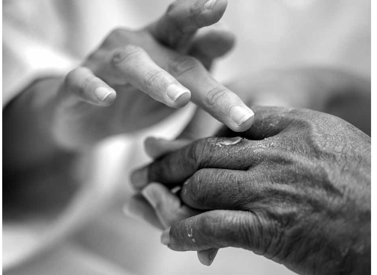
Las picaduras en verano pueden ser muy molestas.

Aloe vera y lavanda para la inflamación: Mezcla una cucharada de gel de aloe vera con dos gotas de aceite esencial de lavanda. Aplica sobre la piel irritada tras una picadura o quemadura leve. El aloe hidrata y calma, mientras que la lavanda es antiinflamatoria y cicatriza-