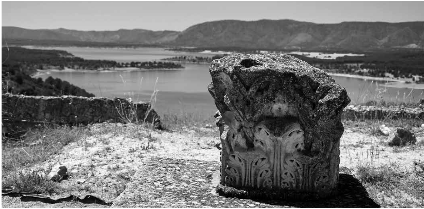
Pantano de Buendía desde el yacimiento de Ercávica.