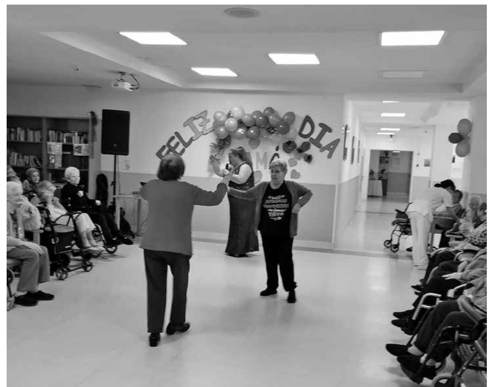
Dos de nuestras residentes animándose a bailar.