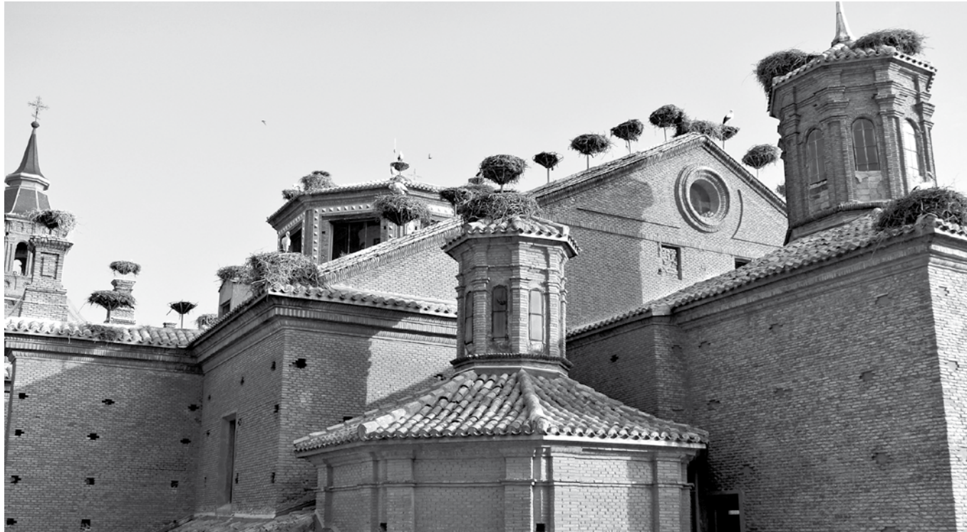
Imagen de la localidad de Alfaro, en La Rioja.

Hoy nos acercamos a Alfaro, un pueblo de La Rioja lleno de recuerdos y tradiciones. Sus plazas, campos y calles fueron el escenario de una infancia sencilla y feliz, marcada por la cercanía entre vecinos y el ambiente festivo del pueblo. Alicia Lapeña nació y creció en Alfaro, donde las fiestas de agosto reunían a familias, amigos y vecinos de pueblos cercanos en días de música, bailes