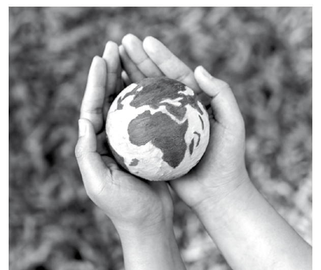
Comprometidos con el medioambiente.

Cuidar de las personas también implica cuidar del entorno en el que vivimos. Por ello, este año hemos reforzado nuestro compromiso con el respeto y la protección del medioambiente, alineados con los objetivos de la Agenda 2030. Queremos fomentar una mayor conciencia sostenible entre residentes, familias y profesionales, trabajando de forma transversal en el día a día. Apostamos por la reducción de residuos, el uso responsable del agua y la energía y el cuidado de la naturaleza. Pequeños gestos como reciclar correctamente, aprovechar la luz natural o cerrar bien los grifos, junto a muchas otras acciones cotidianas, pueden generar un gran impacto positivo si las hacemos entre todos.