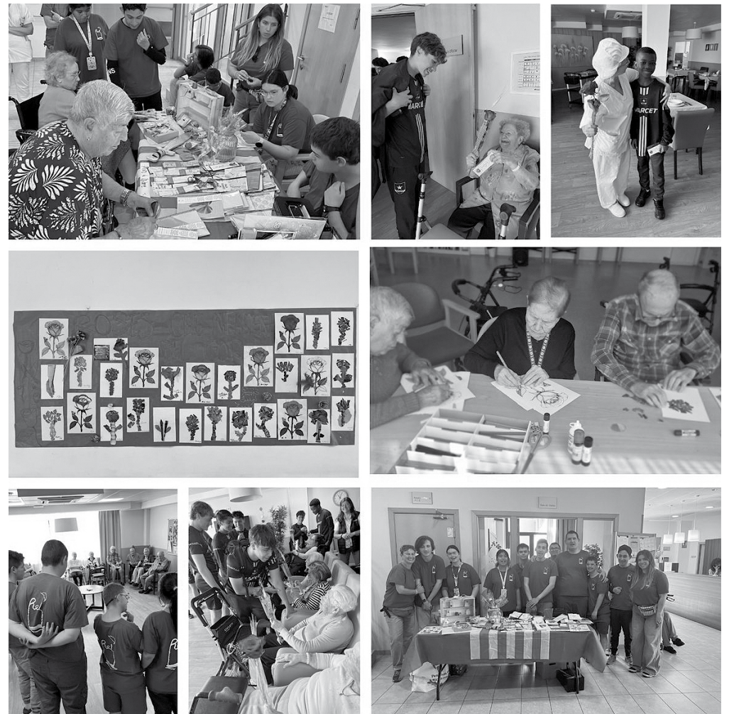
Imágenes de la celebración de San Jordi.

Con motivo de la Diada de Sant Jordi, la residencia celebró una jornada muy especial marcada por la creatividad, la participación y el trabajo en comunidad. Durante las semanas previas, los residentes elaboraron rosas creativas que después expusimos en un mural en la recepción del centro, llenando el espacio de color y expresión artística. Días más tarde, cada participante recibió su creación como recuerdo de la actividad. El 22 de abril recibimos la visita de la cooperativa Escola Rel de Educación Especial, entidad a la que se destinaron los fondos recaudados en la Semana Solidaria de Navidad. Gracias a aquella iniciativa, la escuela pudo adquirir dos microondas para mejorar la cocina de sus programas formativos. Nueve jóvenes de los programas PTVL, acompañados de dos tutoras, instalaron una parada con productos elaborados por ellos mismos. Además, realizaron un encuentro con los residentes de cuarta planta, donde pudieron explicar sus proyectos, compartir experiencias y responder preguntas en un ambiente cercano y enriquecedor para todos. La celebración continuó el día 23 con la visita de los jóvenes de la Fundación Can Marcet, que repartieron ro-