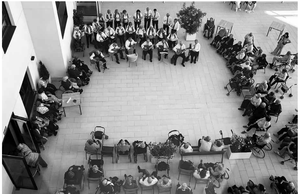
La rondalla durante su actuación en nuestro patio.

Nuestra residencia vivió el 21 de mayo una jornada muy especial con la visita del grupo de rondalla del Centro de Mayores de Albacete, que llenó el patio de música, alegría y recuerdos compartidos. Desde su llegada, crearon un ambiente cercano que invitaba a participar. Con sus instrumentos tradicionales interpretaron canciones populares que conectaron rápidamente con los residentes, despertando emociones y evocando recuerdos. Pero no solo se trató de escuchar: los residentes acompañaron con palmas, tararearon e incluso algunos se animaron a cantar, generando un ambiente muy emotivo (incluso hay quien se movió más que en gimnasia). Actividades como esta refuerzan el compromiso de Amavir Albacete con el envejecimiento activo y la mejora de la calidad