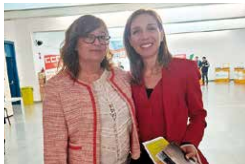
La alcaldesa de Alcorcón, Candalaria Testa, visita el stand de Amavir en la Feria de Empleo de la ciudad.