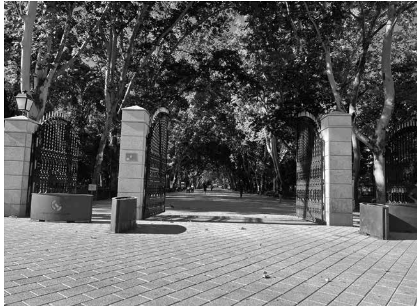
Parque Abelardo Sánchez.

El Parque de Abelardo Sánchez es uno de los espacios verdes más emblemáticos de Albacete y se encuentra en el corazón de la ciudad. Con una extensión amplia, combina zonas ajardinadas, paseos peatonales y áreas de descanso, ofreciendo un lugar de esparcimiento para todas las edades. Sus caminos serpenteantes están rodeados de árboles centenarios que proporcionan sombra y frescor durante los días calurosos. Destacan sus fuentes ornamentales, estanques y esculturas que aportan un toque artístico al entorno natural. El parque cuenta con áreas infantiles, gimnasios al aire libre y zonas para practicar deporte, fomentando la actividad física. Durante todo el año, es un lugar de encuentro para paseos,