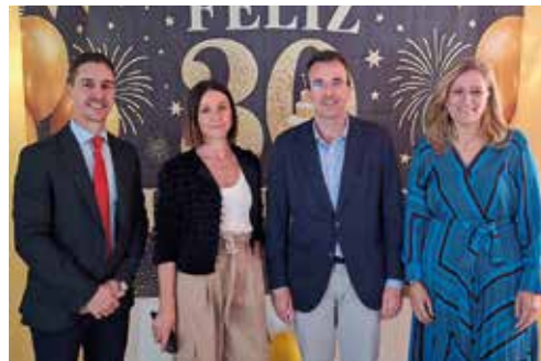
El alcalde de Leganés, Miguel Ángel Recuenco, visitó la residencia Amavir El Encinar-Leganés con motivo de la celebración del 30.º aniversario de la apertura del centro.