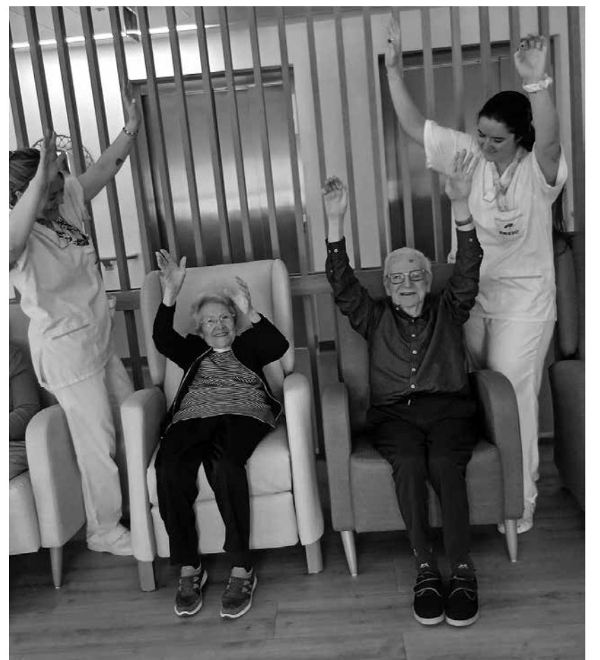
Actividades indirectas en la residencia.

El personal de atención directa desempeña un papel crucial en la calidad de vida de los residentes, convirtiéndose en un apoyo emocional, social y humano imprescindible. No solo atienden necesidades asistenciales, sino que también impulsan actividades indirectas en las unidades de convivencia que fomentan la autonomía, participación y bienestar emocional a través de ocupaciones terapéuticas. Estas rutinas ocupacionales diarias contribuyen al mantenimiento funcional, la estimulación cognitiva y física, y el bienestar emocional de nuestros usuarios. Estos momentos se convierten en espacios de motivación y convivencia donde los residentes participan activamente y refuerzan su autoestima.