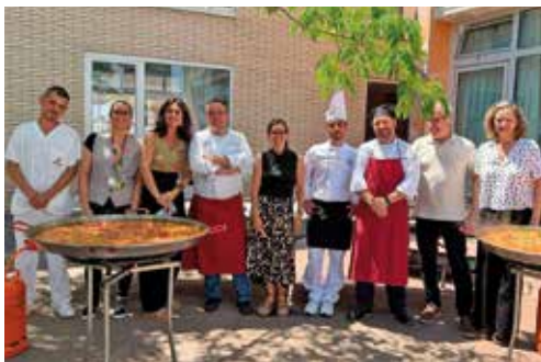
Visita de la alcaldesa de Teià (Barcelona) a Amavir Teià con motivo de la paellada organizada para celebrar con usuarios, familiares y trabajadores el 21.º aniversario de la residencia.