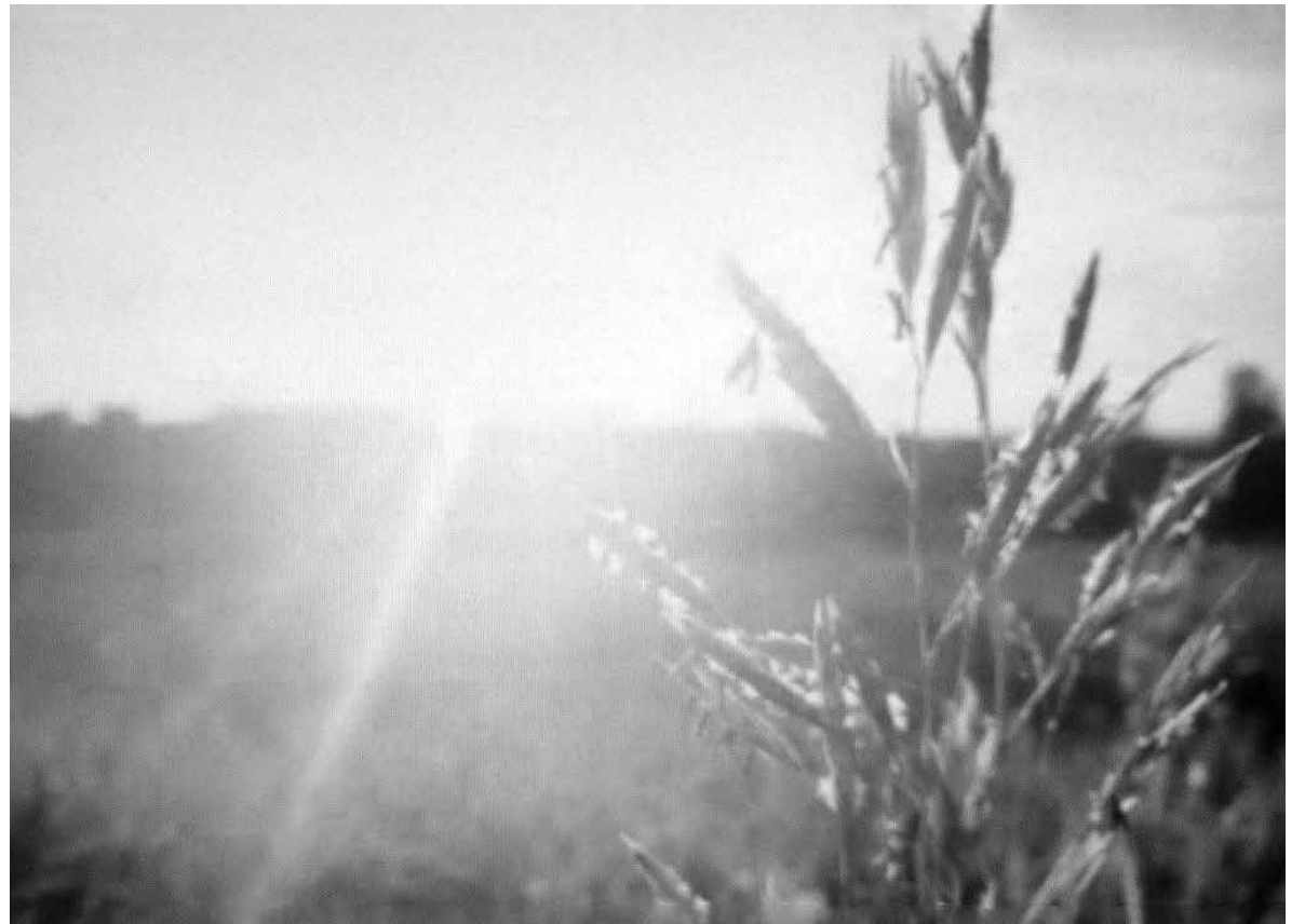
El sol es una fuente de vitamina D.

El déficit de vitamina D puede provocar la aparición de osteoporosis y raquitismo. También interviene en la regulación de los niveles de calcio y fósforo en sangre. Promueve su absorción intestinal a partir de los alimentos y la reabsorción de calcio a nivel renal. Participa en el desarrollo del esqueleto mediante la contribución de la formación y la mineralización ósea. Interviene en los procesos del sistema inmunológico y tiene funciones de antienvjecimiento. La manera de obtener nuestro organismo la vitamina D, es a través de la exposición a los rayos solares (Ultravioleta) y por el consumo de alimentos ricos en esta vitamina, como la leche, el huevo, los pescados grasos, las carnes y los champiñones. Tampoco tenemos que excedernos, pues un exceso de vitamina D en el organismo es contraproducente, ya que puede