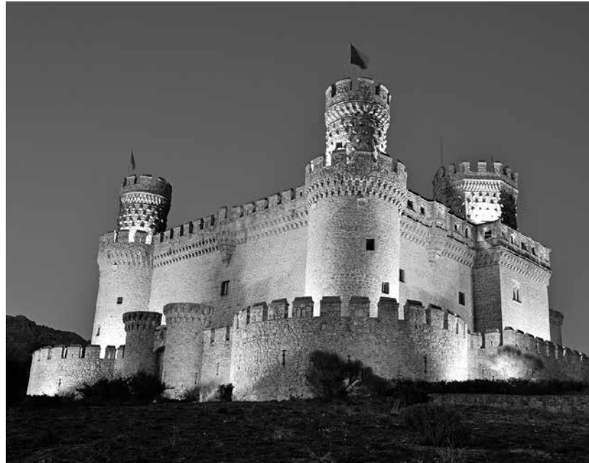
Castillo de Manzanares.

Se encuentra en la orilla del embalse de Santillana, formado por las aguas del río Manzanares, que atraviesa el municipio, puerta de entrada a la Pedriza, perteneciente a la Red Mundial de Reservas de la Biosfera. Un lugar ideal para el senderismo, la escalada... Recorrer el Puente Viejo de la Cañada Real Segoviana, que servía para unir La Rioja con Extremadura, lugar en el que se cobraba el impuesto del “pontazgo”, tasa a pagar para cruzarlo. Diego Hurtado de Mendoza y Figueroa, I Duque del Infantado, ordenó construir, sobre un cerro que domina la Sierra de Guadarrama, el Castillo Nuevo de los Mendoza, una de las familias más poderosas del siglo XV y XVI. Fue construido en 1475 con