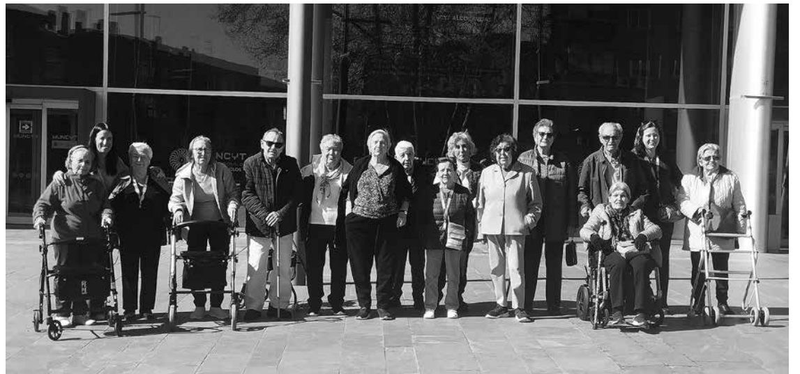
Visita al Museo Nacional de Ciencia y Tecnología.

Estamos ampliando el programa de salidas y excursiones por distintos lugares de interés cercanos a nuestro municipio. Entre las primeras experiencias, destaca la visita al Museo Nacional de Ciencia y Tecnología (MUNCYT), donde nuestros usuarios pudieron disfrutar de un recorrido fascinante a través de una línea temporal que mostraba la evolución de la tecnología, desde los dispositivos más antiguos hasta los más actuales. Fue una jornada enriquecedora que fomentó la curiosidad, los recuerdos y la conversación entre todos los participantes. Asimismo, hemos tenido la oportunidad de pasar una agradable mañana en el Parque El Cerrillo de Colmenar Viejo, un entorno natural en el que pudimos observar a los patos, contemplar el Pico de San Pedro y disfrutar de las vistas de nuestro pueblo, apreciando de primera mano su crecimiento y desarrollo. Esta salida permitió combinar actividad