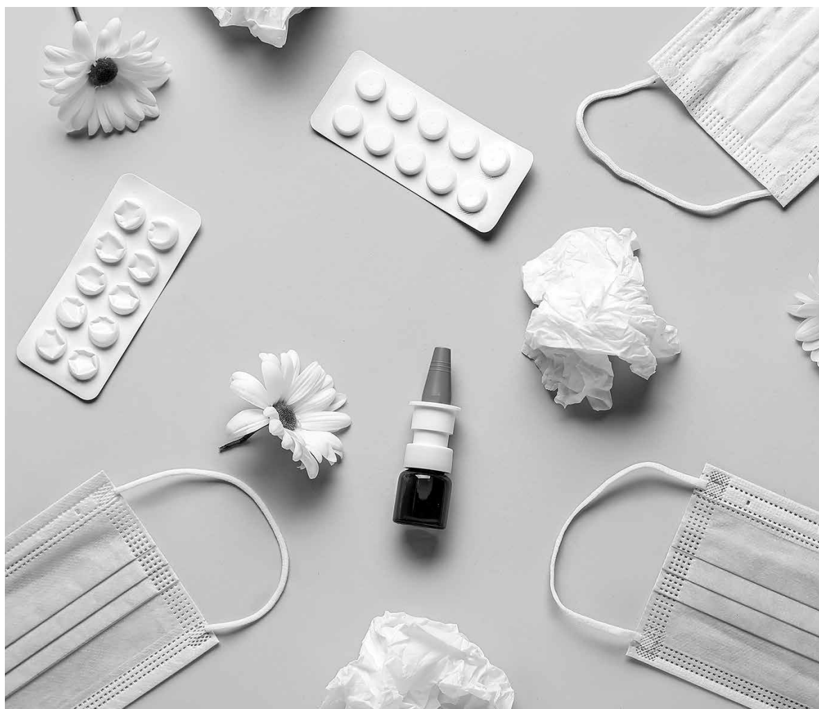
El control y la prevención, claves para evitar contagios.

En Amavir, la prevención y la vigilancia son fundamentales para garantizar la seguridad y bienestar de las personas mayores. El hantavirus es una enfermedad viral poco frecuente transmitida principalmente por el contacto con orina, saliva o heces de roedores infectados, o por inhalación de partículas contaminadas. Aunque el riesgo en residencias es bajo, el personal de enfermería cumple un papel esencial en la prevención y detección precoz. La observación continua de los residentes permite identificar síntomas como fiebre, dolor muscular, cansancio intenso o dificultad respiratoria, facilitando una actuación rápida y coordinada con el equipo médico. Además, enfermería participa activamente en la educación sanitaria del personal, promoviendo medidas como el correcto almacenamiento de alimentos, la higiene de las instalaciones, el control de residuos y la notificación inmediata ante cualquier indicio de plagas