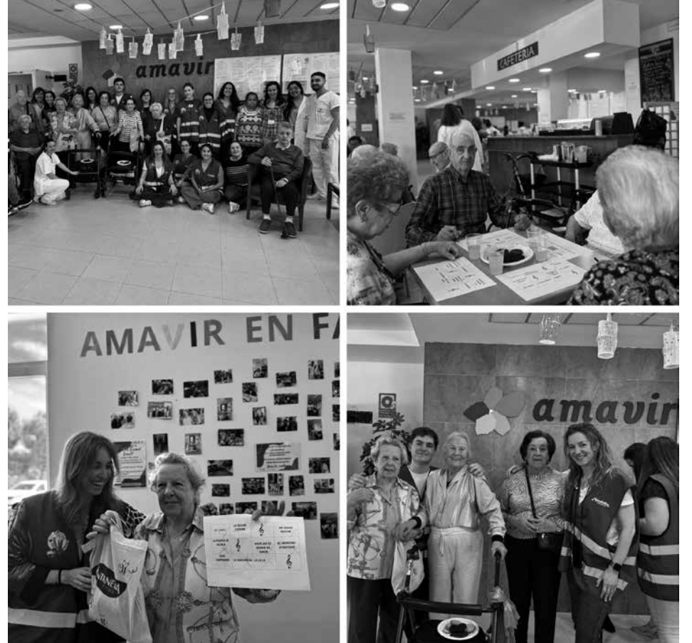
Bingo musical con Mondelez.

El pasado 28 de abril disfrutamos de una mañana diferente y especial con la celebración de un bingo musical en el que participaron residentes y usuarios del centro de día. La actividad contó con la colaboración de un grupo de voluntarios de Mondelez, que compartieron la jornada con todos nosotros aportando entusiasmo, cercanía y muchas ganas de disfrutar. La propuesta consistía en un divertido bingo acompañado de canciones de la época de nuestros mayores. A medida que iban sonando conocidos temas musicales, los participantes reconocían las melodías mientras completaban sus cartones. La música despertó numerosos recuerdos y convirtió la actividad en un momento lleno de alegría, participación y emoción. Durante la mañana se repartieron premios para quienes conseguían línea y bingo. Los afortunados recibieron surtidos de galletas y dulces de marcas tan conocidas como Fontaneda, Oreo y Príncipe, unos detalles que hicieron todavía más especial la experiencia y que fueron muy bien recibidos por todos. Fue una actividad muy dinámica y entretenida, en la que no faltaron los bailes, las