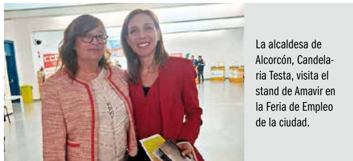
La alcaldesa de Alcorcón, Candalaria Testa, visita el stand de Amavir en la Feria de Empleo de la ciudad.