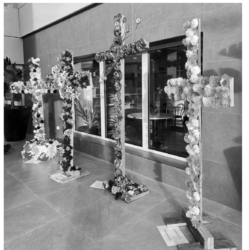
Algunas de las cruces elaboradas.

Durante el mes de mayo vivimos en la residencia una celebración muy especial del Día de las Cruces, llena de emoción y alegría compartida. Con la ayuda de un grupo de voluntarios, junto con las personas que viven aquí, se elaboraron cruces de madera hechas con mucho cariño. El 3 de mayo se expusieron en la entrada principal, llenando el espacio de belleza y orgullo compartido. Cada cruz reflejaba momentos de conversación, risas y trabajo hecho con ilusión. La jornada estuvo acompañada por una parranda musical que llenó la residencia de música, emoción y convivencia.