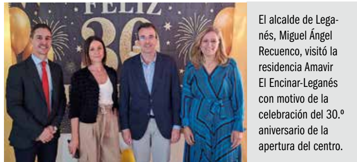
El alcalde de Leganés, Miguel Ángel Recuenco, visitó la residencia Amavir El Encinar-Leganés con motivo de la celebración del 30.º aniversario de la apertura del centro.