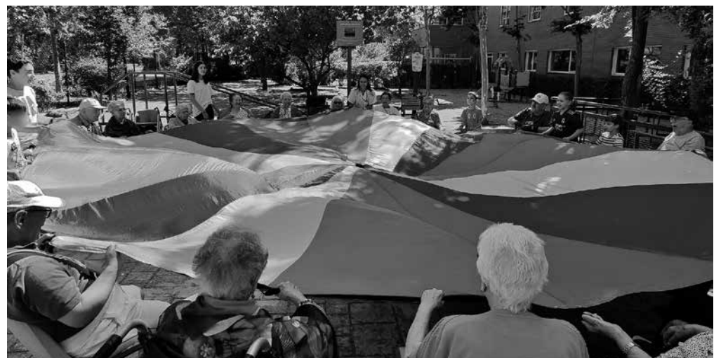
Niños y mayores jugando en el campamento.

Un año más hemos vuelto a recibir a los hijos e hijas de familiares y trabajadores para celebrar nuestro ya emblemático Campamento intergeneracional. Juntos, niños y mayores, hemos realizado diferentes actividades para pasar una semana divertida y enriquecedora. Con la ayuda de nuestra monitora, hemos llevado a cabo juegos tradicionales y cognitivos, un taller de cocina, la fiesta del agua que tanto nos gusta, karaokes, sesiones de manualidades, clases de gimnasia, e incluso un taller de primeros auxilios coordinado por nuestra enfermera. Se trata de una semana en la que, tanto niños como mayores, se divierten y aprenden unos de los otros, comparten experiencias e intercambian saberes y sonrisas.