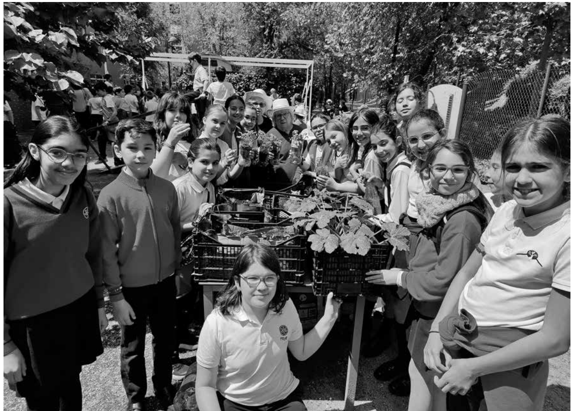
Enseñamos nuestro huerto a los niños del colegio.

Desde que se puso en marcha el huerto de la residencia, tanto residentes como usuarios de Centro de Día, se acercan todos los días a ver cómo nuestras plantas siguen creciendo y si necesitan algún cuidado, como una poda o un poco de agua. En el mes de mayo, por fin pudimos ver progreso al trasplantar los primeros brotes de calabacín, pepino y remolacha a macetas más grandes, hechas con material reciclado, esperando que los tomates, lechugas y espinacas crecieran un poco más antes de cambiarlos de maceta. Aunque la temporada de lluvia malogró alguna mata, tenemos esperanza en que, al final, tendremos recompensa. ¡Qué orgullo poder enseñárselo a los niños del Colegio Sta. M. a de la Providencia y del Colegio Ernest Hemingway! Nos ayudaron a podar y trasplantar las últi-