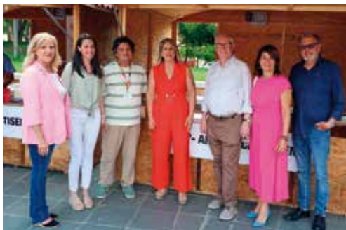
La alcaldesa de Cartagena, Noelia Arroyo, visita el stand de Amavir en la XVI Feria de Mayores de la ciudad.