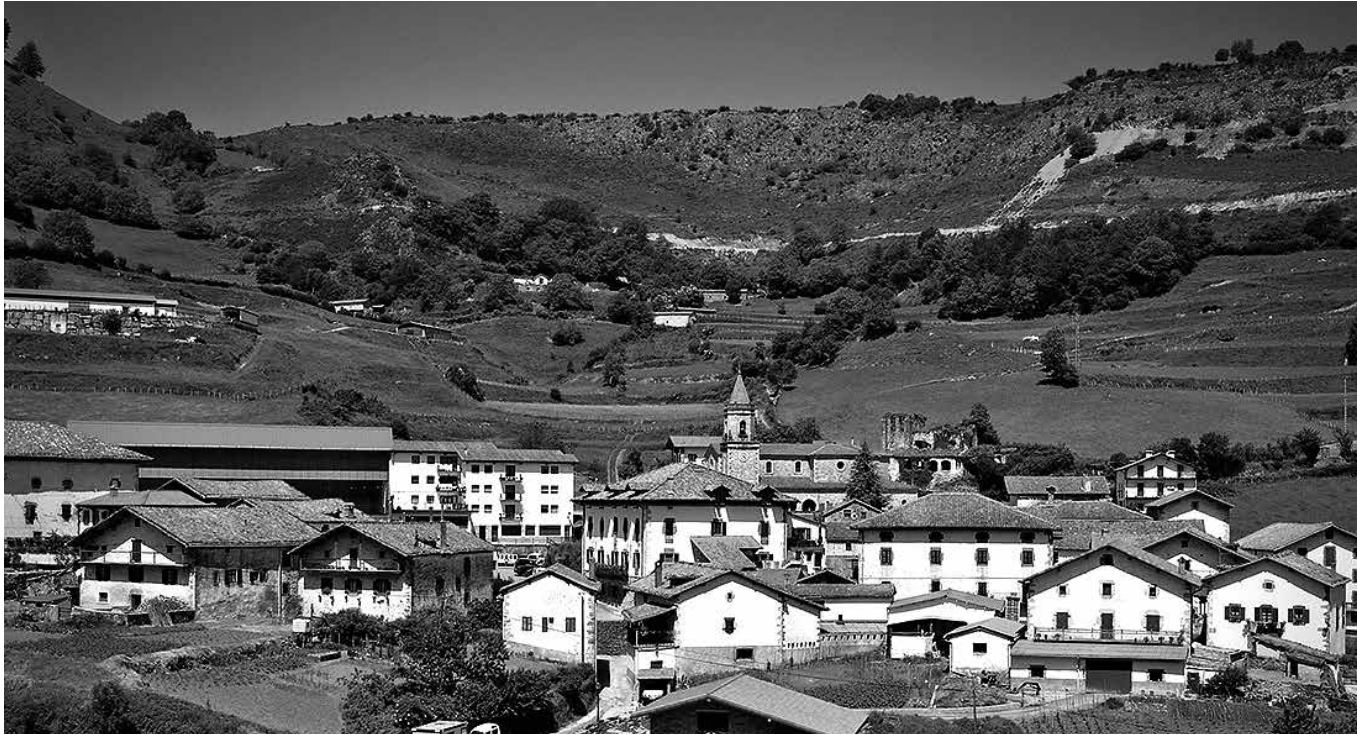
Imagen del bello pueblo de Almándoiz.