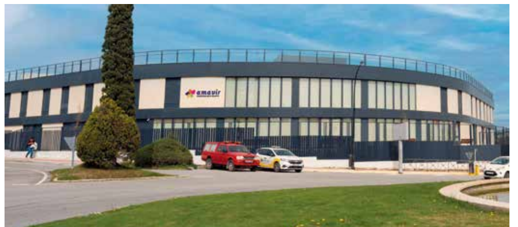
Residencia Amavir Ciudadalcampo.

La residencia Amavir Ciudadalcampo, ubicada en la urbanización de este mismo nombre situada al norte de la ciudad de Madrid, abrió sus puertas el pasado 6 de abril. Cuenta con 153 plazas, todas ellas privadas. Por su parte, Amavir Granada, ubicada en el municipio de Huétor Vega, a escasos minutos de la capital, inició su funcionamiento el 27 de abril y dispone de 120 plazas. Ambos centros cuentan con plantillas formadas por profesionales de diferentes disciplinas socio-sanitarias y de servicios de hostelería para ofrecer una atención integral a los usuarios que satisfaga todas sus necesidades. Ofrecen estancias permanentes y también estancias temporales (para respiro de familiares, convalecencia o rehabilitación). Desde el punto de vista arquitectónico, se han extremado las medidas de diseño y materiales para conseguir la máxima eficiencia energética.