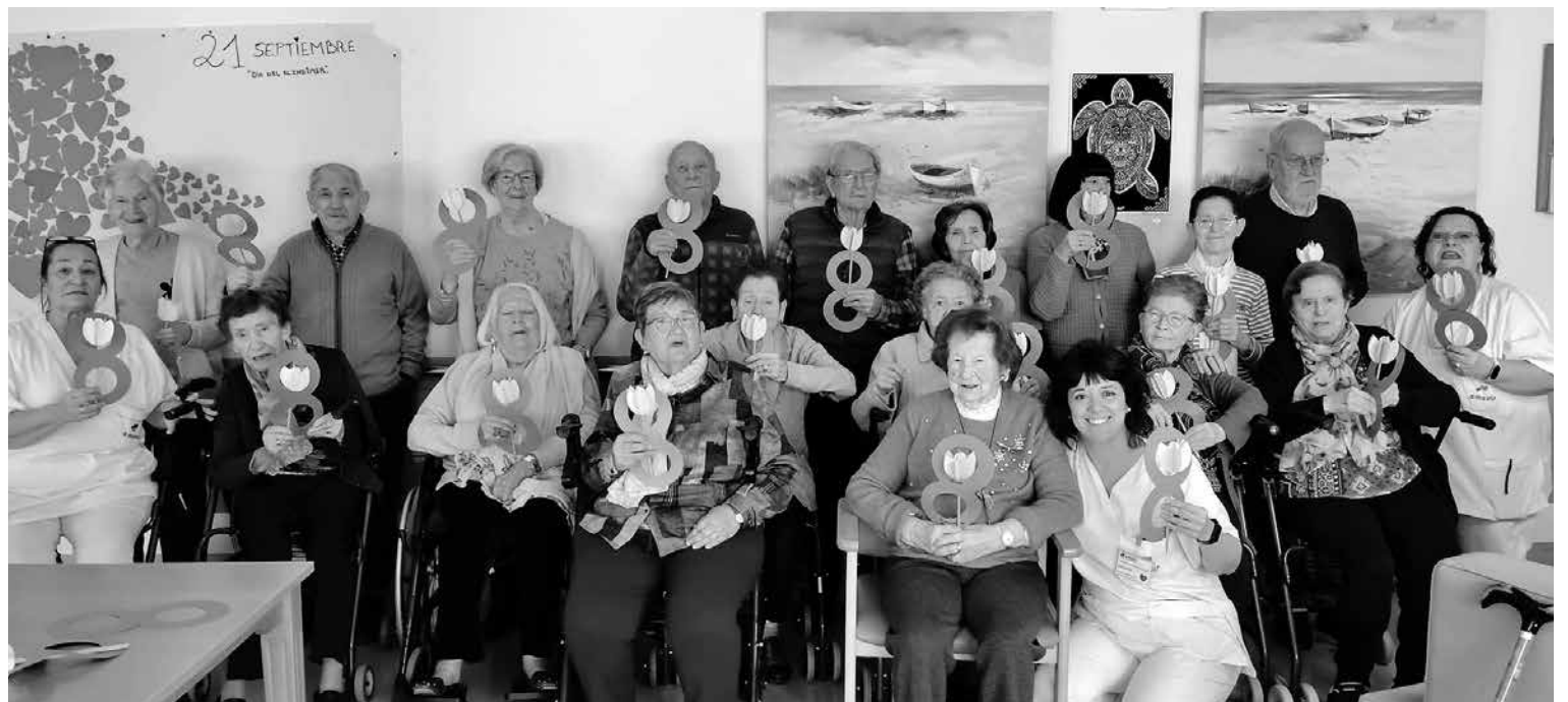
Participantes lucen sus manualidades.

En el Centro de Día hemos realizado una manualidad conmemorativa: un ocho de cartulina morada y adornado con una flor, símbolo de la vida y la resistencia que caracteriza esta fecha. Mientras nuestras manos, tijeras y pegamento han dado forma al papel, hemos hablado sobre la mujer en el trabajo, qué aptitudes originaron el cambio y cuáles son los principios de empoderamiento de las mujeres. A pesar de que el origen de este día está en un hecho que ocurrió en Nueva York en 1908, hemos aprendido que en Pamplona en 1903 hubo constancia de una huelga de mujeres de una empresa de calzados que causó gran expectación por su valentía y determinación. En 1951, las mujeres de Pamplona encabezaron una importante huelga general protestando por los precios de los huevos y el aceite y se extendió a los pueblos de Navarra. Este hecho tuvo eco en los periódicos internacionales más prestigiosos. Ha sido una mañana de convivencia que refuerza que aprender y compartir vivencias no tiene edad.