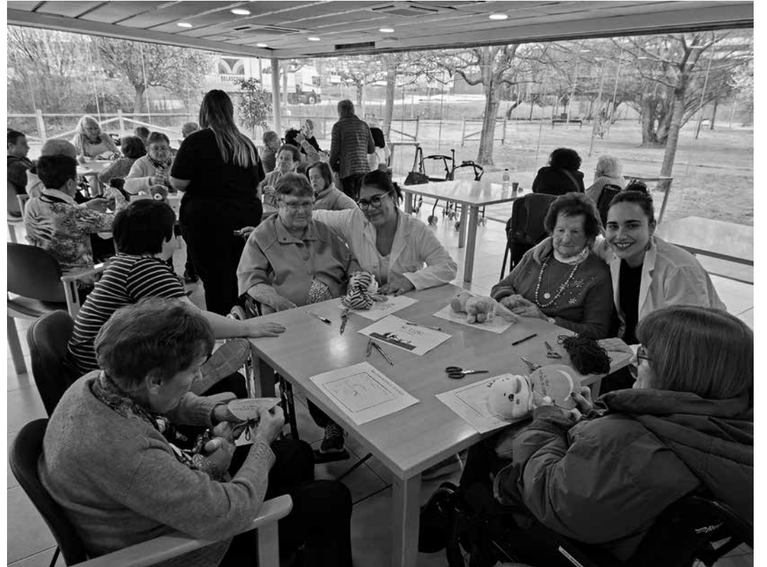
Alumnas y residentes disfrutando de la actividad.

El 25 de febrero, dos estudiantes de trabajo social de la Universidad Pública de Navarra, se incorporaron al equipo profesional como practicantes, para conocer el funcionamiento del centro y sobre todo para conocer el de nuestra profesión. Durante sus primeras semanas, han tenido la oportunidad de conocer e interactuar con diferentes residentes y diferentes profesionales. Han participado en la realización de entrevistas para la elaboración de los “Libros de Vida” y la recopilación de información relacionada con los deseos y preferencias de los usuarios. También en actividades intergeneracionales y recreativas organizadas junto a colegios y asociaciones, fomentando el contacto entre generaciones y el bienestar emocional y físico de los residentes. De la misma forma, han tenido la oportunidad de asistir a reuniones del equipo interdisciplinar donde se valoran los Planes de Atención Individualizada (PAI), lo que les ha permitido comprender la importancia del trabajo coordinado entre los distintos profesio-