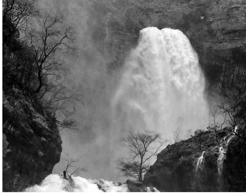
Chorros de agua y cascadas.

El Nacimiento del Río Mundo es uno de los parajes naturales más espectaculares de la provincia de Albacete. Se encuentra dentro del Parque Natural de los Calares del Mundo y de la Sima y marca el inicio del Río Mundo, afluente del Río Segura. El nacimiento surge en una gran cueva situada en un farallón rocoso, desde donde el agua brota formando una impresionante cascada de más de 80 metros de altura. Este fenómeno se debe a un sistema kárstico en el que el agua de lluvia se filtra por la roca caliza y se acumula en galerías subterráneas antes de salir al exterior. En ocasiones ocurre el fenómeno llamado “reventón”, cuando el caudal aumenta de for-