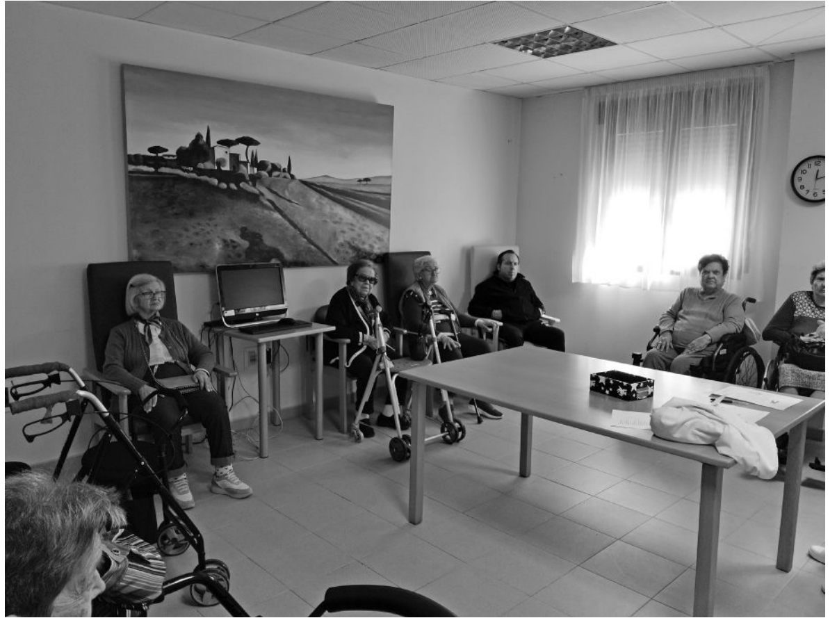
Un grupo de residentes durante una sesión.

Desde el departamento de terapia ocupacional se ha puesto en marcha un nuevo taller de reminiscencia. Esta actividad consiste en la visualización de vídeos sobre tradiciones y formas de vida de antaño, como el trabajo del esparto, las labores de la huerta, la elaboración de alimentos o el cuidado de animales entre muchos otros. Tras el visionado, se abre un espacio de conversación en el que los participantes pueden compartir recuerdos, experiencias y opiniones relacionadas con lo que han visto. Este tipo de taller tiene numerosos beneficios, ya que estimula la memoria al evocar vivencias del pasado, especialmente aquellas relacionadas con la juventud y la vida cotidiana de los residentes. Además, fomenta la comunicación y la interacción social, permitiendo que cada persona pueda expresarse, sentirse escuchada y conocer las historias de los demás compañeros. Asimismo, recordar experiencias significativas suele generar emociones positivas, reforzar la autoestima y fortalecer