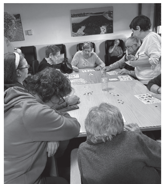
Residentes durante una estancia en planta.