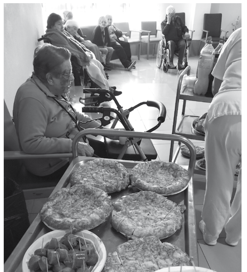
Nuestra tradicional comida del jueves lardero.

El Jueves Lardero, coincidiendo con el jueves previo al miércoles de Ceniza, se consolida desde hace siglos bajo la tradición cristiana como la "despedida a la carne", que da paso a los 40 días siguientes que componen el periodo de la Pascua en los que se acostumbraba a abstenerse de estos alimentos. Con el tiempo, dicha tradición se generalizó dando paso a una celebración sobre todo presente en Aragón y las Castillas, en las que se acostumbra a comer en el campo. Estando ubicados en Castilla-La Mancha, no podíamos ser menos. Por ello, tanto residentes como familiares y empleados pudimos disfrutar de compartir pan, tortilla y chorizo acompañados de experiencias y divertidas fotografías.