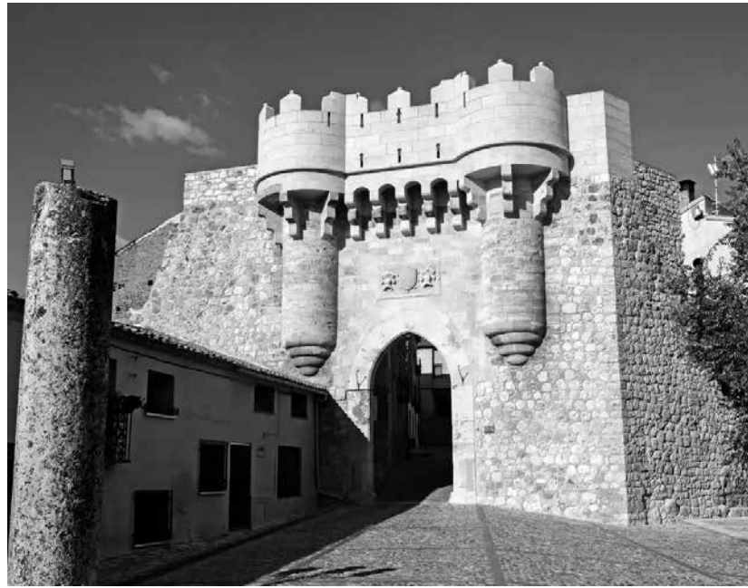
Castillo de Hita.

En el corazón de la provincia de Guadalajara, donde el perfil del cerro testigo domina el horizonte, se alza Hita. Esta villa, declarada Conjunto Histórico-Artístico, no es solo un punto en el mapa; es un viaje directo al siglo XIV, custodiado por el espíritu de Juan Ruiz, el célebre Arcipreste. Al cruzar la Puerta de Santa María, el visitante abandona el presente. Sus calles empedradas serpentean cuesta arriba, flanqueadas por “bodegos” y caserones. La Plaza del Arcipreste, con sus soportales de madera y piedra, actúa como el epicentro de un pueblo que parece detenido en el tiempo. Hita alcanza su máximo esplendor cada mes de julio con su famoso Festival Medieval. Es en este evento, declarado de Interés Turístico Nacional, donde las