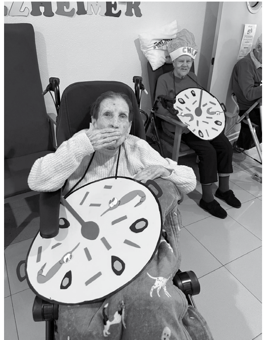
Disfraz de paella.

Con la llegada de febrero se acerca uno de los momentos más mágicos del año y llega ese día tan especial en el que surge la oportunidad de transformarse en cualquier cosa, el día en el que las máscaras están permitidas y todo el mundo se disfraza de lo más inesperado. No hay fiesta más internacional que el carnaval. Desde Brasil a Alemania, pasando por Colombia, México o España, con los carnavales de Cádiz y Tenerife rivalizando con los de Río de Janeiro, pero sobre todo los de La Alameda. Como cada año, nuestros residentes han estado preparando los disfraces con ilusión, esperando con ansia que llegase el día para poder lucirlos. Este febrero, en el desfile de disfraces de La Alameda, se ha podido ver bailando a galletas, patatas fritas, paellas, cocineros, churros, huevos fritos, patas de jamón y "gildas". Con una temática gastronómica, nuestros residentes disfrutaron de un día lleno de risas, diversión y baile. Una vez terminada la fiesta, únicamente nos queda reír mirando las fotografías y ponernos a pensar en la temática de los disfraces del año que viene.