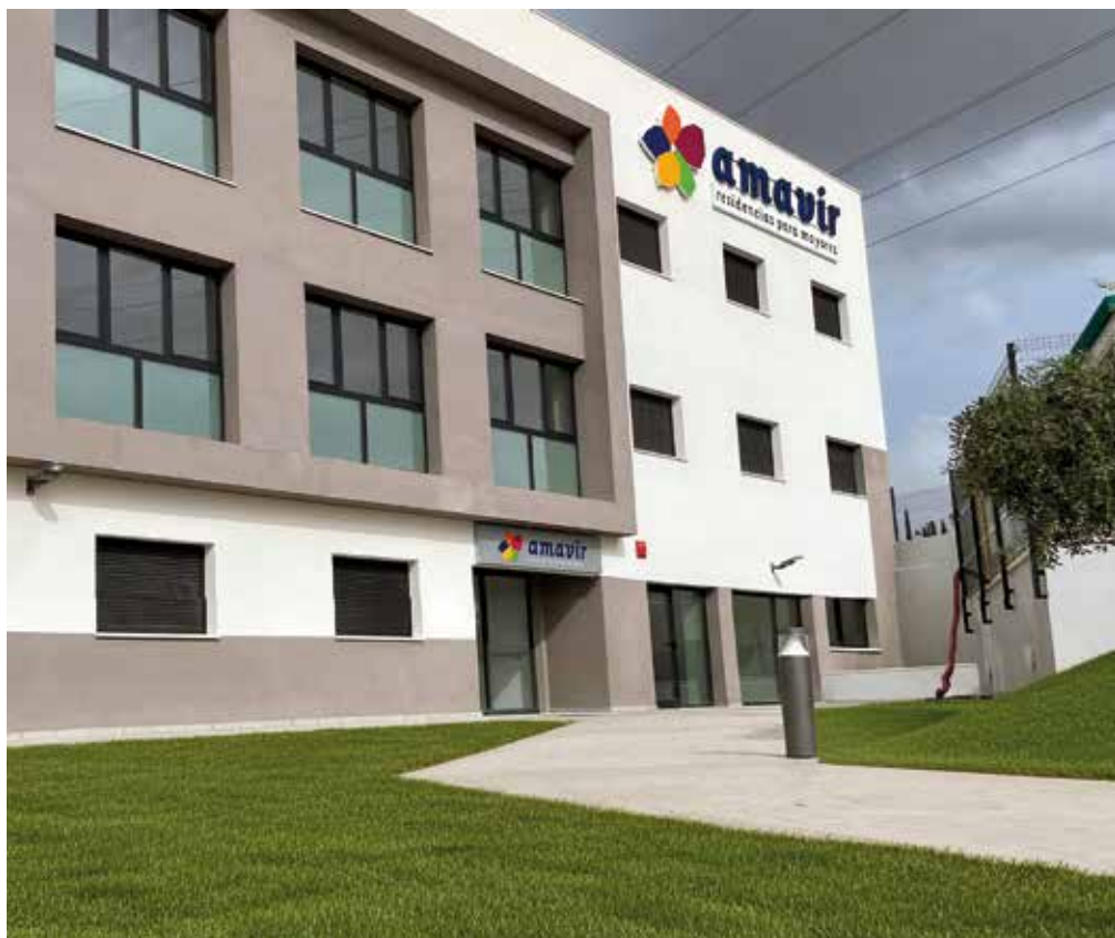
Residencia Amavir Granada.

Con estos nuevos centros, la compañía suma 50 residencias y 41 centros de día en 8 comunidades autónomas, con 9.117 plazas en total y 5.400 trabajadores.