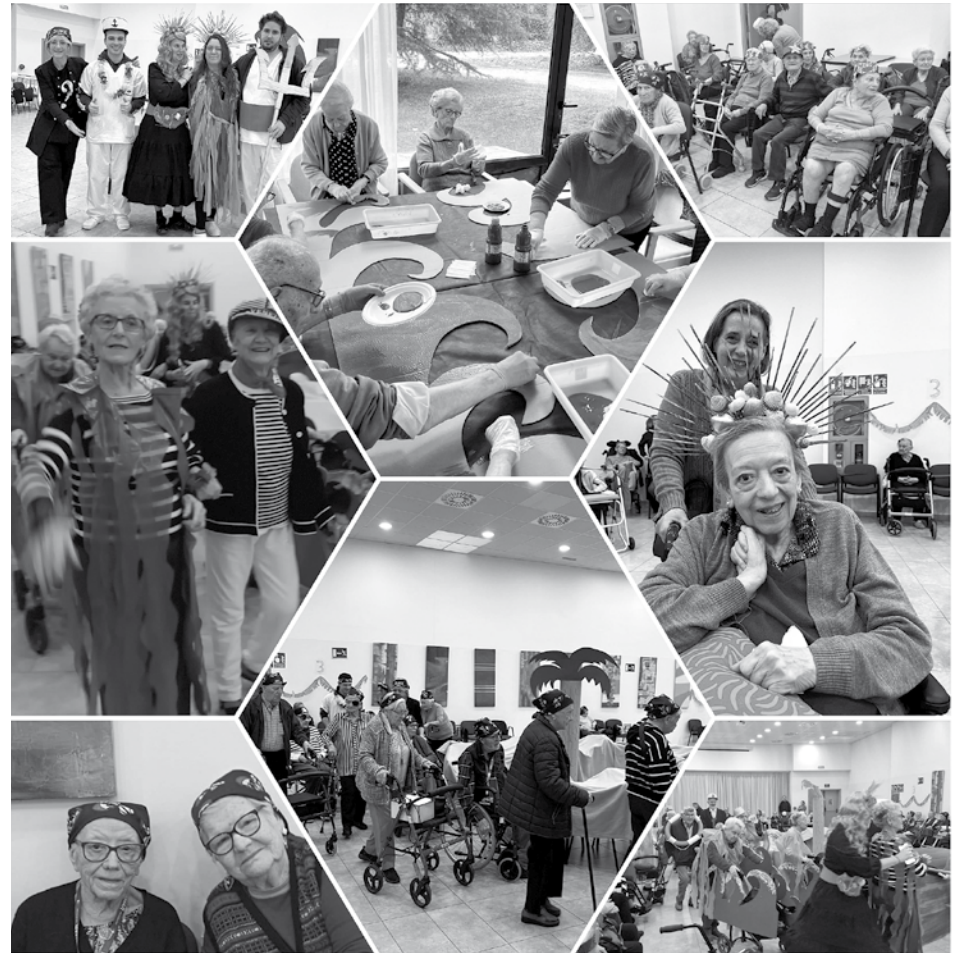
Desfile en los carnavales de 2026.

El pasado 13 de febrero de 2026 la residencia celebró la fiesta de Carnaval con una actividad que implicó a residentes, auxiliares, equipo técnico e incluso a algunas familias. La propuesta se presentó previamente en la reunión diaria del centro para animar a todas las plantas a preparar su propia comparsa y disfraz. La temática escogida este año fue el mar, y cada planta decidió cómo representarlo. Durante tres semanas residentes y profesionales trabajaron juntos en la elaboración de disfraces y complementos, fomentando la creatividad, la participación y el trabajo en equipo. El día de la celebración, a las 11 de la mañana, la fiesta tuvo lugar en la sala de actos de la planta -2. El equipo técnico preparó el espacio con sillas alrededor de una isla simbólica decorada con arena y una palmera. Desde las zonas asignadas, los grupos fueron llamados para desfilarse alrededor de la isla al ritmo de la música que habían escogido. La cuarta planta presentó una escena marinera con barcas, olas, capitanes y marineros; la tercera se transformó en un grupo de piratas; y la segunda recreó el fondo del mar con diferentes elementos marinos. Algunos residentes de primera planta participaron como espectadores y otros también se animaron a disfrazarse. Al finalizar, la