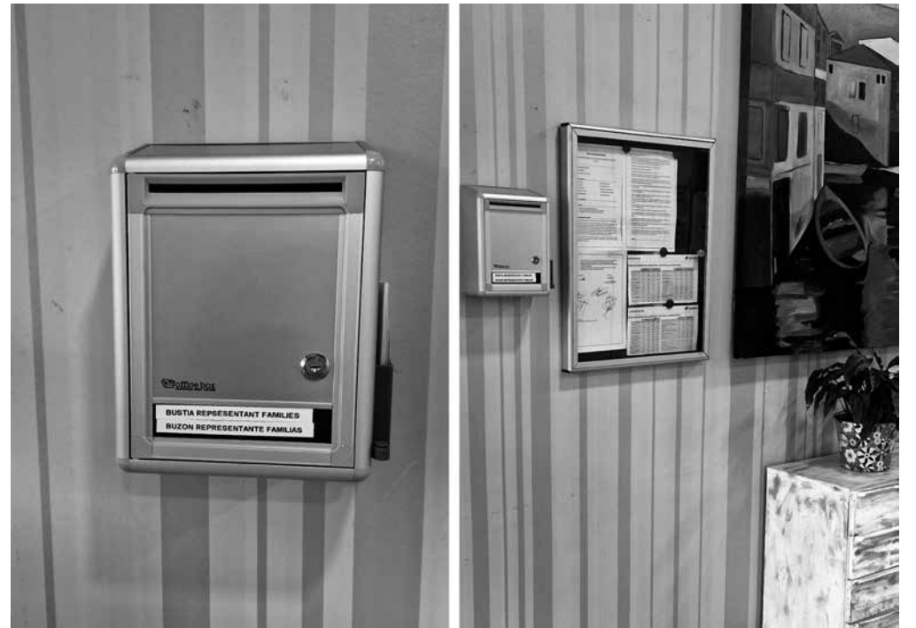
Nuevo buzón en la entrada.

Con el objetivo de seguir fomentando la transparencia y la participación en la vida del centro, se ha instalado un buzón a la entrada de la residencia, junto a recepción. A través de este espacio, las familias pueden dejar escritos dirigidos a la representante de familias en el Consell de Participació del Centre (CPC), para que sus sugerencias, preguntas o propuestas puedan trasladarse a las reuniones del Consejo. Si lo desean, también pueden dejar su correo electrónico o teléfono para facilitar una respuesta directa. El Consell de Participació del Centre es un órgano de participación presente en los centros de servicios sociales públicos o con financiación de la Generalitat de Catalunya. Su misión es crear un espacio de información, consulta y diálogo entre todas las personas que forman parte del centro. Entre sus funciones se encuentran informar sobre la programación anual de actividades, conocer la marcha general del servicio, valorar la