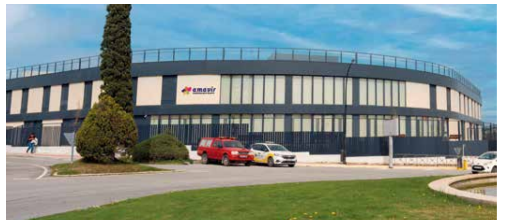
Residencia Amavir Ciudadalcampo.

La residencia Amavir Ciudadalcampo, ubicada en la urbanización de este mismo nombre situada al norte de la ciudad de Madrid, abrió sus puertas el pasado 6 de abril. Cuenta con 153 plazas, todas ellas privadas. Por su parte, Amavir Granada, ubicada en el municipio de Huétor Vega, a escasos minutos de la capital, inició su funcionamiento el 27 de abril y dispone de 120 plazas. Ambos centros cuentan con plantillas formadas por profesionales de diferentes disciplinas socio-sanitarias y de servicios de hostelería para ofrecer una atención integral a los usuarios que satisfaga todas sus necesidades. Ofrecen estancias permanentes y también estancias temporales (para respiro de familiares, convalecencia o rehabilitación). Desde el punto de vista arquitectónico, se han extremado las medidas de diseño y materiales para conseguir la máxima eficiencia energética.