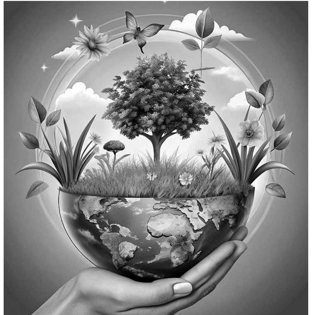
Comprometidos con el medio ambiente.

Nos preparamos para la llegada del buen tiempo con mucho entusiasmo y ganas de disfrutar de las actividades al aire libre. Durante esta época, las excursiones cobran especial protagonismo, siendo además una de las favoritas y más deseadas por nuestros residentes y usuarios de centro de día. En ellas aprovechamos para visitar sitios interesantes como museos, exposiciones, mercadillos, etc., así como un ratito de ocio y tertulia mientras nos hidratamos en alguna terraza al rico solecito. También se aproxima mayo, un mes acompañado por las rondallas de nuestra localidad que nos amenizan los días con sus melodías. Además, fomentaremos el compromiso de nuestro centro con el medio ambiente realizando actividades relacionadas con la naturaleza (huerto aromático, paseos, manualidades con material reciclado, etc.). No queremos dejar en el olvido la celebración de los cumpleaños, ese pequeño homenaje que hacemos cada mes a los cumpleaños, en el que les entregamos un detalle y bailamos al ritmo de la música.