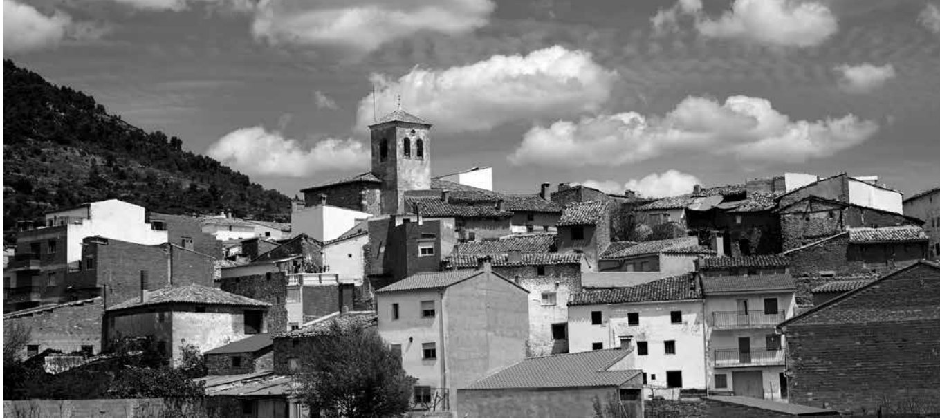
Panorámica del municipio.

Con la llegada del buen tiempo, os invitamos a visitar Villar del Humo y realizar una agradable ruta. Es una pequeña localidad de la serranía de Cuenca que esconde muchos secretos culturales y naturales. En esta ruta disfrutaréis del paseo fluvial a orillas del río Vencherque. Se trata de un recorrido llano, sin dificultad, que discurre muy cerca del cauce de un río de media montaña. Los intereses principales del recorrido son: el propio cauce recuperado y acondicionado, el