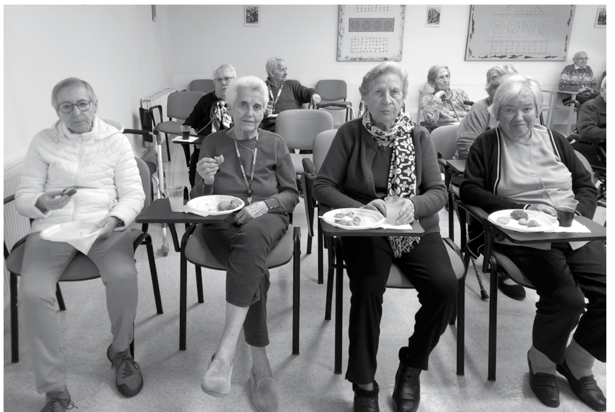
Nuestras residentes disfrutando de la celebración.

Una celebración importante y emotiva para nosotros es el aniversario del centro, celebrado el 26 de enero de cada año. Ya van 21 años desde que las autoridades de nuestra localidad y comunidad visitaron por primera vez este centro para su inauguración. Por esta razón, quisimos darle especial relevancia a este día tan señalado en el calendario con una fiesta llena de alegría y música, acompañada además de un rico aperitivo y refrescos, por cortesía de la empresa de cocina del centro (Aramark). Sin duda una mañana agradable para combatir el frío invierno.