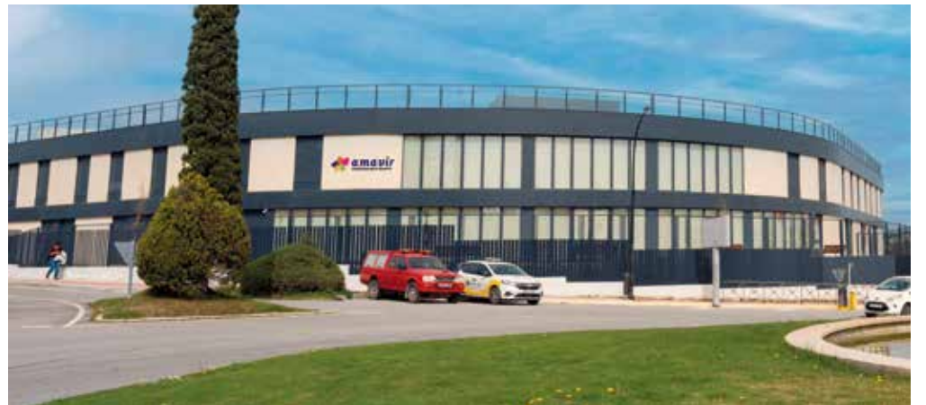
Residencia Amavir Ciudadalcampo.

La residencia Amavir Ciudadalcampo, ubicada en la urbanización de este mismo nombre situada al norte de la ciudad de Madrid, abrió sus puertas el pasado 6 de abril. Cuenta con 153 plazas, todas ellas privadas. Por su parte, Amavir Granada, ubicada en el municipio de Huétor Vega, a escasos minutos de la capital, inició su funcionamiento el 27 de abril y dispone de 120 plazas. Ambos centros cuentan con plantillas formadas por profesionales de diferentes disciplinas socio-sanitarias y de servicios de hostelería para ofrecer una atención integral a los usuarios que satisfaga todas sus necesidades. Ofrecen estancias permanentes y también estancias temporales (para respiro de familiares, convalecencia o rehabilitación). Desde el punto de vista arquitectónico, se han extremado las medidas de diseño y materiales para conseguir la máxima eficiencia energética.