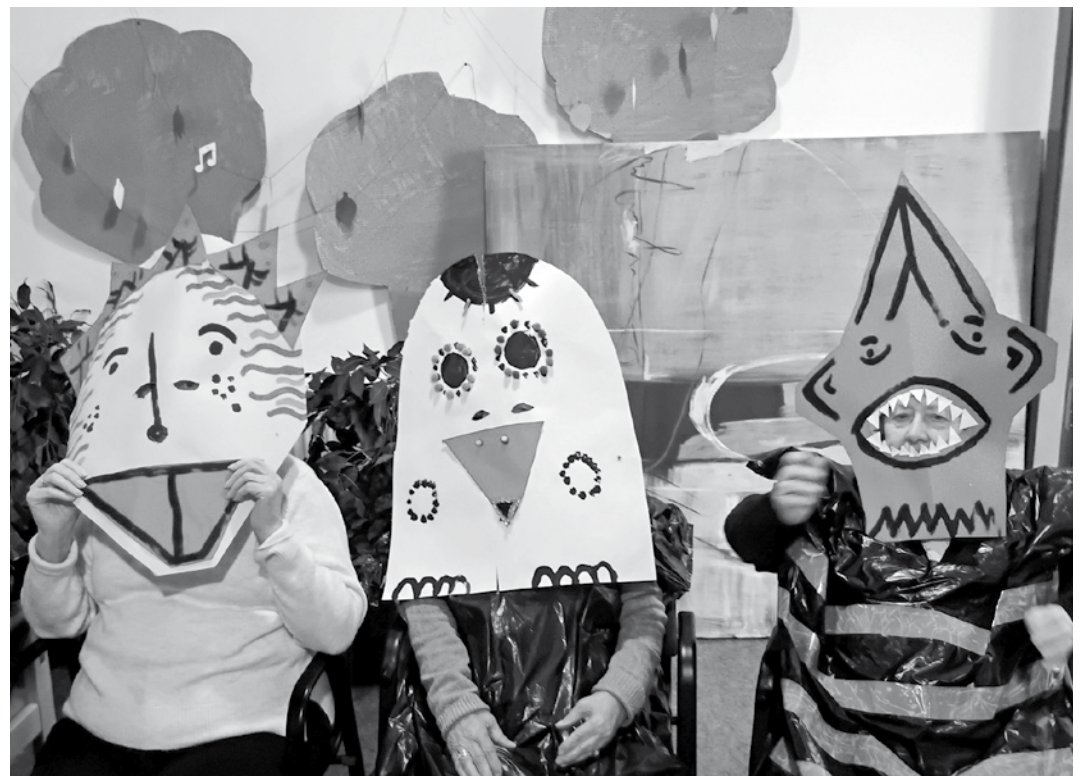
Disfraces realizados por los mayores.

Durante el evento, los residentes participaron en actividades de estimulación sensorial con colores, así como en talleres de manualidades, donde pudieron crear animales y elementos para sus disfraces, fomentando su creatividad y habilidades motrices. La celebración también tuvo un componente intergeneracional, ya que las familias se sumaron a la actividad, compartiendo momentos entrañables y fortaleciendo los vínculos afectivos con sus mayores. La risa, la música y el entusiasmo fueron protagonistas, contribuyendo a un ambiente festivo y motivador que favorece el bienestar emocional de todos los participantes. Este carnaval no solo permitió disfrutar de la diversión y el juego, sino que también se convirtió en una oportunidad para estimular la imaginación, la coordinación y la socialización, promoviendo la participación de los residentes en cada momento de la jornada.