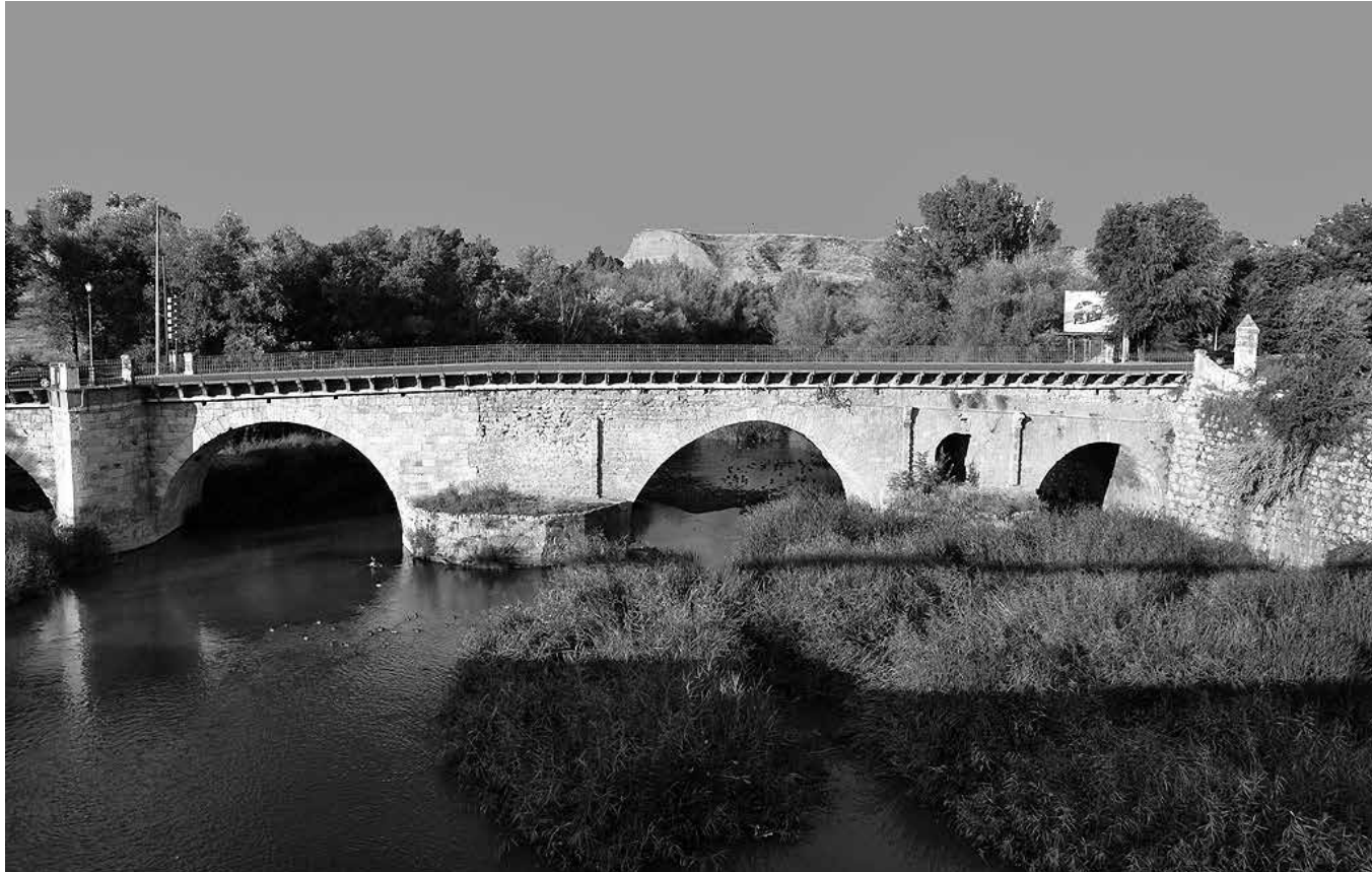
El río Henares a su paso por Guadalajara.

A orillas del río Henares, en Guadalajara, muchas generaciones han paseado y han creado recuerdos que aún hoy permanecen en la memoria. Hace años, los vecinos bajaban al río para caminar, pescar o simplemente sentarse a escuchar el sonido del agua. En verano, las familias buscaban la sombra de