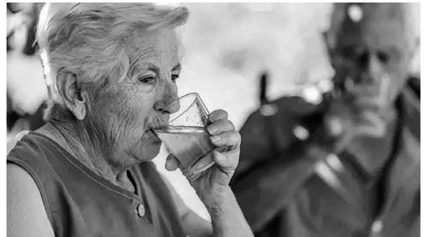
La hidratación, fundamental para todos.

Una dieta adecuada, rica en proteínas, previene la sarcopenia y la fragilidad, manteniendo la capacidad funcional. La hidratación adecuada mejora el rendimiento cerebral, evitando la confusión aguda, mareos y somnolencia, síntomas comunes de deshidratación. Una correcta alimentación reduce el riesgo de padecer enfermedades crónicas como diabetes, hipertensión o problemas cardiovasculares, y ayuda a controlar el peso. Una buena hidratación y nutrición es vital para prevenir la aparición y que se agrave el estado de úlceras por presión. El aporte adecuado de fibra y líquidos ayuda a combatir el estreñimiento, y una buena nutrición fortalece el sistema inmunológico, reducido en la vejez. Debido a que la sensación de sed disminuye con la edad, no se debe esperar a que el residente pida agua. Se recomienda ofrecer líquidos regularmente, incluyendo infusiones, caldos y frutas. Es común la pérdida de piezas dentales o la dificultad para tragar (disfagia), por lo que se deben adaptar las texturas. Dado que el gusto y olfato disminuyen, se deben usar especias para hacer la comida más apetecible. Comer en compañía y en un