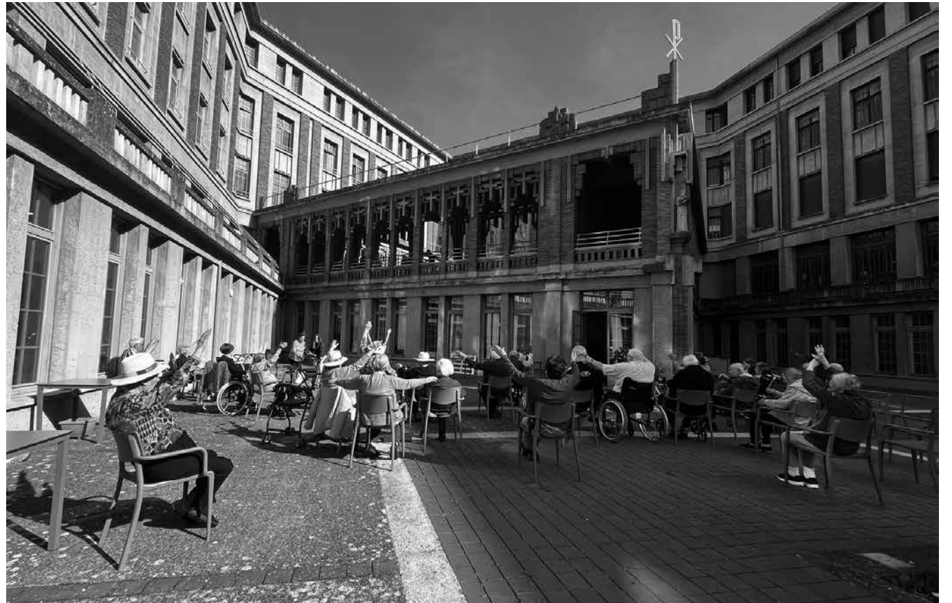
Residentes haciendo gimnasia en el patio.

En nuestra residencia aprovechamos esta estación para pasar más tiempo fuera y compartir momentos agradables en compañía. Contamos con varios espacios que hacen que esta época sea todavía más especial. Nuestro jardín, con zona de gimnasio y parque infantil para las visitas, se convierte en un lugar ideal para pasear, hacer ejercicio suave y disfrutar de la naturaleza. También el patio interior es un espacio muy agradable donde residentes y profesionales pueden reunirse, conversar y relajarse al sol. Durante estos meses trasladamos muchas de nuestras actividades al exterior. Juegos, talleres y momentos de ocio se realizan al aire libre siempre que el tiempo lo permite. Una de las actividades favoritas es