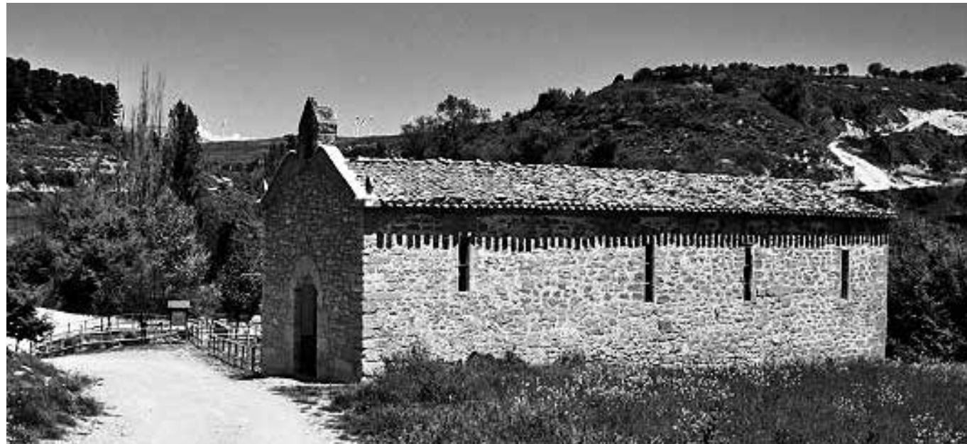
San Isidro Labrador en Aras.

El 15 de mayo se celebran las fiestas de San Isidro Labrador, el patrón de los agricultores. La celebración comienza con una romería a la ermita de San Isidro, donde la comunidad se reúne en un ambiente de festividad y respeto. Este acto simboliza no solo un peregrinaje físico, sino también un viaje espiritual, llevando a los fieles hacia un lugar de significado histórico y religioso. En la ermita, se celebra una misa en honor a San Isidro y, tras la misa, el ayuntamiento ofre-