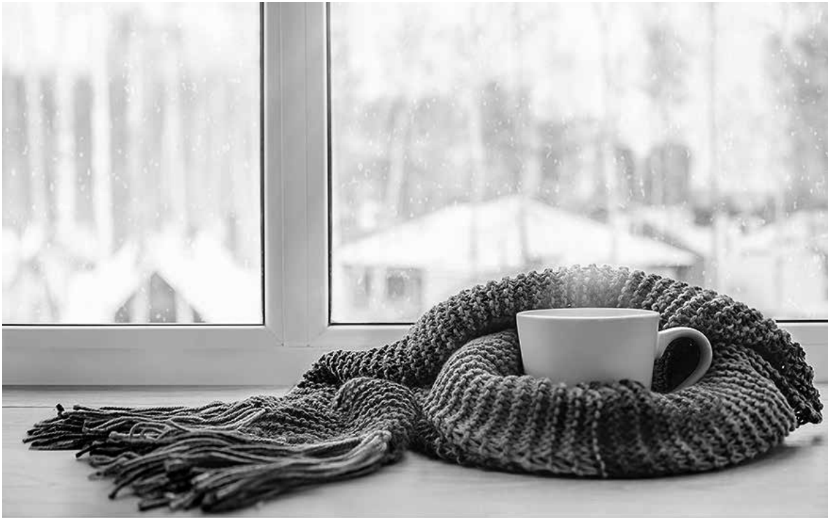
Imagen de invierno.

En esta época del año, el descenso de las temperaturas y el aumento de la humedad pueden suponer un riesgo considerable, especialmente para quienes presentan enfermedades respiratorias crónicas, problemas de movilidad o un sistema inmunológico más vulnerable. Desde nuestra experiencia diaria en la atención geriátrica, queremos compartir algunas recomendaciones que pueden ser útiles: 1. Ropa adecuada y protección térmica. 2. Espacios bien climatizados y ventilados. 3. Alimentación equilibrada y rica en nutrientes. 4. Ejercicio físico adaptado. 5. Prevención y seguimiento médico. 6. Cuidado emocional. En conclusión, Pozuelo de Alarcón, como muchos municipios de la Comunidad de Madrid, experimenta inviernos con temperaturas bajas y días más cortos, lo que nos obliga a extremar los cuidados hacia nuestros mayores.