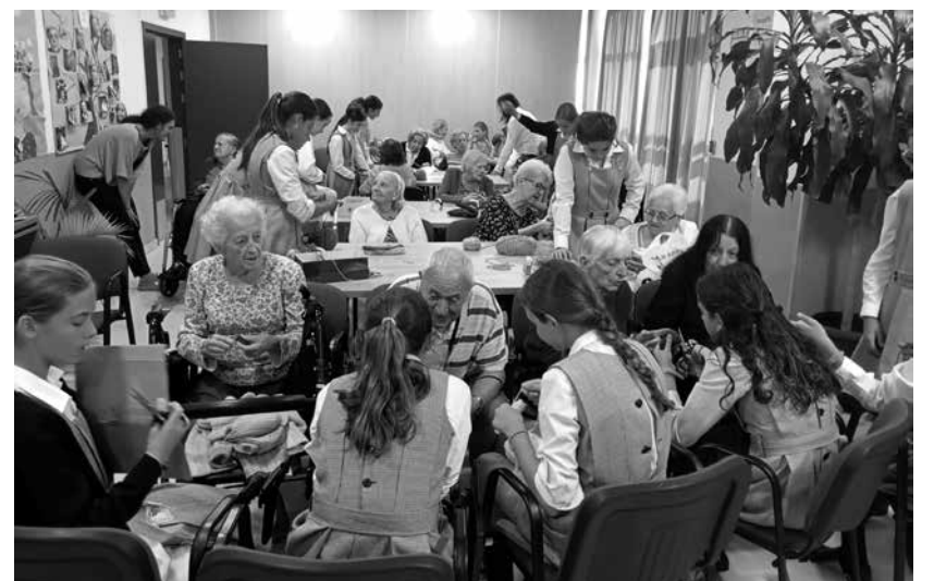
Las niñas llevaron alegría a los residentes.

Estudiantes del colegio Mater Salvatoris visitaron el centro para compartir una emotiva jornada intergeneracional que unió a las niñas con nuestros residentes. La actividad se desarrolló por la mañana. Comenzó con un concierto de canciones populares, donde grandes y pequeñas cantaron al unísono en un ambiente cálido y festivo. Posteriormente, todos participaron en un taller de manualidades para crear pompones de colores, fomentando así la creatividad y el trabajo en