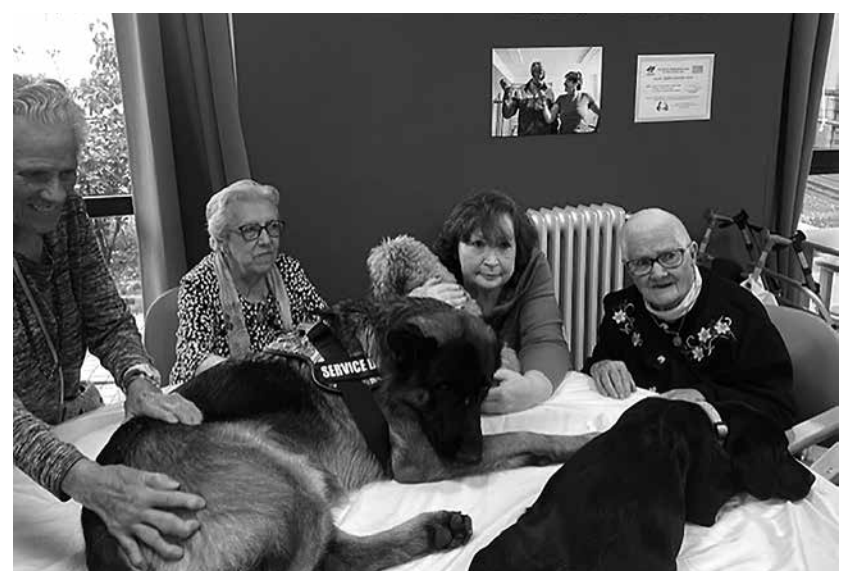
Nuestros residentes durante la sesión con animales.

En Amavir Patones celebramos una nueva sesión de terapia asistida con animales. Nuestros residentes disfrutaron de la compañía de Marisol, Risco, Kenia, Paquito y Bertín, fortaleciendo el bienestar emocional y la interacción social. Estas terapias tienen numerosos beneficios: la presencia de los perros ayuda a reducir la ansiedad y el estrés, mejora el estado de ánimo y facilita la expresión de emociones. Además, anima a participar a personas más retraídas, favoreciendo que se relacionen con otros residentes y con el equipo profesional. Las caricias, el juego y las órdenes que se dan a los animales contribuyen a mantener la