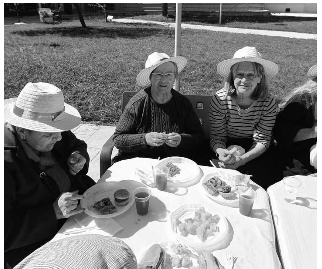
Residentes disfrutando de una jornada gastronómica al más estilo americano.

Las buenas temperaturas de este otoño nos permitieron recibirlo con una barbacoa al estilo americano en nuestro jardín. La mañana comenzó con una feria de juegos organizada por nuestro personal, tiro al blanco, carretas de caballos, tiros libres y muchas otras actividades que nos hicieron movernos y sacar nuestro lado más competitivo. La música amenizó la mañana, que terminó con una comida en la que degustamos hamburguesas, perritos calientes, pizzas y muchos otros aperitivos que nos hicieron disfrutar de un día diferente lleno de risas, compañerismo y cariño. Las nubes van llegando en el otoño, pero nosotros ponemos al mal tiempo buena cara.