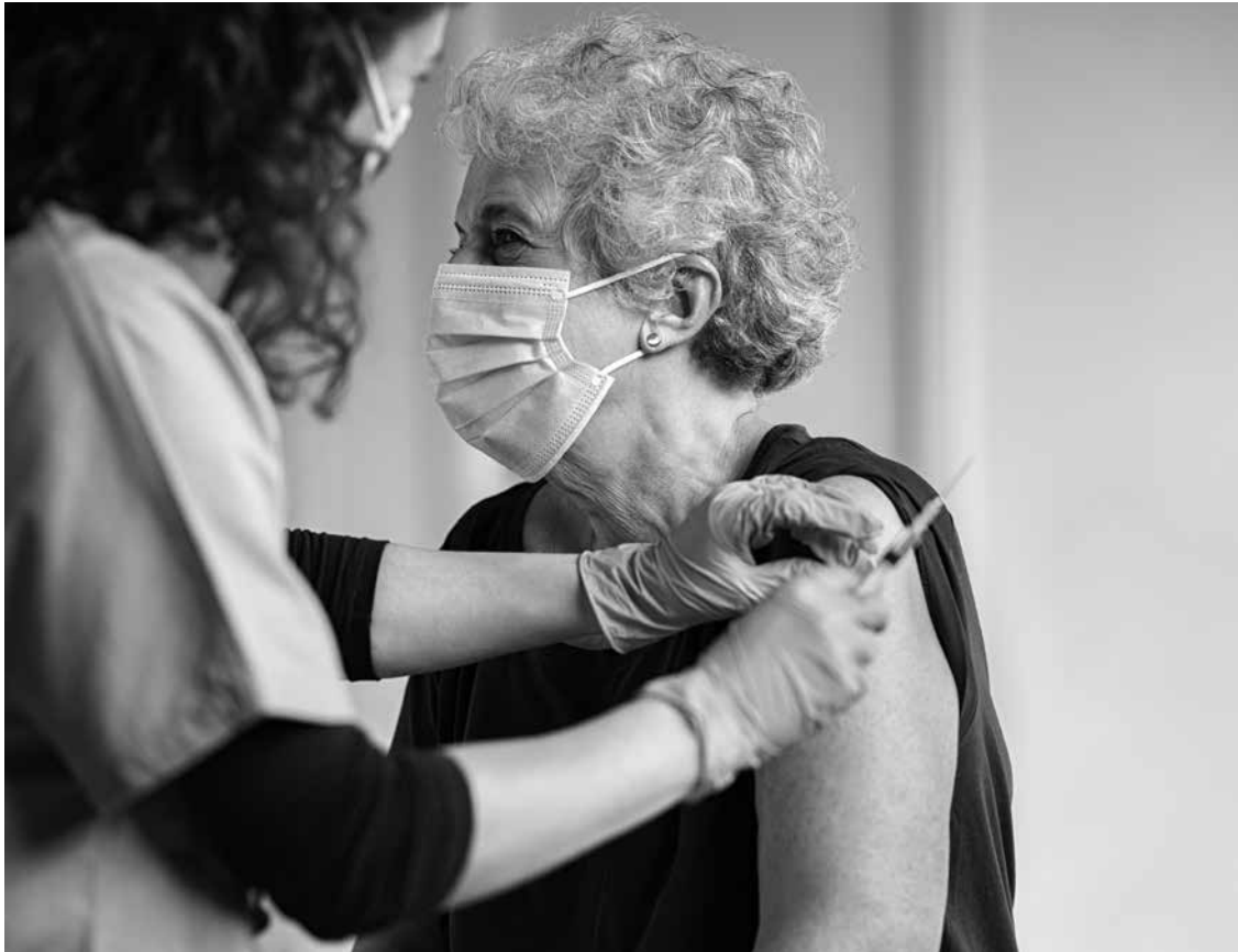
La prevención también es un gesto de cariño. Vacunamos para vivir más y mejor.

En Nuestra Casa sabemos que cuidar la salud de nuestros mayores es una tarea diaria, y una de las herramientas más efectivas es la vacunación preventiva. Con el cambio de estación, el cuerpo se vuelve más vulnerable a infecciones respiratorias, por eso reforzamos nuestro compromiso con la campaña anual de vacunación. Las vacunas fortalecen el sistema inmunológico y previenen enfermedades como la gripe, la neumonía o el COVID-19, que pueden generar complicaciones graves en esta etapa de la vida. Gracias a ellas se reducen hospitalizaciones y se mantiene una mejor calidad de vida y autonomía. Nuestro equipo médico planifica la campaña revisando el historial de cada residente para asegurar que todos reciban las dosis adecuadas. También informamos a las familias, porque la prevención es más efectiva cuando se acompaña con confianza y comunicación. Agradecemos a