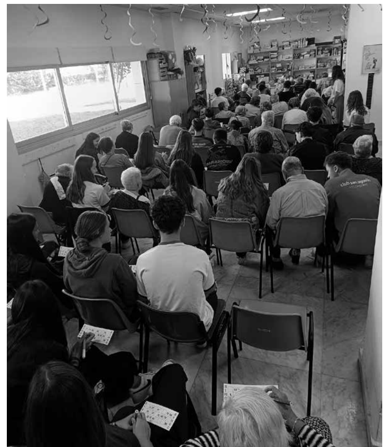
Mayores y alumnos del Colegio Los Agustinos disfrutaron juntos de un bingo intergeneracional.

Durante la mañana, mayores y pequeños participaron juntos en un taller de manualidades de otoño, elaborando hojas decorativas y pequeños detalles inspirados en los colores de la estación. El ambiente se llenó de risas, conversaciones y gestos de cariño que demostraron el valor del intercambio entre generaciones. La actividad concluyó con un divertido bingo intergeneracional, donde la emoción y la complicidad se hicieron protagonistas. Cada número cantado fue una oportunidad para seguir compartiendo historias, anécdotas y sonrisas. Desde Nuestra Casa, queremos agradecer al Colegio Los Agustinos su entusiasmo y sensibilidad. Este tipo de encuentros refuerzan los lazos entre generaciones y nos recuerdan que el verdadero aprendizaje también nace del afecto, la escucha y el tiempo compartido. Fue, sin duda, una experiencia enriquecedora para todos, que nos recordó la importancia de mantener vivos los lazos entre generaciones y celebrar la alegría de compartir tiempo, afecto y aprendizaje mutuo.