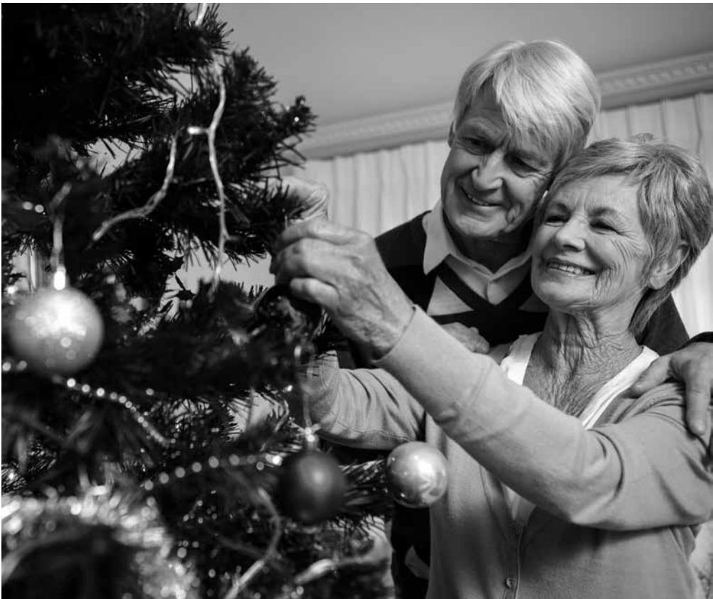
Una familia celebrando las navidades.

La Navidad, con sus luces y villancicos, es una fecha importante para reencontrarnos con los demás y con nosotros mismos. Más allá de la religión o los regalos, es un tiempo de memoria y gratitud. Ya no la esperamos con la impaciencia de la infancia, sino con la calma de valorar lo esencial: una charla, una comida o una llamada. Diciembre es también momento de hacer balance del año y reconectar con raíces y tradiciones. En nuestra residencia, pequeños detalles como una decoración o una postal nos recuerdan que el calor humano nunca se va. Navidad es cuidar y dejarse cuidar, compartir una sonrisa o un recuerdo. Brindemos por lo vivido y por quienes nos acompañan.