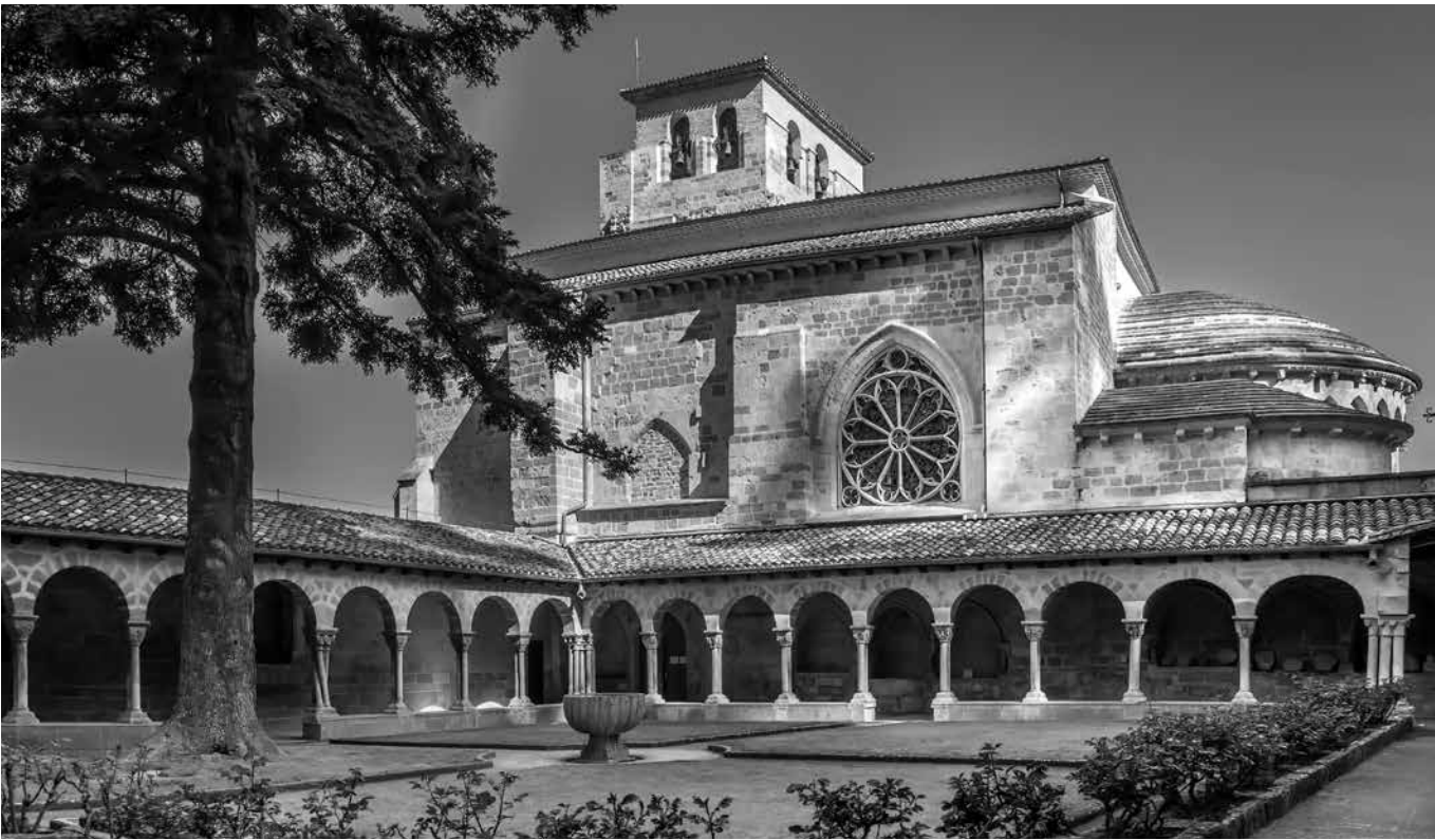
Iglesia de San Pedro de la Rúa.

Estella-Lizarra es una joya situada en el corazón de Navarra, conocida como la “Toledo del Norte” por su rico patrimonio histórico y artístico. Fundada en el siglo XI, creció gracias a su buena ubicación en el Camino de Santiago, que atrajo a peregrinos y comerciantes de toda Europa. Su casco antiguo está lleno callejuelas empedradas. Uno de los lugares más destacados es la Iglesia de San Pedro de