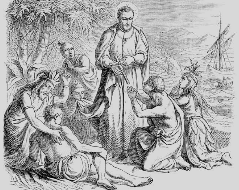
Grabado de San Francisco Javier.