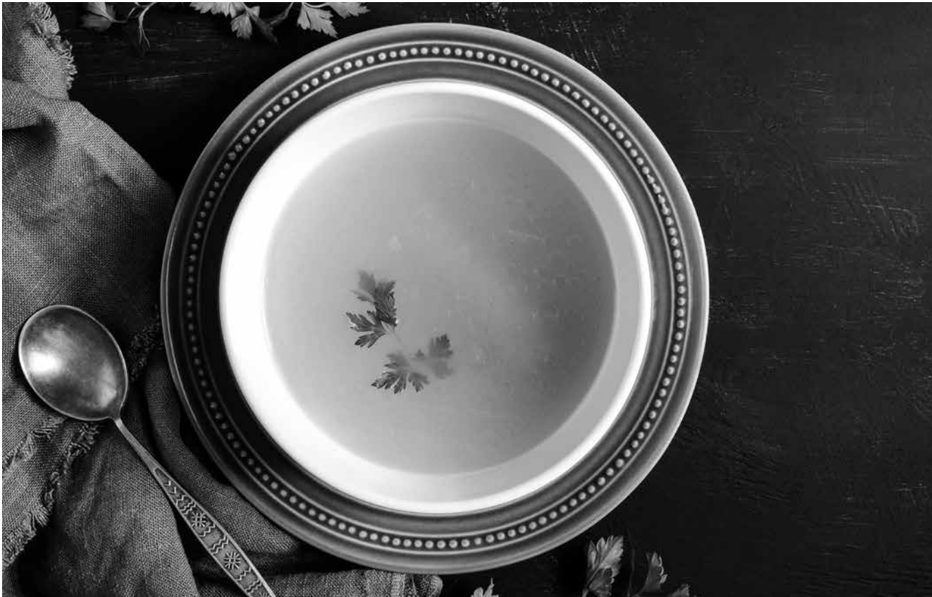
Imagen de un caldo bien calentito.

El invierno trae consigo frío y humedad, por eso en este número del periódico compartimos consejos para estar más cómodos y saludables en la residencia. Para combatir el frío, las bolsitas de arroz calentadas dan un calor suave y reconfortante. Además, ventilar bien las habitaciones al menos 10 minutos al día ayuda a renovar el aire y prevenir contagios. Hay que evitar cambios bruscos de temperatura, abrigarse por capas y mantener los pies calientes, que también es clave para esquivar los resfriados. Y no olvidemos el poder de un buen caldo casero, que nos reconforta y nutre. Con estos pequeños trucos, el invierno será más agradable y saludable. Para evitar el aire seco por la calefacción, se puede colocar agua cerca de los radiadores y se ayuda así a man-