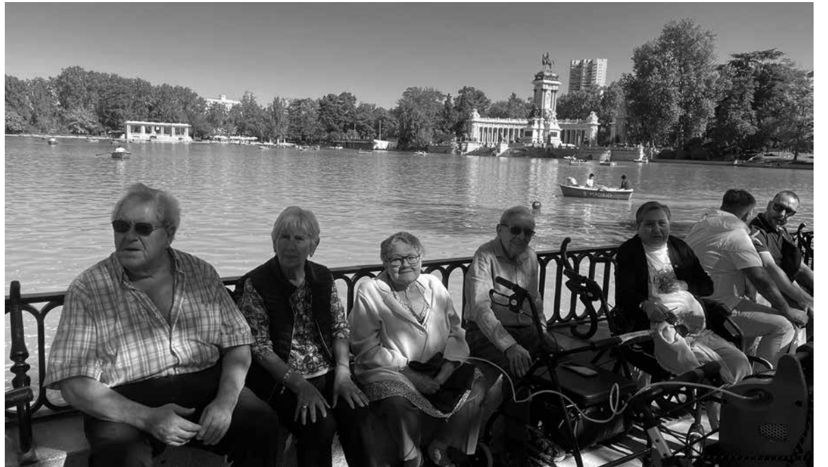
Disfrutando del Parque del Retiro en buena compañía.

En la residencia seguimos apostando por el bienestar y la participación activa de nuestros mayores, y una de las actividades más esperadas son las salidas culturales. Cada semana, un grupo de residentes, acompañado por el equipo de animación sociocultural, se lanza a descubrir los rincones más emblemáticos y curiosos de nuestra ciudad. Durante las últimas semanas hemos paseado por el Parque del Retiro, disfrutando del aire libre, los barquitos del estanque y un merecido descanso en sus terrazas. También hemos visitado diversas exposiciones y centros culturales, donde el arte, la historia y la música se convierten en protagonistas de una jornada llena de aprendizaje y buen humor. Lo más enriquecedor de esta iniciativa es que las propuestas de destino surgen directamente de los propios residentes. Cada uno aporta ideas y sugerencias que la animadora sociocultural recoge y