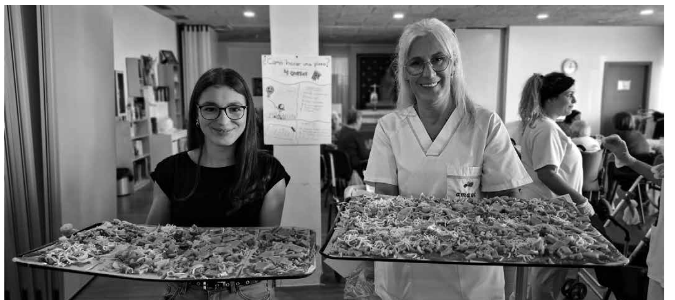
Las pizzas en casa saben mejor.

Nuestra residencia cumplió 17 años y lo celebramos por todo lo alto con una semana repleta de actividades y emociones. Disfrutamos de un divertido taller intergeneracional de pizza, en el que residentes y pequeños compartieron risas y recetas. También recreamos un famoso juego de televisión que despertó la competitividad y el buen humor de todos. La semana continuó con la actuación en directo de un cantante que hizo bailar y cantar al público, y finalizó con un bingo especial lleno de premios y sorpresas. ¡Un aniversario inolvidable!