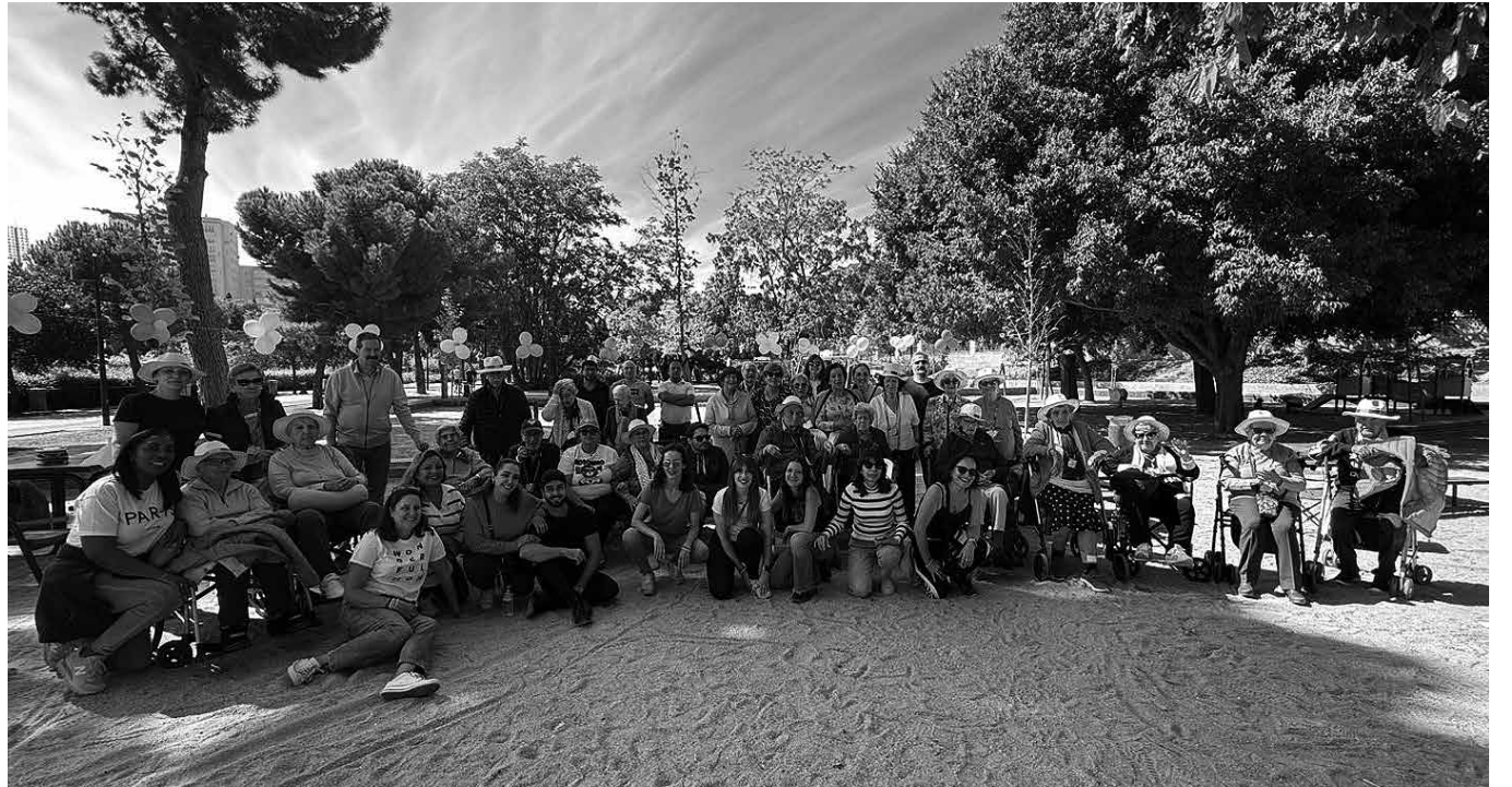
Picnic en el parque de Canal.

El pasado 25 de octubre vivimos una jornada muy especial en Amavir. Residentes, usuarios de centro de día, familiares y trabajadores del centro nos reunimos en el parque de Canal para disfrutar de una convivencia en plena naturaleza. El parque, con su entorno verde y sus amplios merenderos, se convirtió en el escenario perfecto para disfrutar de múltiples actividades al aire libre. Nuestros mayores, acompañados de sus seres queridos y del equipo de profesionales, participaron con entusiasmo en juegos como los bolos o el popular paracaídas, que despertaron sonrisas y recuerdos entrañables. Tras la mañana de juegos, llegó uno de los momentos más esperados: la comida.