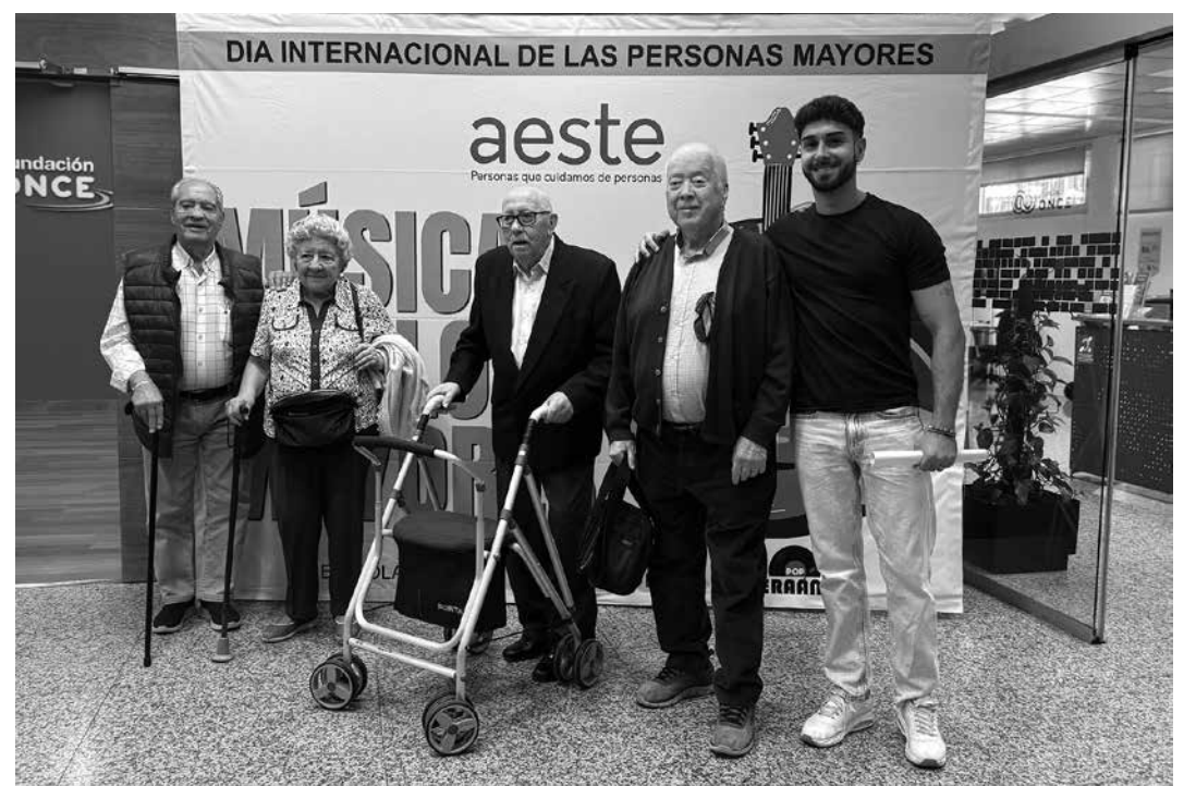
Concierto que pudimos disfrutar mucho.

El 1 de octubre, con motivo del Día Internacional de las Personas de Edad, disfrutamos de un concierto organizado por AESTE y ofrecido por el Coro Alderaán en la sede de la Fundación ONCE. Los 27 coralistas interpretaron temas como Take On Me, de A-ha o El universo sobre mí, de Amaral, en un espectáculo lleno de alegría y participación. El evento recordó que las personas mayores siguen siendo protagonistas activos en la sociedad y que la cultura, la convivencia y el reconocimiento son esenciales en todas las etapas de la vida.