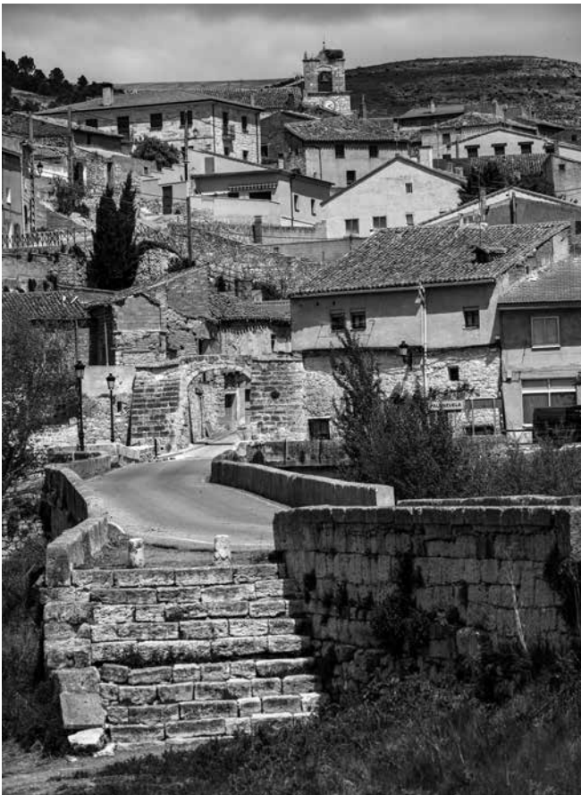
Imagen de Plasenzuela.