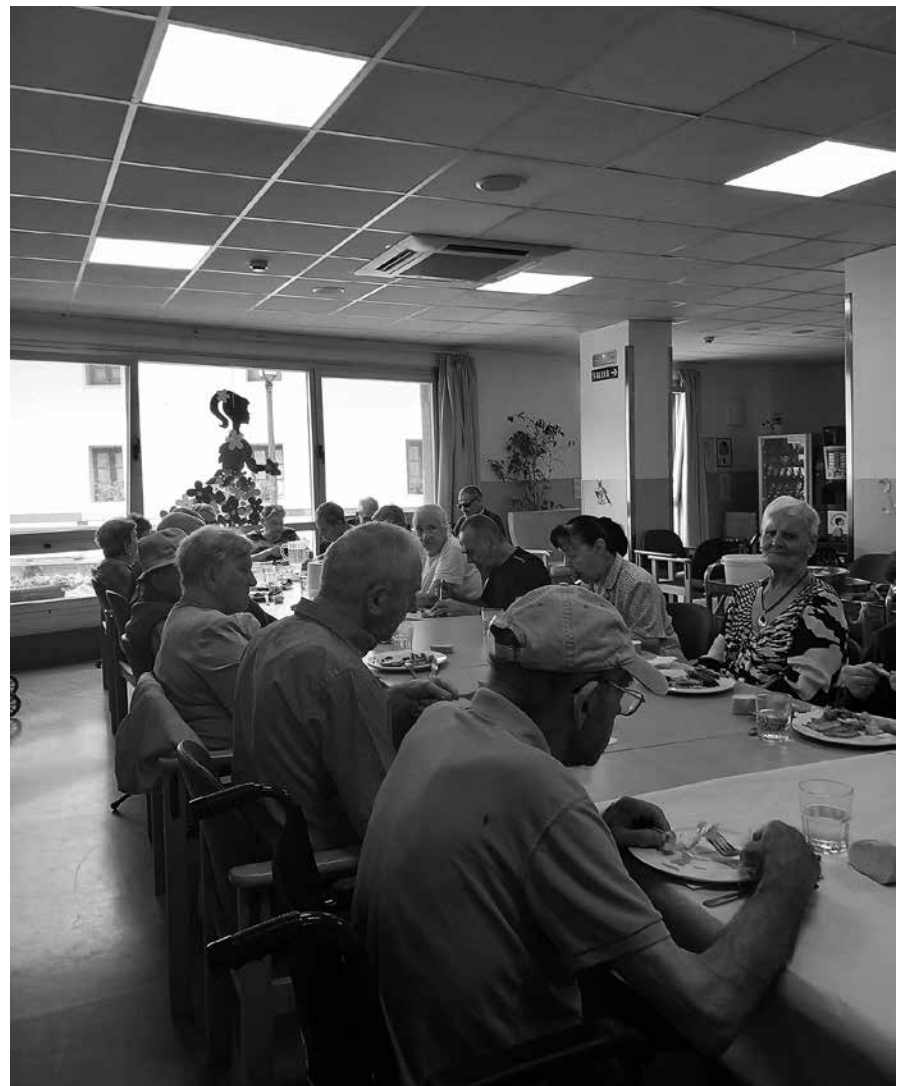
Residentes disfrutando de la comida popular.

Aprovechando la celebración de uno de los días más especiales de la zona, el día de San Miguel de Aralar, Amavir Betelu decidió realizar en la planta baja en la sala común una comida popular con todos los residentes de las distintas unidades de convivencia y trabajadores del centro para fomentar las relaciones personales de todos los residentes. La comida conjunta de los residentes de las tres plantas ha supuesto una experiencia muy enriquecedora. Reunirse en un mismo espacio favorece la convivencia y permite que las personas mayores con distintos perfiles compartan momentos de cercanía. La diversidad de edades, capacidades y formas de vida se convierte en una oportunidad para aprender unos de otros. Estos recuerdos compartidos fortalecen la cohesión entre las personas. Además, este tipo de actividades ayuda a romper las barreras y que se formen vínculos nuevos, más allá del grupo habitual de cada planta. También ayudamos a fomentar el sentimiento de pertenencia al centro, al sentirse parte de una misma comunidad. La actividad estimula la comunicación, la empatía y la comprensión entre iguales, y fomenta la tolerancia y el respeto mutuo. Por último, y más importante, conseguimos entre todos romper con la rutina, pasar un rato juntos y disfrutar del tiempo.