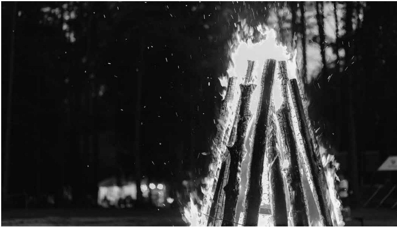
Gran hoguera en el Akelarre en Intza, Navarra.

En el valle de Araitz, bajo la sombra de las Maioas, se dice que en las noches sin luna las sorginak, las brujas del lugar, se reunían en una campa de Urrizolako Malda. Allí bailaban alrededor del fuego, entonando cánticos que hacían temblar el aire y despertar a los animales del bosque. Los aldeanos, desde sus casas, veían brillar luces entre los árboles y escuchaban risas que se confundían con el