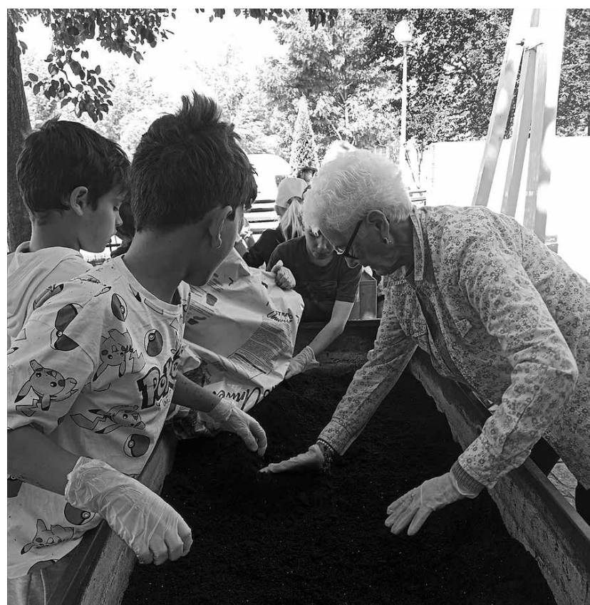
Niños y residentes cuidan del huerto terapéutico.

Para recibir el buen tiempo, en Amavir San Agustín del Guadalix recuperamos nuestro huerto terapéutico. Este proyecto nace desde la iniciativa de los residentes y de la colaboración de niños y niñas del municipio. Juntos prepararon el terreno, eligieron y sembraron plantas ornamentales y aromáticas y se lo pasaron en grande. Con esta actividad, ofrecemos a los usuarios del centro una herramienta valiosa que les permite mantener el contacto con la naturaleza y salir de la rutina, aportando múltiples beneficios, como la estimulación sensorial y cognitiva, se favorece la movilidad, se fomentan las relaciones sociales y el intercambio intergeneracional.