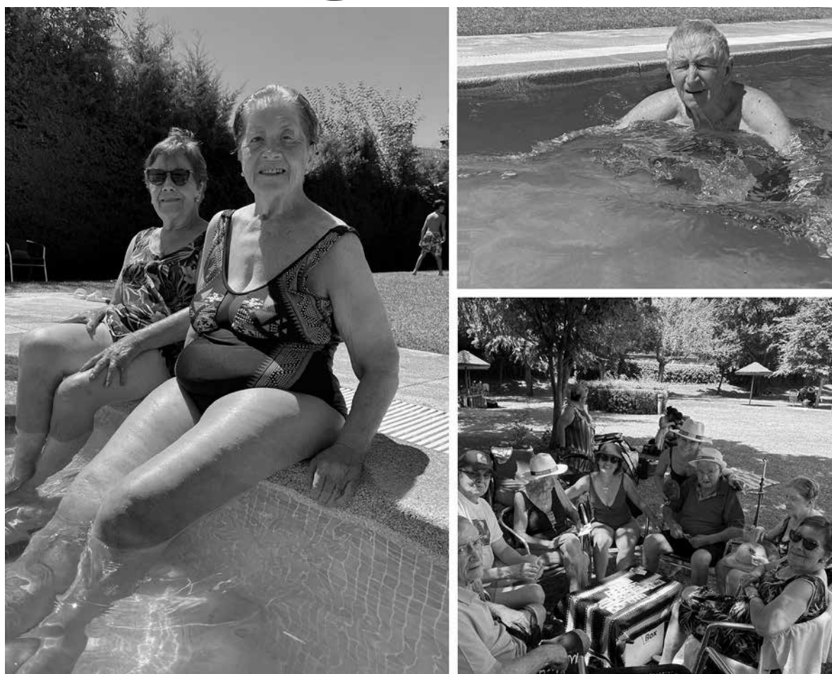
Los residentes disfrutaban en la piscina municipal de San Agustín.

Como cada verano, realizamos la tradicional salida a la piscina municipal en el mes de julio. Comenzamos la jornada preparados con todo lo necesario; bañador, toalla y bien de crema sola. Por la mañana nos metimos al agua. Unos aprovecharon para nadar y otros pasamos un ratito a la orilla de las escaleras, con los pies a remojo, charlando y riéndonos con los chavales de los diferentes campamentos que pasaban por allí. Esta salida nos ayudó a romper la rutina y realizar actividades que no solemos hacer durante el año. Esta excursión fue muy motivadora para mantener las capacidades cognitivas y funcionales de los residentes. Además, propició la interacción entre los usuarios con personas de otras generaciones. Durante estas jornadas de piscina, pudimos disfrutar de deliciosa ensaladilla rusa, patatas, fruta y zumos fresquitos, gracias a la colaboración de cocina. Después de comer algunos volvieron al agua para mitigar el calor sofocan-