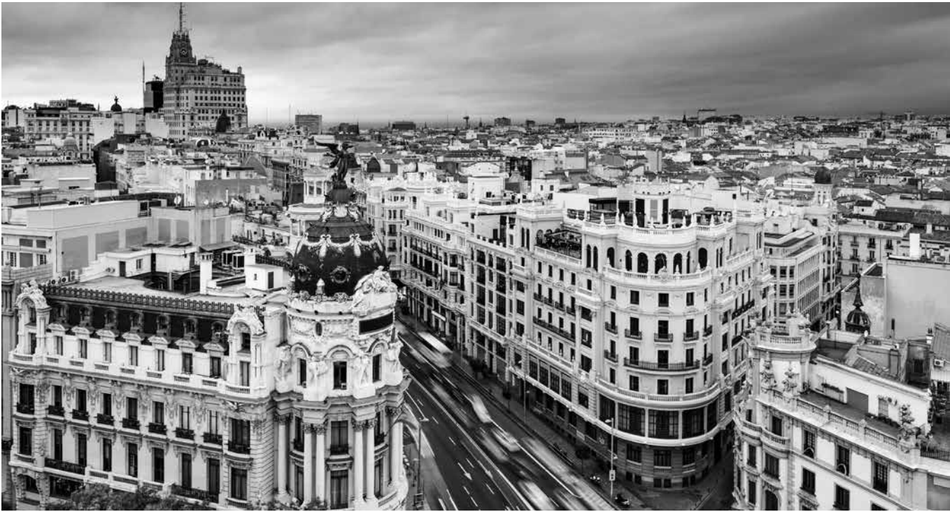
Imagen del centro de Madrid.

Anselma nació en Madrid y vivió casi 60 años en el barrio del Pilar. En esos años fue testigo de cómo aquel rincón de la ciudad creía y se transformaba, de cómo las nuevas calles ocuparon los campos de las afueras dando paso a nuevos edificios y a jóvenes familias llenas de ilusión. A través de la mirada de Anselma, descubrimos buenas gentes, vecinos que se ayudan y amigas entrañables con las que