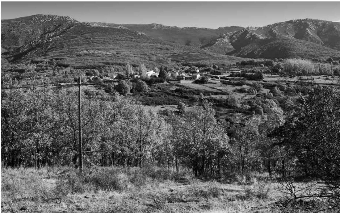
Un paisaje natural en otoño.

Durante el otoño, los cambios de temperatura y el aumento de la humedad pueden afectar nuestra salud. No es inusual que, cuando comienza el frío, las personas empiecen a padecer diferentes catarros o enfermedades típicas de estas fechas. De esta forma, con el objetivo de mantenerse bien durante esta estación, es importante seguir algunos consejos médicos. En primer lugar, hay que abrigarse adecuadamente, en especial en las mañanas y noches frías, para evitar resfriados y gripes. Asimismo, también es recomendable mantener una buena higiene, lavándose las manos con frecuencia, ya que los virus respiratorios son comunes en esta época y es conveniente no acercar nuestras manos sucias a la cara. Además, fortalecer el sistema inmunológico con una alimentación rica en frutas y verduras de temporada, como manzanas, calabazas y cítricos, ayuda a prevenir enfermedades.