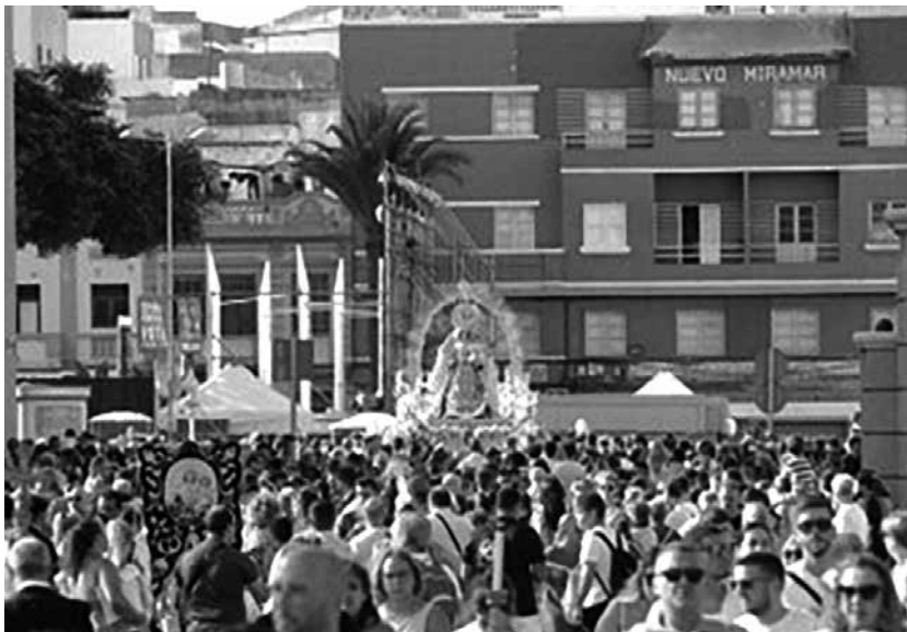
Procesión de la Virgen del Carmen.