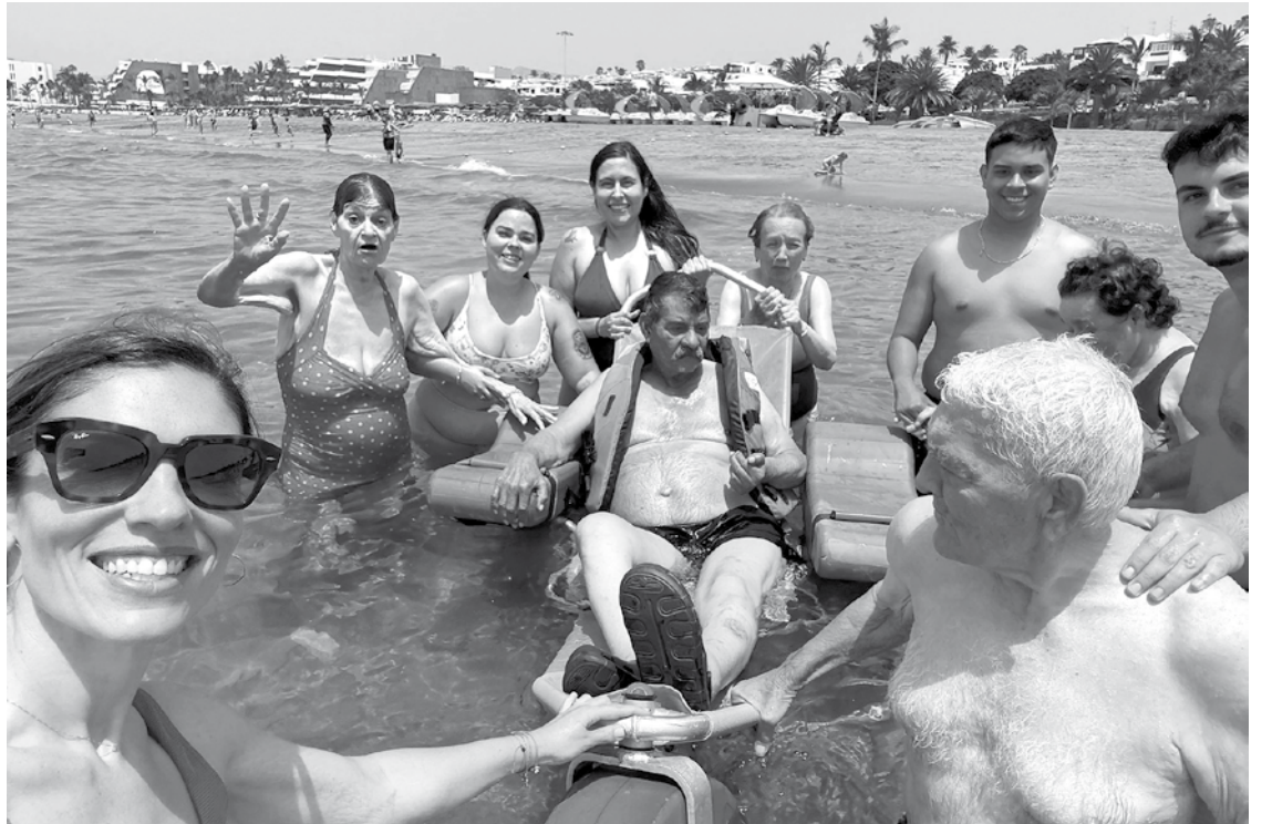
Los residentes disfrutaban del día en la playa.

En Amavir Haría dimos por inaugurada la temporada veraniega con nuestra ya tradicional visita a la playa. El 14 de julio desempolvamos las toallas y los bañadores y pusimos rumbo a la playa de Puerto del Carmen, situada en el municipio de Tías. Una vez llegados a la playa, no podía faltar, en primer lugar, la protección solar, además de aprovechar para tomar un refrigerio antes de acercarnos a la zona de la orilla, donde ya teníamos preparadas sus sillas. Aprovechando el buen tiempo, algunos no dudaron en remojarse los pies paseando por la orilla, e incluso dándose más de un chapuzón. Contamos también con las sillas anfibas, gracias a las cuales los residentes con movilidad reducida pudieron disfrutar de un refrescante baño. La mañana se nos pasó volando entre paseos y baños, ya que algunos querían aprovechar el momento, puesto que llevaban años sin poder disfrutar de la playa. Al mediodía, dejamos