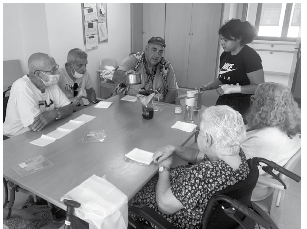
Un grupo de residentes y usuarios en el taller de cochinilla.

Dentro de las actividades programadas con la Fundación Juan Brito, hemos podido contar con una que forma parte de la tradición de nuestra isla: la cochinilla. El cultivo de la cochinilla, insecto que se recoge de las tuneras, fue durante muchos años uno de los principales productos de exportación en Lanzarote y muy utilizado como tinte natural. En estos talleres, impartidos por la Asociación Milana, nuestros mayores han podido conocer el proceso mediante el cual se obtiene el tinte a partir de la cochinilla, además de ponerlo en práctica, ya que han podido teñir su propio pañuelo. Es una actividad que les ha resultado muy gratificante, ya que forma parte de la tradición y el patrimonio de la isla.