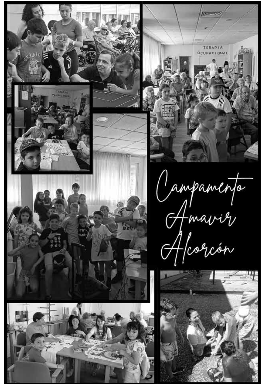
Los más pequeños pasan grandes ratos con los residentes.

Por cuarto año consecutivo, en Amavir Alcorcón se ha realizado el campamento intergeneracional al que asistieron 18 niños y niñas. Los residentes pudieron disfrutar durante una semana de la compañía, juventud y alegría que irradian los más pequeños. La organización del campamento estuvo a cargo de los departamentos de terapia ocupacional y trabajo social, con el apoyo de fisioterapia, psicología y animación. Durante esos días se desarrollaron diversas actividades como manualidades cooperativas, juegos de mesa, juegos tradicionales y una búsqueda del tesoro, culminando la semana con una gran fiesta del agua donde mayores, menores, trabajadores y voluntarios de la central de Amavir disfrutaron y se mojaron por igual. Como muestran las fotografías, fue una semana llena de momentos felices en la que las preocupaciones y malestares de nuestros residentes quedaron en segundo plano. Tanto niños como mayores vivieron esos días con gran entusiasmo y se despidieron con la promesa de volver a encontrarse el próximo año.