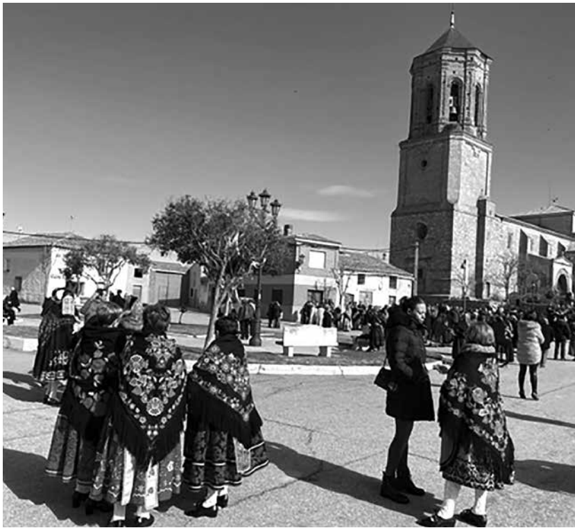
Mujeres vestidas con trajes tradicionales en Villarrín de Campos.