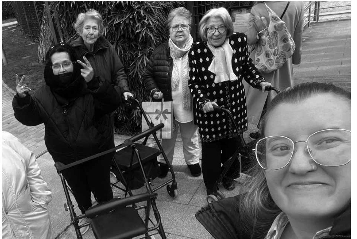
Un grupo de residentes durante la excursión.

Aprovechando uno de los pocos días sin lluvia de los últimos meses, varios residentes y usuarios de centro de día de Amavir Villanueva visitaron la exposición de Lorenzo Caprile, situada en el Canal de Isabel II. Esta exposición rinde homenaje al trabajo del reconocido diseñador y al de otros artistas que también elaboraban espléndidos trajes. Los asistentes quedaron encantados al ver los trajes en persona, apreciando de cerca el tipo de costura y los materiales utilizados. Al finalizar la visita, los residentes pasaron un rato agradable en un parque cercano, socializando con los vecinos del barrio y con varias personas que paseaban a sus mascotas. Además, dado que el tiempo acompañaba, aprovecharon para ir a una cafetería del barrio y tomar un pequeño tentempié antes de regresar a la residencia. La excursión resultó especialmente emocionante para aquellos