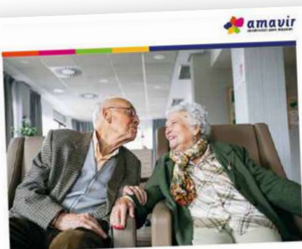
Estado de información no financiera consolidado 2024

El Consejo de Administración de Amavir ha aprobado el Informe sobre el Estado de Información no Financiera de la compañía correspondiente al ejercicio 2024, que resume los principales indicadores de actividad durante el pasado año en todos los ámbitos (económico, recursos humanos, calidad, medioambiente, comunicación, seguridad de la información, proveedores...). Es la séptima edición de este informe, que comenzó a publicarse en 2018. Ha sido auditado por Deloitte y está a disposición de todos los públicos de la compañía a través de nuestra página web.