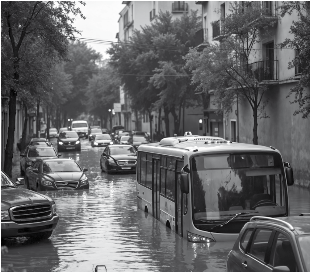
Vehículos circulan por una calle inundada.

En nuestra sección “Cosas de Casa”, queremos compartir información útil y práctica sobre cómo prepararse ante una posible inundación. Este tema es especialmente relevante para nuestro centro residencial, donde la seguridad y el bienestar de todos son nuestra prioridad. A continuación, os ofrecemos una guía detallada sobre las medidas que debemos tomar antes, durante y después de una inundación. Antes de una inundación, es fundamental informarse sobre el nivel de riesgo de inundación en nuestra área: mantente al tanto de las previsiones meteorológicas y sigue las recomendaciones de las autoridades en todo momento, cerrar y asegurar ventanas y puertas son medidas básicas de protección que pueden ayudar a impedir la entrada del agua en caso de inundación. Además, es importante preparar un kit de emergencia que incluya un botiquín de primeros auxilios, linternas o velas, una cocina tipo camping gas, agua potable y una radio a pilas. Protege tus documentos y objetos de valor colocándolos en la parte alta de la casa y, si es posible, en bolsas herméticas. Durante la inundación, mantén la calma y sigue las instrucciones de las autoridades. Utiliza los recursos de tu kit de emergencia según sea necesario y evita zonas inundadas, ya