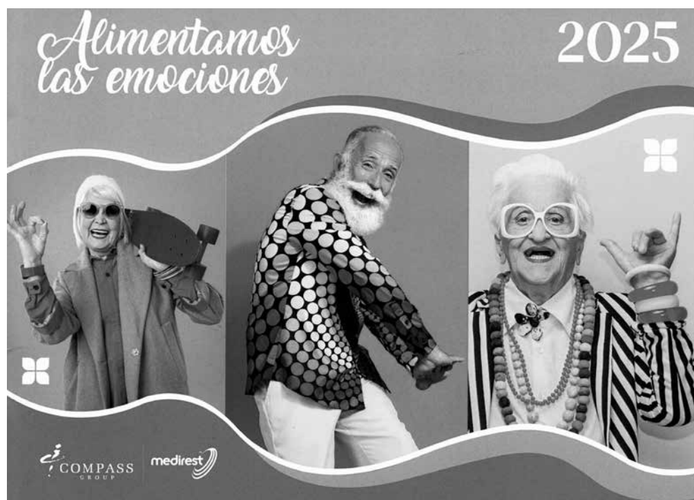
Cartell del programa “Alimentem les emocions” 2025.

En la nostra secció “Coses de casa” ens agrada compartir amb vosaltres les activitats i projectes que fan del nostre centre un lloc especial. Ens complau anunciar que el projecte “Alimentem les emocions” celebra el seu cinquè aniversari, consolidant-se com una font inesgotable d'alegria i benestar en els nostres centres. Aquest projecte, nascut des del cor, s'ha convertit en un pilar essencial per enriquir la vida dels nostres avis i àvies, oferint cada mes una oportunitat única per regalar somriures, despertar sentits i crear moments que emocionen i deixen petjada. Aquest any, volem portar-vos encara més lluny en aquest meravellós viatge. La gastronomia serà l'ànima de les trobades inoblidables, i les activitats temàtiques obriran les portes a gaudir i connectar. Junts, farem que la màgia succeeixi: trencarem la rutina, despertarem somnis i omplirem de felicitat cada raconet d'aquesta casa. Prepareu-vos per un any ple d'il·lusió, emocions compartides i records que difícilment esborraran de la nostra memòria. Les activi-