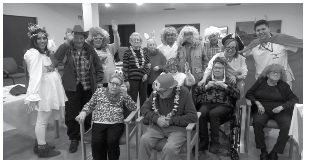
Residents i personal d'Amavir Vilanova gaudint de la rua de Carnaval.

El Carnaval és un dia diferent, divertit, on quasi tot s'hi val, i a Amavir Vilanova ho celebrem per tot el alt. La jornada va estar marcada per la creativitat i l'alegria, amb disfresses que van omplir de color i fantasia cada racó del centre. Tothom qui va voler es va disfressar, sense una temàtica concreta, donant via lliure a la imaginació. Vam veure bruixes, fades del bosc, dimonis, indis, espantaocells, algun pallaso, l'abella Maia i molts altres personatges, cadascun amb els seus complements. L'objectiu comú era fer que els avis passessin una vetllada inoblidable. Al llarg del dia, es va organitzar una rua que, amb música