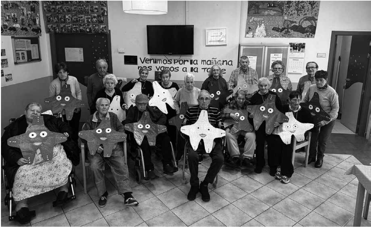
Residentes disfrutando del Carnaval.

Un año más, Amavir Usera se llenó de alegría y color durante la celebración de Carnaval, que este año tuvo como temática el fascinante mundo del mar. Residentes, usuarios de centro de día y personal se unieron para disfrutar de una mañana llena de diversión, música y creatividad. En los días previos, los residentes participaron en un taller de decoración en el que crearon un precioso mural que transformó el espacio de la fiesta en un auténtico océano, con peces de colores, corales y estrellas de mar. La mañana comenzó con un desfile en el que cada participante lució su disfraz. La música animada hizo que todos se levantaran de sus asientos para disfrutar de un rato de baile y risas y, entre baile y baile, los asistentes pudieron disfrutar de un picoteo y refrescos para recargar energías y seguir con la fiesta. El evento no solo fue una oportunidad para celebrar, sino también para fomentar la interacción entre residentes y sus familias, creando recuerdos inolvidables. Además, ese día también felicitamos a todos los cumpleañoseros