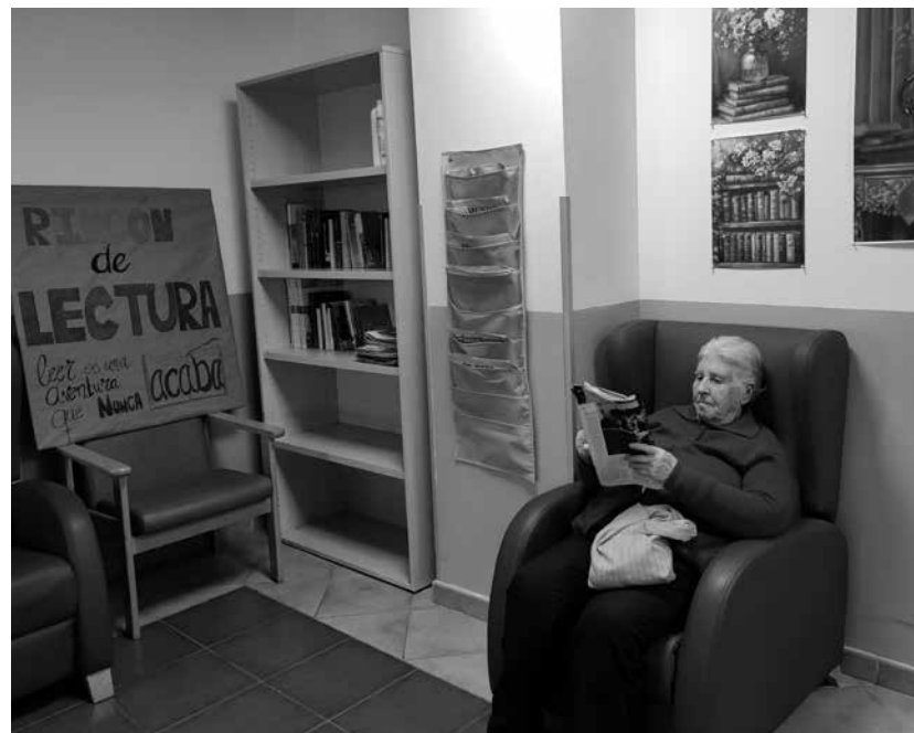
Una residente disfruta del rincón de lectura.

En esta edición de “Cosas de casa”, queremos compartir una emocionante novedad que estamos implementando en la sala de convivencia de la 2.ª planta. Con el objetivo de ofrecer a los residentes actividades significativas durante su tiempo libre, hemos decidido crear varios rincones dedicados a sus aficiones favoritas. De esta manera, tras realizar un estudio para conocer las aficiones con mayor demanda, hemos identificado tres ideas que han tenido una excelente acogida: el rincón de lectura, el rincón de costura y el rincón de juegos de mesa. Cada una de estas actividades se desarrollará con materiales facilitados por el centro y podrán llevarse a cabo de forma individual o grupal, siempre con el acompañamiento del personal de atención directa en planta. El objetivo principal es fomentar encuentros entre personas que comparten la misma afición, minimizando los efectos de la institucionalización y manteniendo la conexión con actividades que los residentes desarrollaban anteriormente. Estas iniciativas favorecen el envejecimiento activo, ya que ejercitan las capacidades físicas, cognitivas, emocionales y sociales de nuestros residentes. La costura, por ejemplo, no solo alivia la ansiedad y el estrés, sino que también trabaja