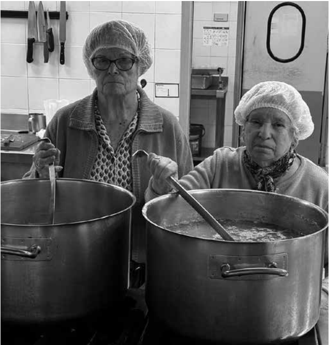
Nuestras cocineras en los fogones.

Cocemos los huevos por separado. Mientras tanto, añadimos los demás ingredientes a la olla y los dejamos cocer durante 20 minutos. Comprobamos la cocción, emplatamos y añadimos el huevo cocido. ¡Listo para chuparse los dedos!