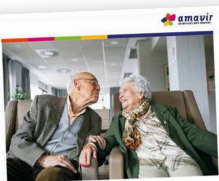
Estado de información no financiera consolidado 2024

El Consejo de Administración de Amavir ha aprobado el Informe sobre el Estado de Información no Financiera de la compañía correspondiente al ejercicio 2024, que resume los principales indicadores de actividad durante el pasado año en todos los ámbitos (económico, recursos humanos, calidad, medioambiente, comunicación, seguridad de la información, proveedores...). Es la séptima edición de este informe, que comenzó a publicarse en 2018. Ha sido auditado por Deloitte y está a disposición de todos los públicos de la compañía a través de nuestra página web.