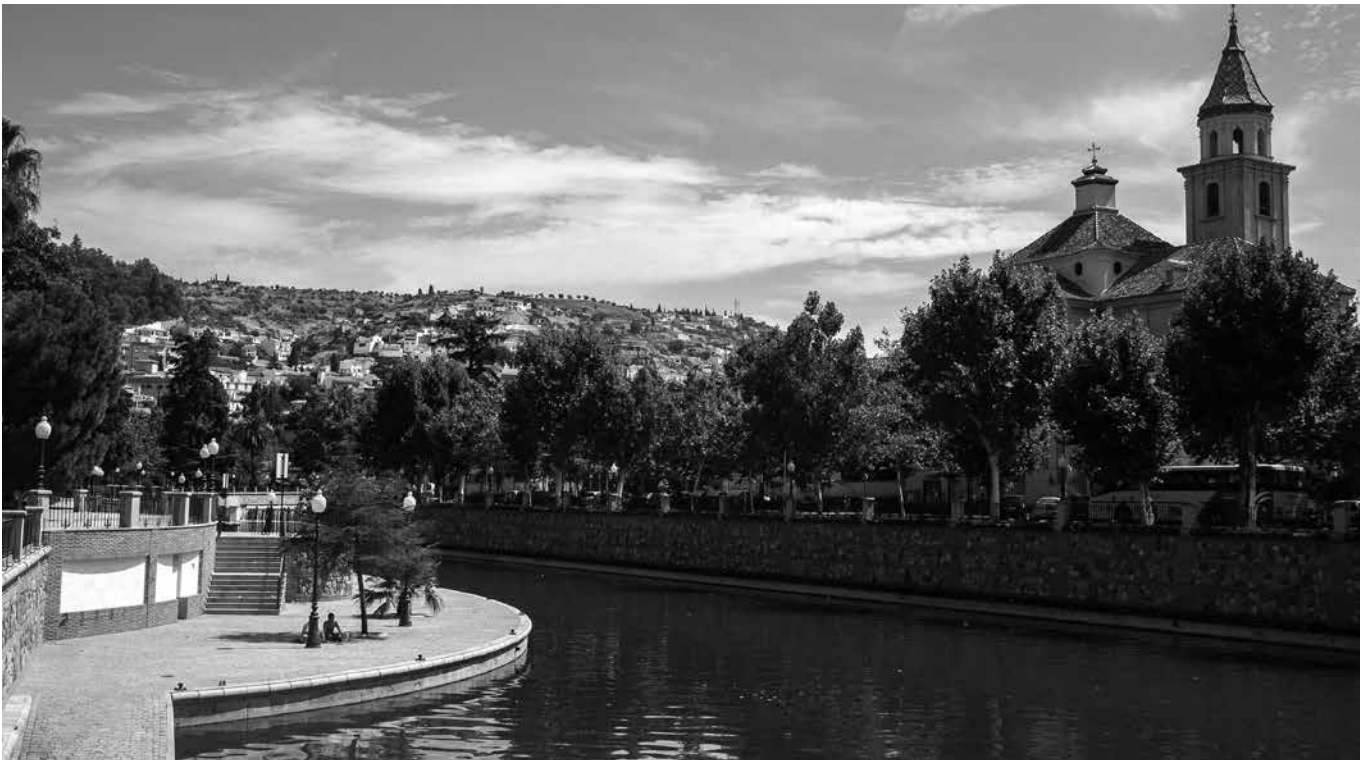
Vista de la ciudad de Granada desde el río Genil.