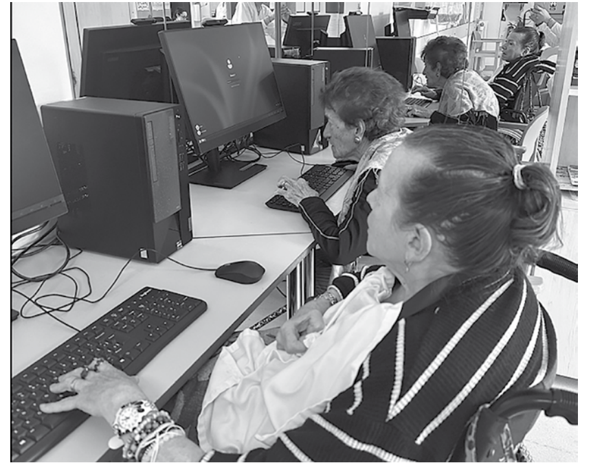
Residentes aprenden el uso de las nuevas tecnologías.

En nuestra residencia, siempre buscamos formas de mejorar la calidad de vida de los residentes y adaptarnos a los tiempos modernos. Con el avance de la tecnología y su creciente importancia en la vida diaria, hemos identificado la necesidad de acercar a nuestros mayores al mundo digital. Por ello, hemos lanzado el curso “Retomadrid”, una iniciativa especial diseñada para ofrecer a los residentes herramientas tecnológicas que mejoran su calidad de vida. Este programa de informática ha acercado a las personas mayores al mundo digital, proporcionando conocimientos para navegar por Internet, utilizar aplicaciones básicas y comunicarse de forma más sencilla con familiares y amigos a través de las nuevas tecnologías. A lo largo de varias semanas, los participantes han aprendido a manejar dispositivos como tabletas y ordenadores, han desarrollado habilidades en el uso de redes sociales y correo electrónico, y se han familiarizado con las herramientas más usadas en la vida diaria digital. El curso ha sido impartido por un equipo de profesionales altamente cualificados que han adaptado las clases al ritmo y las necesidades de los residentes. El objetivo de “Retomadrid” no solo ha sido enseñar