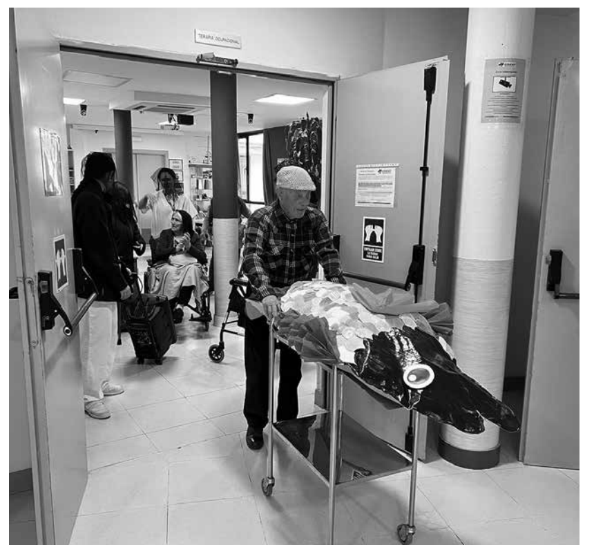
Nuestro residente transportando la sardina.

El pasado 5 de marzo, residentes de Amavir Patones disfrutaron de una jornada llena de tradición y diversión al celebrar el Entierro de la Sardina. Esta festividad, que marca el fin de la Cuaresma, se convirtió en una ocasión ideal para disfrutar de una jornada en la que el buen ambiente fue el protagonista. La celebración comenzó con la creación de una sardina decorativa, en la que los residentes participaron aportando gran creatividad. Cada uno contribuyó en la decoración y los detalles del evento, demostrando su entusiasmo y habilidades artísticas. El punto culminante de la jornada fue el simbólico Entierro de la Sardina, un momento lleno de complicidad. La jornada fue un éxito rotundo, dejando un grato recuerdo y la promesa de repetir la celebración en años venideros.