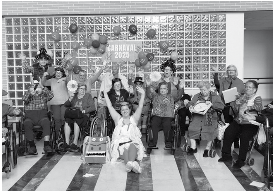
Residentes disfrutando de la fiesta de Carnaval del centro.

El mes de febrero ha estado repleto de actividades en nuestro centro, consiguiendo llenar nuestros días de emociones, alegría y diversión. La celebración más emotiva fue la de San Valentín, donde todos los residentes recibieron cartas de amistad o amor, emocionando a más de uno. Además, disfrutamos de una amplia variedad de actividades, incluyendo salidas al mercado, talleres de manualidades donde se realizaron disfraces tanto para San Valentín como para Carnaval, actuaciones y bingos. Para cerrar el mes de febrero, celebramos una gran fiesta de Carnaval en el hall de la residencia en la que nos disfrazamos, bailamos y cantamos, disfrutando de un día lleno de diversión y risas. A medida que avanzaba la fiesta, los comentarios y risas se multiplicaban, y no faltaron los elogios y las bromas amistosas. “Cada cual va mejor disfrazado”, decían muchos, admirando el esfuerzo y la creatividad de sus compañeros.