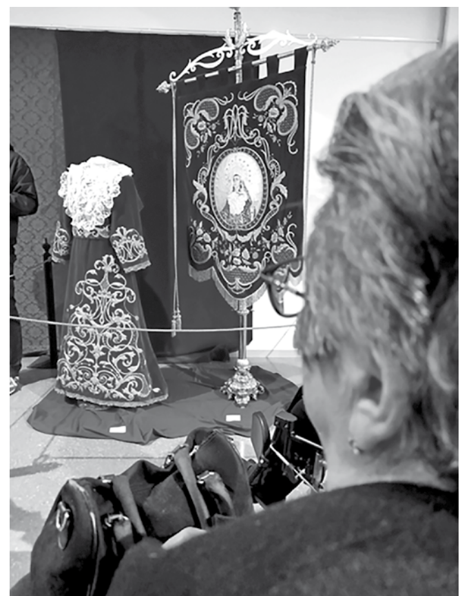
Una residente durante la visita al Museo de Hellín.

manera, desde enero se han organizado varias salidas, entre ellas una visita al Museo de Hellín, en la que los residentes disfrutaron de una gran exposición sobre La Dolorosa. Además, se han retomado las visitas al mercado del pueblo, que no solo fomentan el ocio de calidad y la vida saludable, sino que también tienen una parte terapéutica.