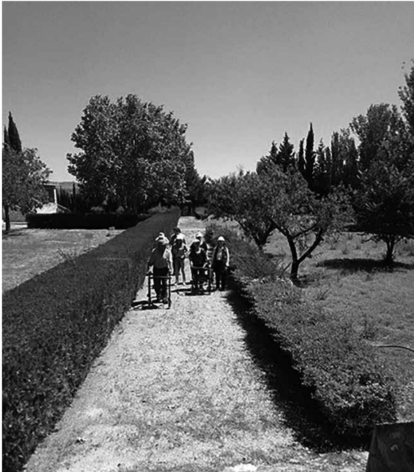
Residentes disfrutan de una excursión al aire libre.