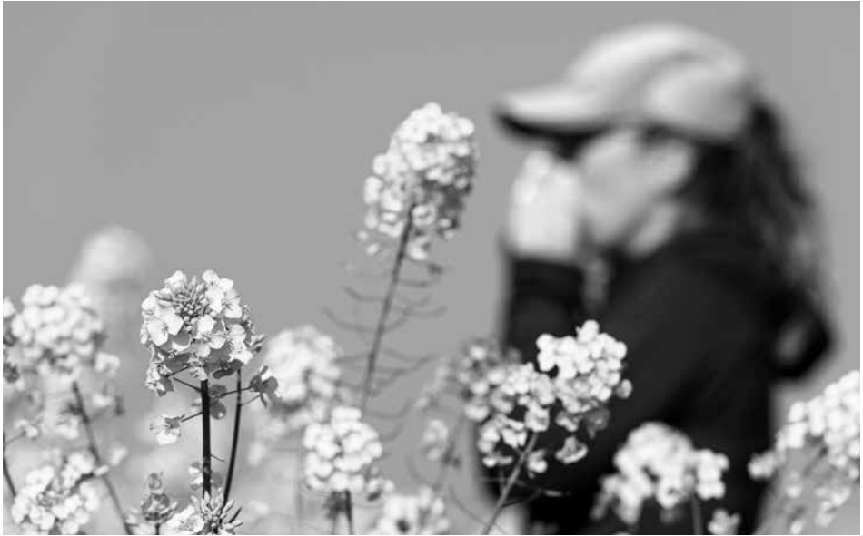
Es fundamental protegerse del sol en las actividades al aire libre.