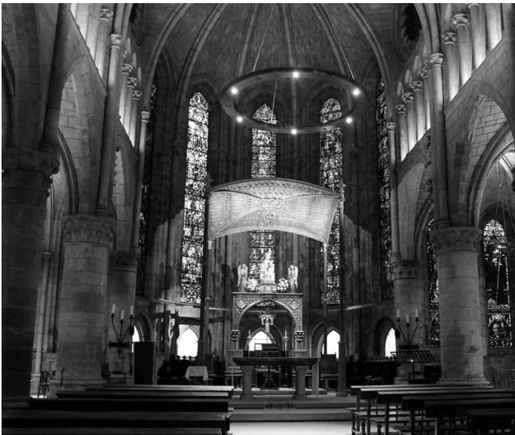
Interior de Santa María la Real, en Roncesvalles.

Santa María la Real de Roncesvalles, conocida como la “Reina del Pirineo”, es un lugar de gran veneración para los habitantes de numerosas localidades. Cada primavera, estos pueblos participan en romerías hacia Roncesvalles para rendirle homenaje. Además de ser una importante parada en el Camino de Santiago, Roncesvalles se ha convertido en un destacado centro religioso en Navarra. Durante los meses de mayo y junio, peregrinos de diversos valles y localidades de la región, como Aezkoa, Arce, Erro, Valcarlos, Espinal, Burguete, Aoiz y San José de la Chantrea en Pamplona, se reúnen en un colorido y solemne desfile. Entre estas romerías, destacan especialmente la del valle de Arce, que se celebra desde el siglo XVI, y la del valle de Aezkoa, conocida por ser la más vistosa. Los participantes, vestidos con trajes tradicionales y túnicas oscuras, marchan en silencio hasta el altar de la Virgen en la Real Colegiata de Santa María. Este desfile crea una atmósfera bucólica y cargada