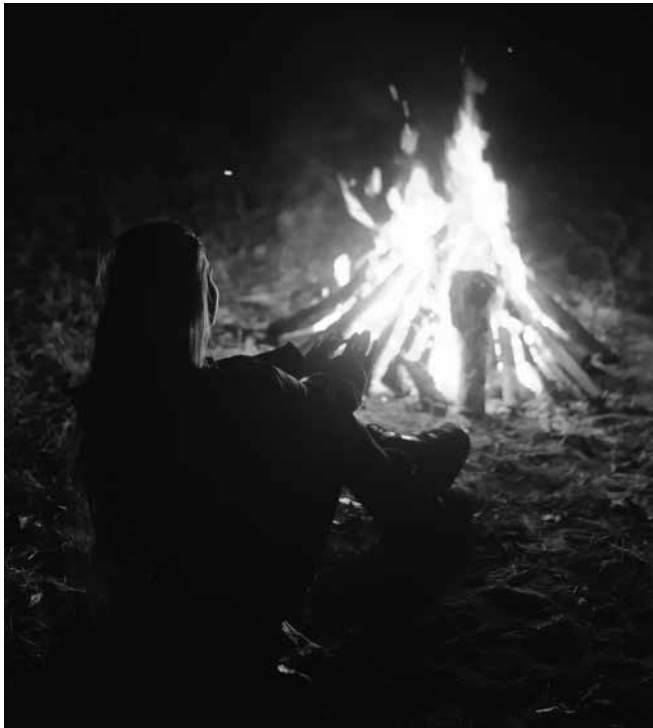
Una hoguera en la noche de San Juan.

La Noche de San Juan, celebrada la noche del 23 al 24 de junio, tiene su origen en una festividad pagana relacionada con el solsticio de verano. En nuestra residencia, esta noche mágica se convierte en una oportunidad para que los residentes revivan tradiciones y disfruten de momentos especiales. En esta celebración, el fuego simboliza la purificación y la eliminación de lo viejo y negativo, dando paso a nuevas oportunidades y deseos. Durante la festividad, se crean muñecos de paja, trapos o papel que representan lo malo del año anterior y se queman en la hoguera. Además, algunos estudiantes que han finalizado el curso aprovechan para quemar libros viejos, simbolizando el cierre de una etapa y el inicio de otra. Aunque el fuego de las hogueras es el principal ritual de esta conocida celebración, el agua y la pirotécnica también tienen su protagonismo.