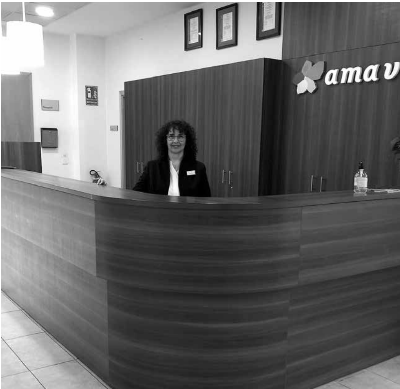
Nuestra compañera de recepción.

En esta edición de “Cosas de casa”, queremos recordar algunos temas importantes para mantener nuestra residencia en óptimas condiciones y saber a quién dirigirnos cuando surjan dudas o incidencias. En Amavir Horta, trabajamos juntos para crear un entorno seguro y confortable, por lo que es fundamental conocer los procedimientos y canales adecuados para cualquier situación que pueda surgir. Además, es esencial que todos los miembros de nuestra comunidad estén informados y participen activamente en el mantenimiento y mejora de nuestros espacios. Hoy, nos enfocaremos en el mantenimiento de habitaciones y espacios comunes. Es esencial que cualquier trabajador, residente o familiar que detecte alguna incidencia relacionada con este servicio la informe en la recepción del centro. El personal de recepción se encargará de registrar la incidencia de manera telemática y notificarla al departamento de mantenimiento, que se asegurará de resolverla de forma rápida y eficaz. Recordamos que la colaboración de todos