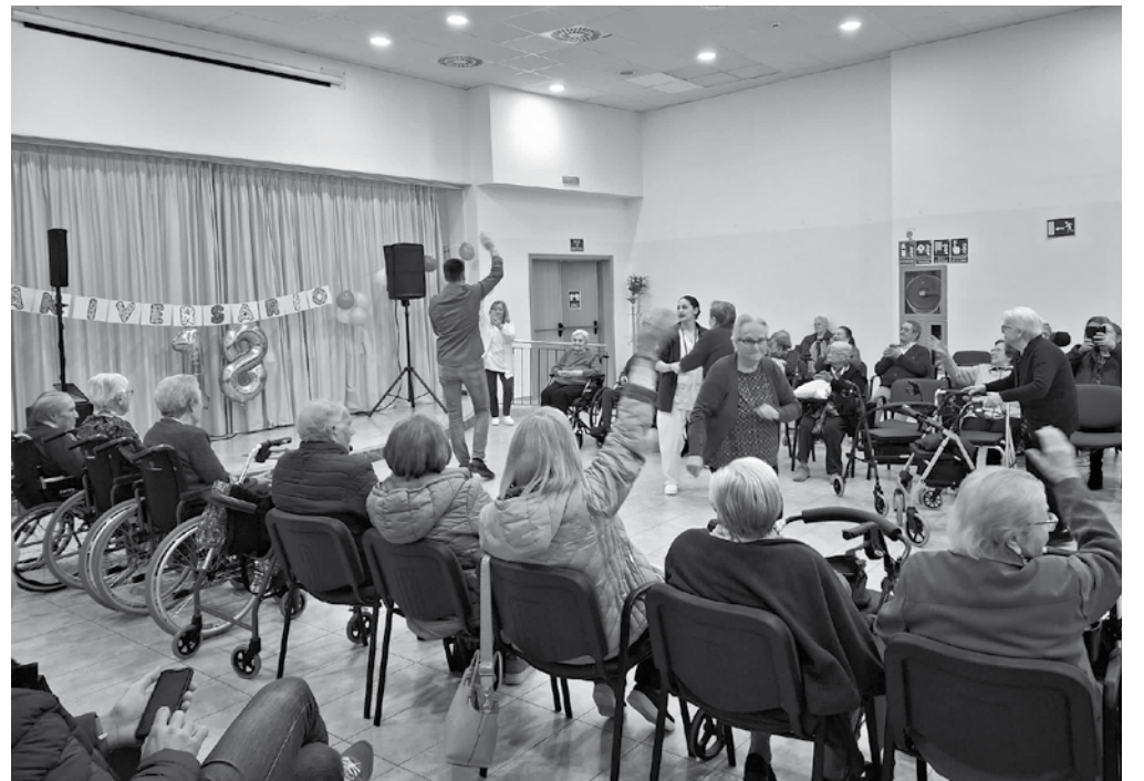
Celebramos juntos nuestro aniversario.

Parece que fue ayer cuando, en Amavir Horta, abrimos nuestras puertas por primera vez, llenos de ilusión y con el firme propósito de ofrecer un hogar acogedor a quienes decidieran compartir su vida con nosotros. Sin apenas darnos cuenta, ya hemos cumplido 18 años, nuestra mayoría de edad. Un tiempo que ha pasado volando y nos ha dejado recuerdos imborrables, personas maravillosas y momentos que nos han hecho crecer y mejorar cada día. Durante estos años, hemos recibido a cientos de residentes, cada uno con su historia, sus vivencias y su forma única de enriquecer nuestra comunidad. También hemos acogido a sus familias, que han sido un pilar fundamental en nuestro camino, y a un equipo de profesionales que, con su vocación y entrega, han convertido este centro en un verdadero hogar. Juntos hemos construido algo más que una residencia: hemos formado una gran familia donde el cariño, el respeto y la dedicación están siempre presentes. Por eso, hemos querido celebrar este aniversario como se merece, con una