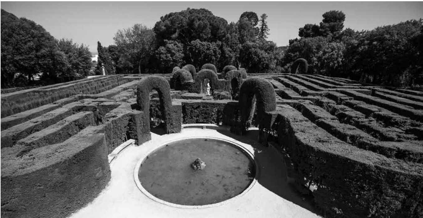
Parque del laberinto, en Horta.

Horta, uno de los barrios más auténticos de Barcelona, guarda en sus calles un sinfín de secretos que reflejan la esencia de la ciudad. Uno de los lugares más emblemáticos es el Parque del Laberinto, un jardín histórico del siglo XVIII famoso por su laberinto de cipreses, donde locales y turistas disfrutaban de un paseo lleno de misterio y belleza. Este parque también alberga jardines neoclásicos, fuentes y esculturas que invitan a la calma. Además, Horta destaca por su patrimonio