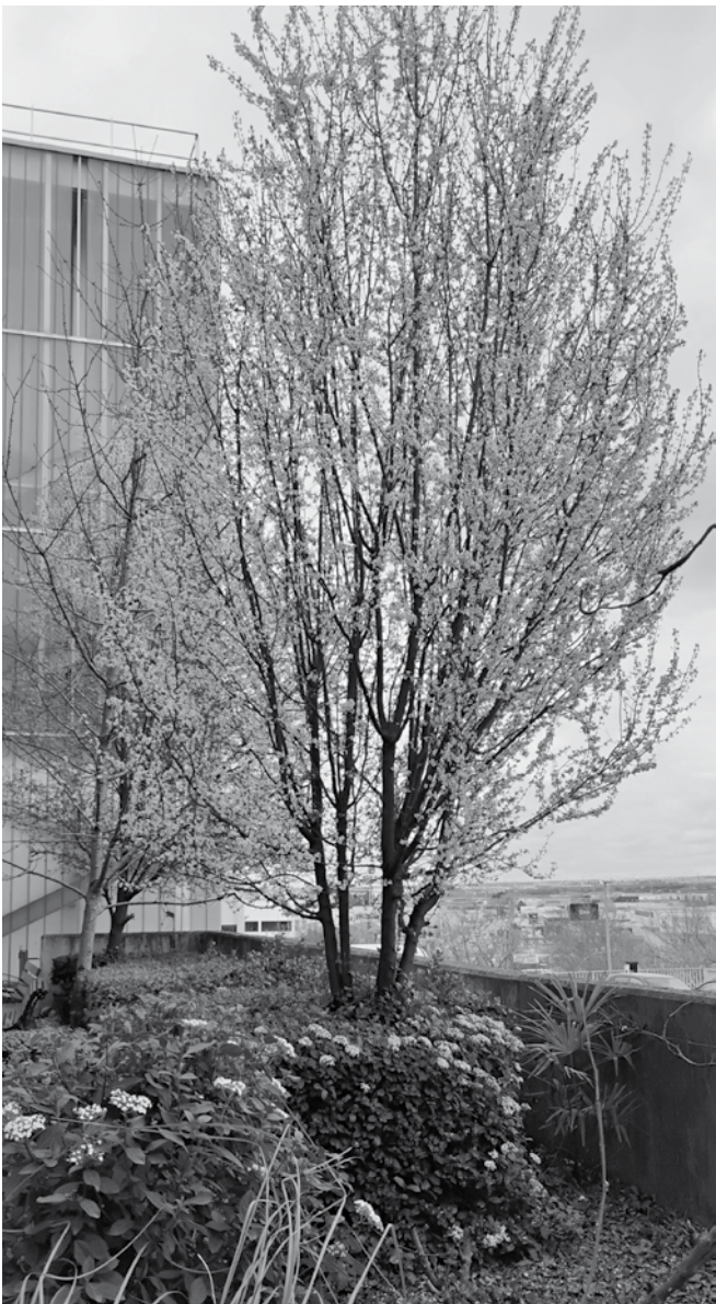
El cerezo injertado con albaricoquero en la entrada de nuestro centro.

líneas, las flores ya habrán caído y los frutos estarán empezando a aparecer. Todo un ciclo vital. La llegada de la primavera es un momento especial para todos los mayores que vivimos en la residencia. Pasamos las tardes en el patio del centro, cantando, jugando a las cartas y recibiendo las visitas de nuestros hijos y nietos. Por eso, tras un largo invierno, es maravilloso poder estar al aire libre y disfrutar del buen tiempo, y más si es rodeados de unas especies vegetales tan especiales. Nuestro patio, lleno de rosas y de vida, es uno de nuestros mayores orgullos y el lugar donde más nos gusta pasar el tiempo.