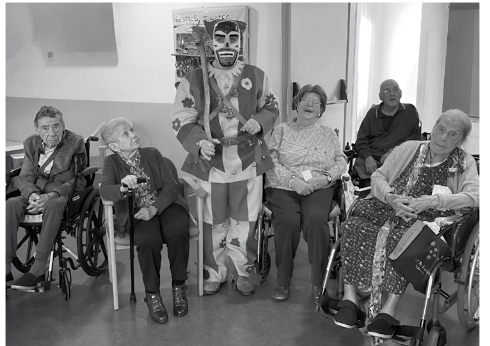
Visita de la Botarga de Málaga del Fresno.

En El Balconcillo hemos vivido una semana de carnavales con gran entusiasmo y muchas actividades distintas en la que los residentes pudieron disfrutar de una fiesta llena de baile, buena comida y una variedad de disfraces que llenaron de color y alegría cada rincón del centro. Durante la semana, los profesionales del centro siguieron unas consignas divertidas a las que se sumaron algunos residentes, creando un ambiente festivo y participativo. Además, tuvimos una mañana de desfile de disfraces junto con una actuación musical que hicieron de estos días algo aún más especial. Por una parte, el Jueves Lardero disfrutamos de una deliciosa longaniza con pan y de la honorable visita de Botarga de Málaga del Fresno, que con su cachiporra nos encantó y nos permitió descubrir las raíces de nuestra tierra. Por otra, para cerrar la semana, la actuación musical estuvo a cargo de la agrupación del hogar extremeño de Azuqueca de Henares, con el grupo “Lajara”, que nos deleitó con un recorrido por las canciones más conocidas por todos,