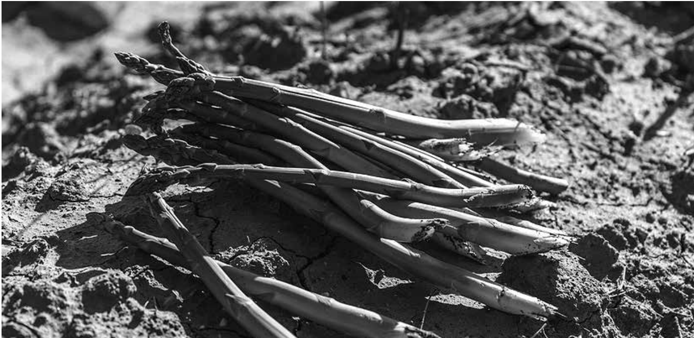
Espárrago verde del municipio de Humanes.

El espárrago verde es un cultivo cada vez más importante en Castilla-La Mancha, especialmente en la provincia de Guadalajara. La solicitud de registrarlo como Indicación Geográfica Protegida, cada vez más cerca de convertirse en realidad, busca reconocer la gran calidad de este producto y su enorme valor añadido, capaz de dinamizar el desarrollo rural en las zonas productoras. En la provincia de Guadalajara, existen algo más