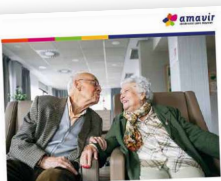
Estado de información no financiera consolidado 2024

El Consejo de Administración de Amavir ha aprobado el Informe sobre el Estado de Información no Financiera de la compañía correspondiente al ejercicio 2024, que resume los principales indicadores de actividad durante el pasado año en todos los ámbitos (económico, recursos humanos, calidad, medioambiente, comunicación, seguridad de la información, proveedores...). Es la séptima edición de este informe, que comenzó a publicarse en 2018. Ha sido auditado por Deloitte y está a disposición de todos los públicos de la compañía a través de nuestra página web.