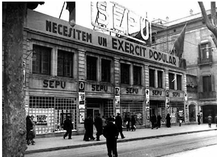
¡Qué tiempos aquellos!

La Societat Espanyola de Preus Únics (SEPU) va ser una de les primeres cadenes de grans magatzems d'Espanya. L'acte d'inauguració va tenir lloc el dimarts 26 de març de 1935 a les 3 de la tarda. SEPU es vantava de ser el primer comerç espanyol en utilitzar escales mecàniques (un fet destacable als anys 30) i de tenir un eslògan enganxós que deia: "Qui calcula compra a SEPU". Amb la desaparició per l'incendi d'El Siglo, SEPU es va consolidar com un dels magatzems preferits per a les economies més discretes. Basava la seva oferta en tèxtils de poca qualitat però a preu únic, incloent també calçat, certs tipus d'electrodomèstics i un petit