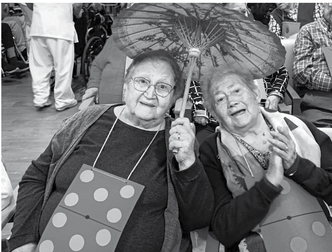
Una tarda rodona... fins l'any que ve, Carnestoltes!

Aquest any, la celebració del carnaval va tenir lloc el passat dimecres 26 de febrer al matí i va ser molt especial. Vam acomiadar el mes de febrer amb una festa de música i disfresses! Durant les setmanes anteriors, havíem estat elaborant fitxes de dominó gegants per lluir el dia de la festa. La veritat és que eren molt senzilles i alhora molt vistoses. Només entrar a la sala, tothom havia de triar una fitxa i posar-se-la. La veritat és que no va caldre insistir gens; tothom en volia una i tothom volia una foto amb la disfressa! Vam riure una estoneta mentre esperàvem que comencés la festa. Vam aplaudir amb ganes, vam cantar a ple pulmó i també ens va caure la llagrimeta en alguns moments, quan la música feia que les emocions es desbordessin. Però, sobretot, vam ballar tot el que vam poder i més! Vam fer el ja tradicional chu-chu-chu del tren, enllaçant les diferents peces del dominó i formant-ne un de gegant. Tot un repte!