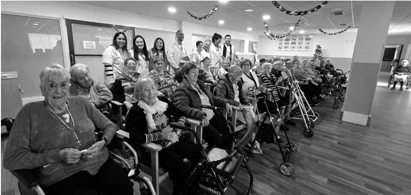
Foto de grupo después de la actuación.

Queremos compartir con vosotros una de las actividades más entrañables de nuestro centro: la coral ‘El Sentimiento’. Este nombre surgió de una broma entre los residentes y rápidamente se convirtió en el nombre oficial de nuestro grupo de cantantes. En nuestro primer concierto, veintisiete residentes se unieron para cantar villancicos navideños. Fue un evento maravilloso que disfrutaron tanto los residentes como sus familias y cuidadores. La coral ‘El Sentimiento’ está abierta a todos los