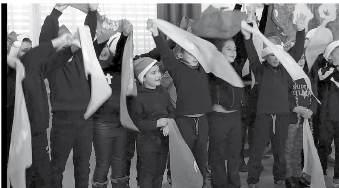
Un Nadal amb nens i nenes sempre és un Nadal especial.

Tenim la meravellosa sort que les escoles del nostre municipi sempre ens tenen molt presents, i comptem amb nosaltres per a moltes iniciatives, però, arribades aquestes dates, aquestes col·laboracions sempre tenen una importància especial. El Nadal és un període carregat de nostàlgia, sobretot en un centre com el nostre, i les ja clàssiques cantades de nades no fan més que omplir cada raconet del centre d'alegria i màgia, sobretot si venen acompanyades de la canalla de les escoles del poble.