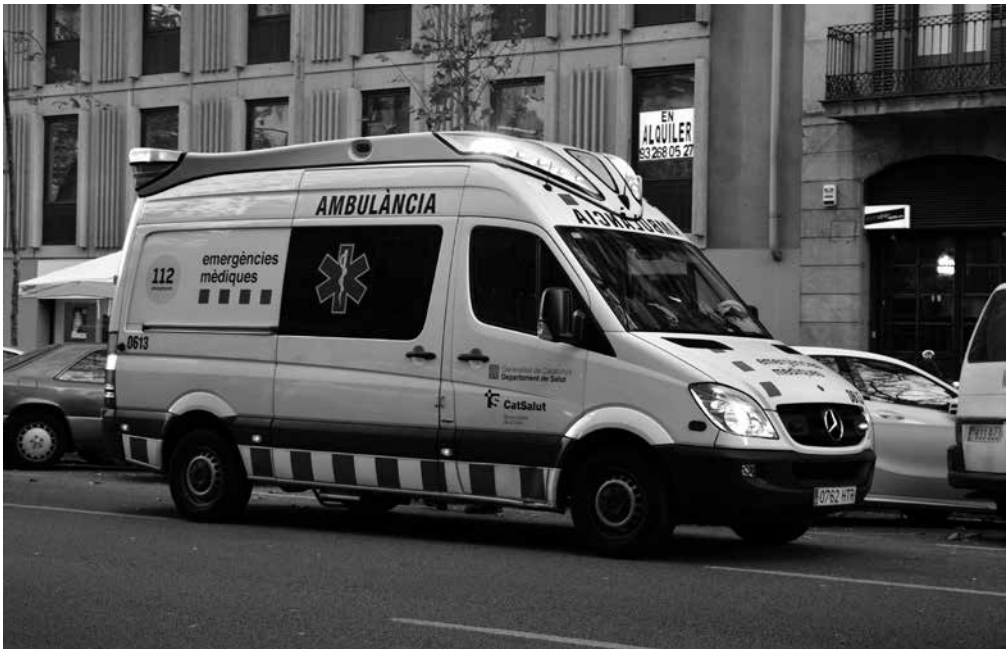
Ambulancia de nuestra comunidad.