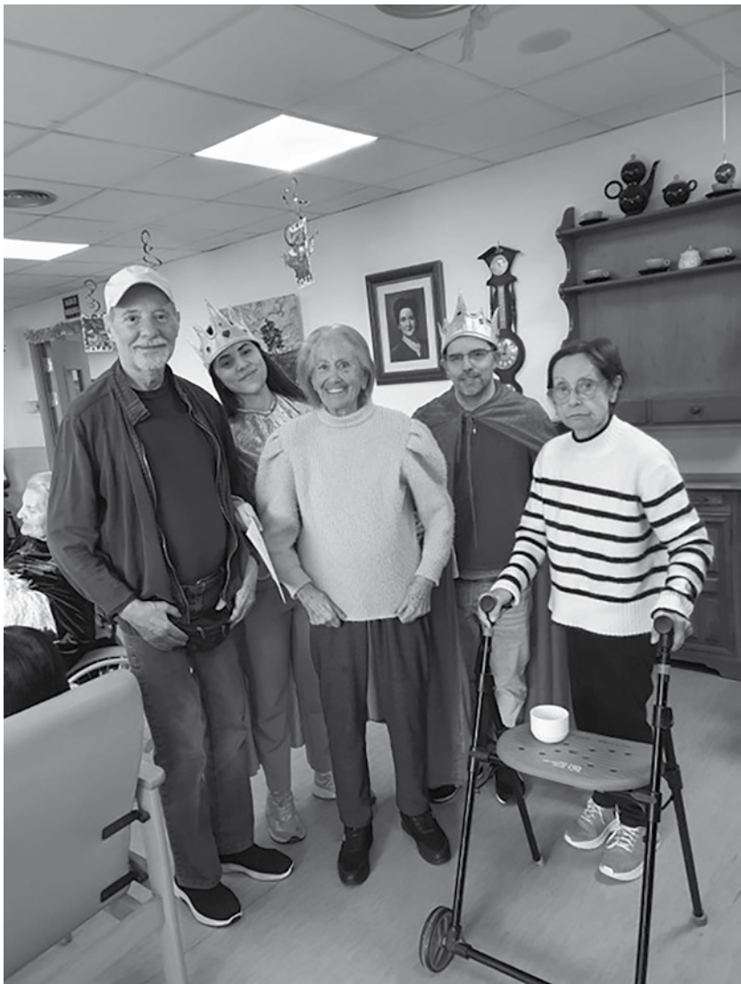
Algunos residentes en el Día de Reyes.

En Amavir Sant Cugat, despedimos el año con una serie de actividades que conmemoraron las fechas tan señaladas de la Navidad. Durante las celebraciones, nuestros residentes pudieron disfrutar de conciertos que despertaron el verdadero espíritu navideño, gracias a la colaboración de algunos voluntarios. Uno de los momentos más destacados fue el montaje del pesebre, una obra realizada por uno de nuestros residentes, que fue compartida con todos, reafirmando el verdadero significado de la Navidad. Además, el taller de cocina navideña brindó la oportunidad de aprender y compartir las recetas típicas de estas fiestas, disfrutando de sabores que evocan el calor del hogar y la unión familiar. El tradicional quinto de Nadal fue uno de los eventos más esperados, una jornada marcada por la emoción en la que todos participaron con entusiasmo. Para cerrar el año, realizamos una sesión de reminiscencia que nos permitió reflexionar sobre lo vivido en el 2024, reviviendo recuerdos y experiencias que marcaron este ciclo. Finalmente, dimos la bienvenida al 2025 con la tradicional llegada de los Reyes Magos y la creación de las cartas, una actividad que inspiró a todos a expresar sus deseos y esperanzas para el nuevo año.