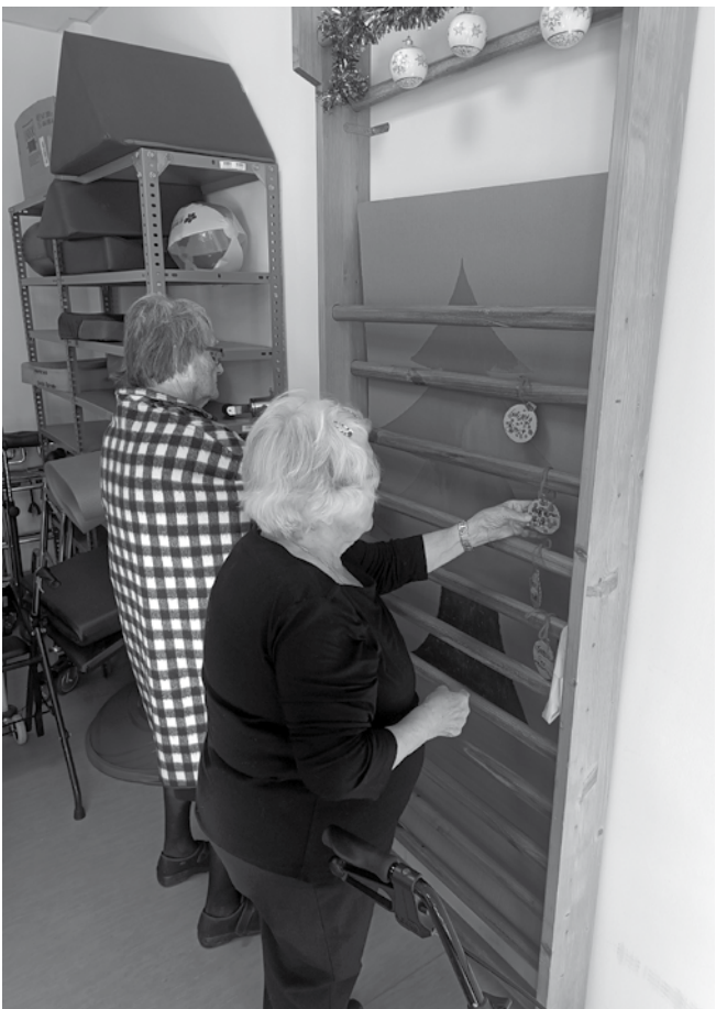
Decorando las espalderas con bolas de Navidad.

decoraron las paredes con guirnaldas y encestaron pelotas dentro de un muñeco de nieve. Estas actividades, además de proporcionar entretenimiento, ayudaron a trabajar la coordinación, la estabilidad funcional, el equilibrio, el control postural y la fuerza muscular. La jornada estuvo llena de risas y fue una manera maravillosa de celebrar la Navidad mientras se promovía la salud y el bienestar de nuestros residentes.