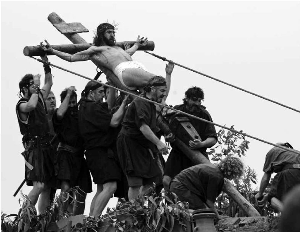
Actores locales recreando la Pasión de Cristo, en Milagro.

Milagro, un encantador pueblo cercano al río Ebro, se convierte cada Jueves Santo en el escenario de una impresionante representación de la Pasión de Cristo. Los habitantes de esta localidad, situada en la Merindad de Olite, recrean los momentos más significativos de la vida de Jesús en siete escenarios diseminados por la localidad, destacando por su profundo realismo. La Asociación de tambores y bombos de Milagro intensifica la atmósfera con sus potentes sonidos, generando una experiencia emocionalmente cargada. Esta celebración, que involucra a todos los vecinos, convierte a Milagro en un punto de referencia para los amantes de la Semana Santa, atrayendo a numerosos visitantes cada año.