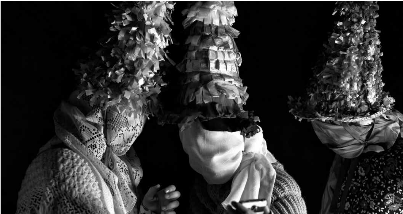
Fotografía de unos ‘Txatxos’, personajes típicos del Carnaval de Lanz.

El Carnaval de Lanz, uno de los más grandes y tradicionales de Navarra, se celebra justo antes del Miércoles de Ceniza, llenando las calles de esta villa del Valle de Anue con magia, música y personajes emblemáticos. El Carnaval de Lanz gira en torno a una antigua leyenda local: el malvado Miel Otxin, un bandido que robó “mil otxines” (monedas antiguas), es el centro de la festividad. En una escenificación única, los vecinos capturan a Miel Otxin, lo pasean por el pueblo y, finalmente, lo queman en la hoguera el martes de Carnaval,