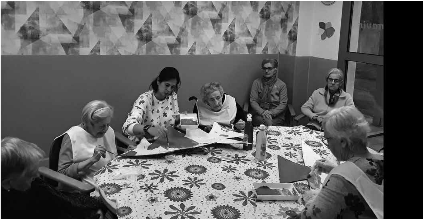
Residentes en un taller de manualidades navideñas.

Estas navidades, la Residencia Amavir Ibañeta se ha sumergido en un ambiente lleno de alegría y espíritu navideño, con una variedad de actividades pensadas para compartir momentos especiales con los residentes. Uno de los eventos más destacados fue el taller de adornos navideños organizado por los voluntarios de Central Navarra. Los residentes crearon bonitos adornos utilizando maicena, que luego se usaron para decorar nuestro regalo navideño al personal del centro de salud. Por su parte, la visita de los estudiantes de la Escuela de Erro fue otro momento entrañable. Los niños compartieron un baile con los residentes, quienes les ofrecieron un obsequio creado por ellos mismos. El toque