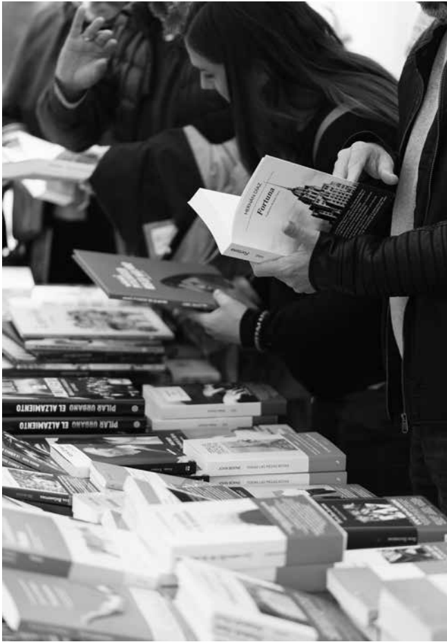
Varios lectores buscan algún libro para comprar.

de la Vega, es también el día en que nació la famosa “Feria del Libro” en ciudades como Barcelona, un evento esencial para todos los lectores. Leer no solo nos entretiene, también nos enriquece. La lectura nos permite adquirir conocimientos, comprender el mundo que nos rodea y fomentar la empatía. En un mundo cada vez más acelerado, el acto de leer nos invita a desacelerar, a reflexionar y a poner en marcha nuestra imaginación. En definitiva, el Día del Libro es una celebración que va mucho más allá de los regalos, las ferias y las recomendaciones literarias. Es un recordatorio de la importancia de los libros en nuestras vidas y un homenaje a los autores que, con sus palabras, nos han dado las herramientas para interpretar la realidad. Porque, al fin y al cabo, un libro es un sueño que tienes en tus manos.