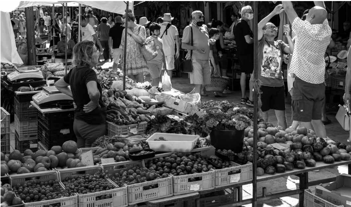
Imagen de un mercadillo callejero.

El mercadillo de Tomelloso se celebra todos los lunes por la mañana, desde las 8:00 hasta las 14:00 h, aproximadamente. Este mercado, ubicado actualmente en el recinto ferial de la localidad, lleva décadas siendo un punto de encuentro para comerciantes de diferentes pueblos, quienes instalan sus puestos de venta ofreciendo una variedad de productos que van desde alimentos frescos y ropa de todo tipo hasta artículos para el hogar y jardinería. La cercanía de nuestro