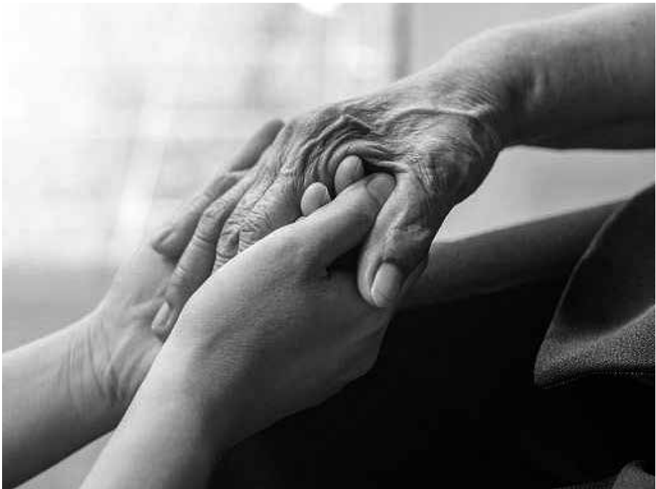
Todos necesitamos un apoyo.