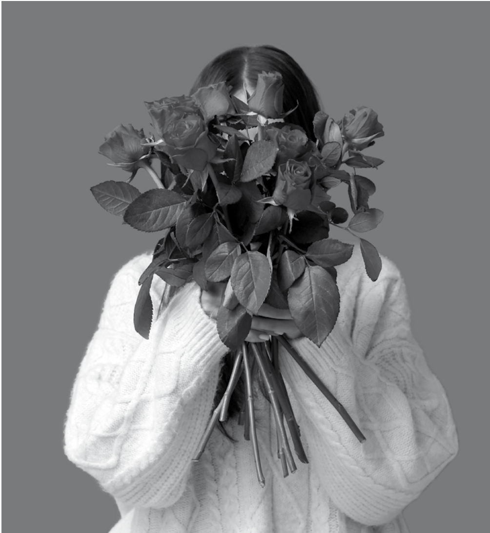
Una mujer sostiene un ramo de rosas.

San Valentín es una festividad de origen cristiano que se celebra anualmente el 14 de febrero, conmemorando las buenas obras realizadas por San Valentín de Roma en el siglo III, y su relación con el concepto universal del amor y la afectividad. En aquella época, el Imperio Romano era gobernado por el emperador Claudio II, quien decidió prohibir la celebración del matrimonio para los jóvenes, creyendo que los solteros sin esposa e hijos eran mejores soldados, ya que tenían menos ataduras. Sin embargo, el sacerdote Valentín consideró que este decreto era injusto y, de forma clandestina, celebraba matrimonios en secreto. Por esta razón, San Valentín se convirtió en el patrón de los enamorados. Cuando se descubrió su desobediencia, el emperador lo encarceló y, el 14 de febrero del año 270, Valentín fue ejecutado. Posteriormente, en el año 494, el papa Gelasio I designó el 14 de febrero como el día oficial de San Valentín, incluyendo esta festividad en el calendario litúrgico. Desde el siglo XX, impulsado en parte por la revolución industrial, el Día de San Valentín es también una forma de negocio, y las felicitaciones en forma de flores o bombones, uno de los regalos más frecuentes del día.