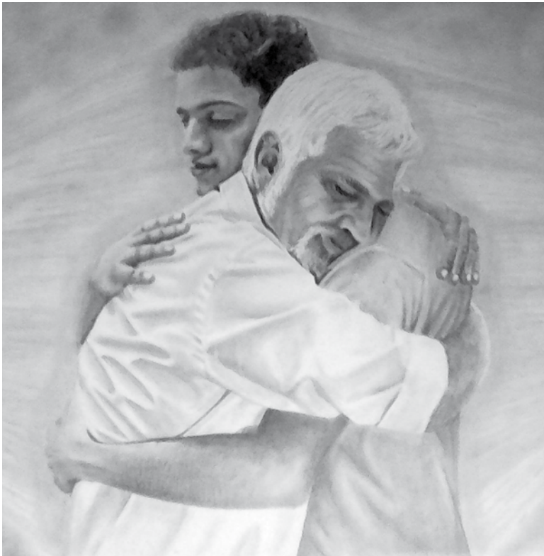
Un padre y un hijo se abrazan.

El 19 de marzo celebramos el Día del Padre en honor a San José, una fecha especial dedicada a conmemorar el amor y la dedicación de los padres en nuestras vidas. Esta celebración tiene sus raíces en 1909 en Estados Unidos, cuando una mujer quiso homenajear a su padre, un veterano de guerra que se quedó viudo al fallecer su esposa en el parto de su sexto hijo y se hizo cargo de la educación de sus seis niños. En España, el Día del Padre es una oportunidad para que las familias se reúnan y disfruten de momentos juntos y, de hecho, muchos aprovechan este día para compartir comidas, cenas o realizar actividades especiales. Asimismo, los más pequeños preparan manualidades personalizadas para regalar a sus padres, logrando sacarles una de sus mejores sonrisas.