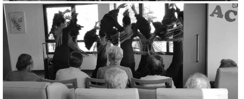
Residentes disfrutaban de una actuación navideña.