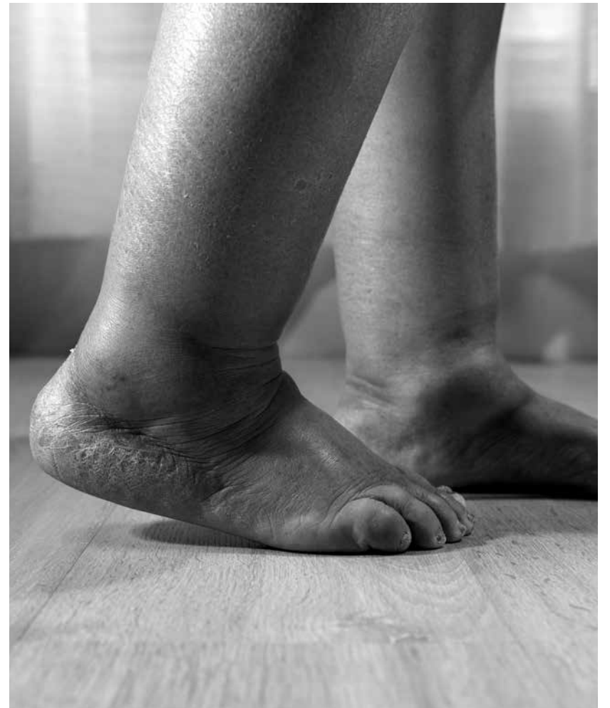
Edema acumulado en unos pies.