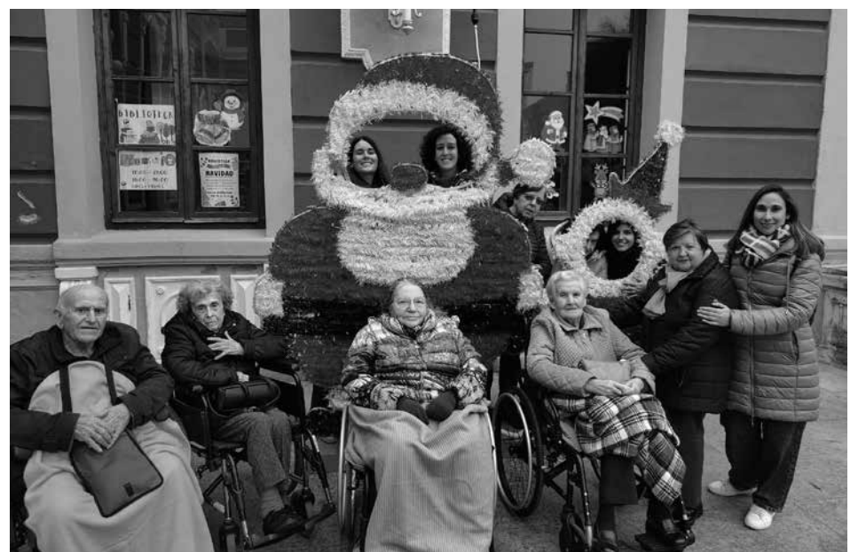
Residentes visitan el Belén Monumental en el Antiguo Casino.

El pasado 26 de diciembre, los residentes tuvieron la oportunidad de visitar el Belén Monumental realizado por la Asociación de Belenistas de Ciudad Real, situado en el Antiguo Casino. Este año, la recreación se centró en "la huida" de la Sagrada Familia hacia Egipto para escapar de la amenaza del Rey Herodes. El diorama destacaba por sus impresionantes efectos de luz y sonido, así como por la detallada representación del río Nilo, las viviendas típicas del desierto y templos icónicos como Luxor, Abu Simbel y Philae. La atención al detalle y la creatividad de los belenistas hicieron de esta visita una experiencia fascinante para todos los presentes. Tras la visita al Belén, realizamos una parada en un bar cercano para tomar un aperitivo. Durante este tiempo, los residentes