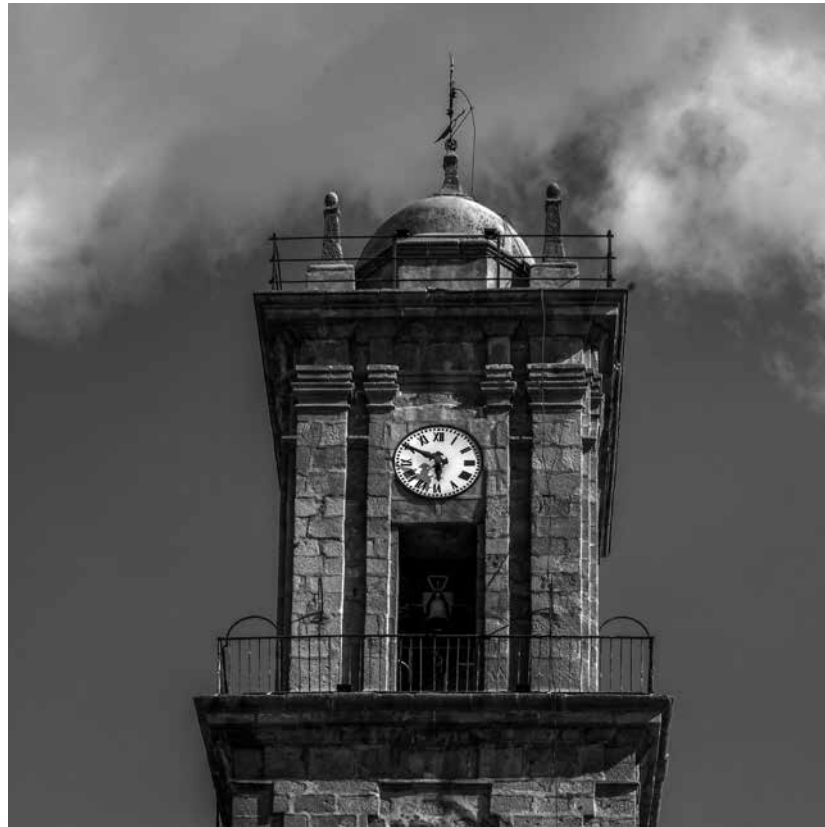
Iglesia de San Miguel Arcángel, en Villanueva de Córdoba.