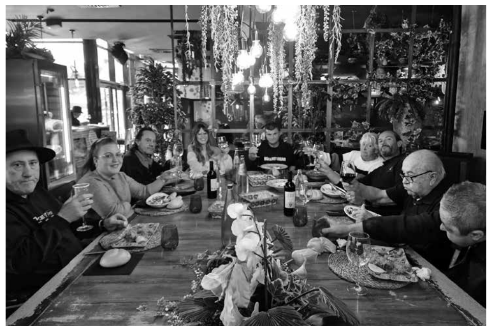
Los residentes disfrutan de un delicioso menú.

El pasado mes de diciembre, nuestros residentes disfrutaron de una salida especial como parte del programa navideño de este año. En esta ocasión, viajaron a San Martín de Valdeiglesias, una localidad cercana, para celebrar la Navidad en un restaurante local, donde pudieron disfrutar de un delicioso menú. Los residentes aprovecharon el tiempo hasta la comida para realizar compras personales en un centro comercial cercano. Otros optaron por disfrutar de un pequeño pincho en un bar local, lo que permitió a todos disfrutar de un rato de socialización antes de la comida. La comida fue un verdadero festín, y estuvo acompañada de charlas amenas