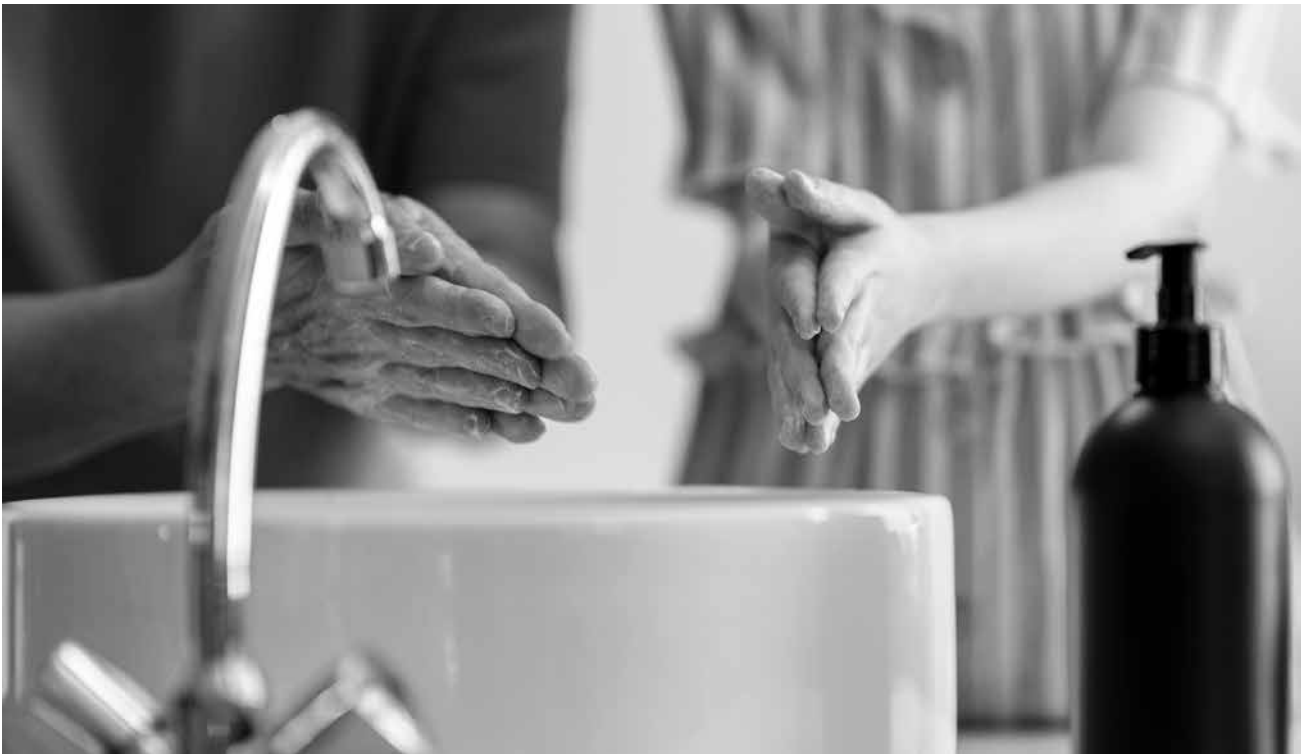
El lavado de manos es fundamental para prevenir enfermedades.