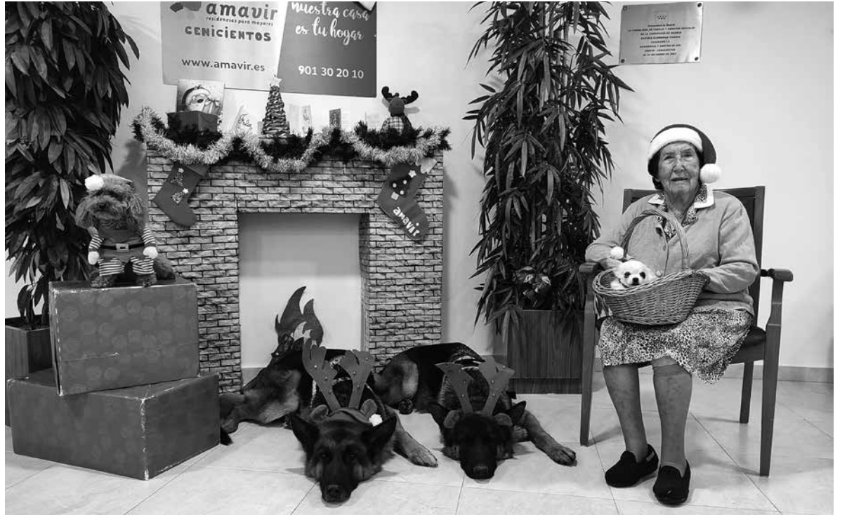
Puri, acompañada de nuestros amigos de cuatro patas.

En Amavir Cenicientos, la Navidad ha estado cargada de alegría, emoción y momentos entrañables gracias a una programación muy especial. Una de las actividades más esperadas fue la terapia con animales edición “Especial Navidad”. Nuestros amigos de cuatro patas, equipados con atuendos navideños, nos visitaron, trayendo con ellos toda la ternura y el cariño de siempre. Otra de las actividades destacadas fue el mercadillo artesanal, un evento organizado con un trasfondo solidario. Para ello, las residentes crearon auténticas maravillas como adornos navideños, pinturas y manualidades muy originales. Para culminar estas celebraciones, disfrutamos de una deliciosa comida navideña fuera del centro, que nos permitió compartir una jornada de convivencia especial. Además, no faltaron las