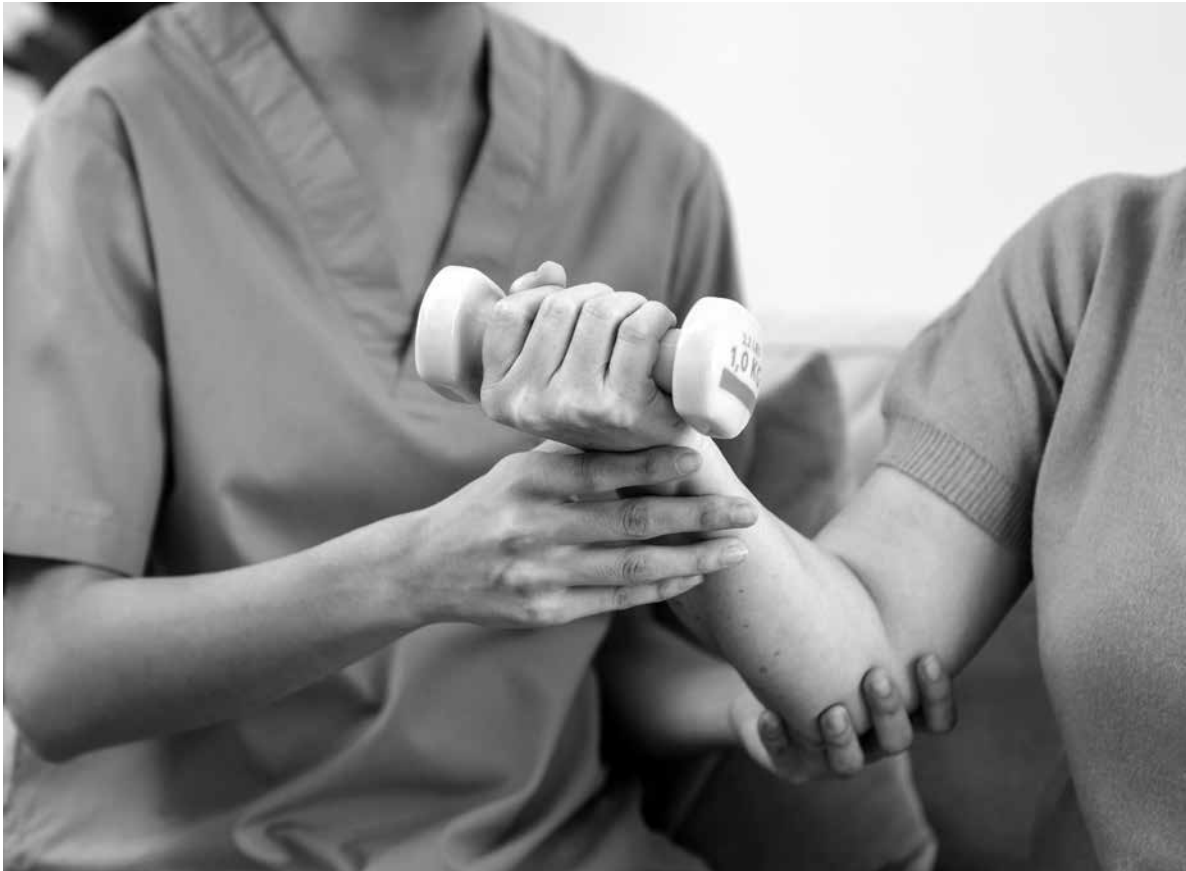
Los beneficios del ejercicio físico son innumerables.

En esta edición de “Cosas de casa”, queremos destacar la importancia de la actividad física regular y cómo esta mejora la calidad de vida de nuestros residentes. La actividad física no solo previene enfermedades, sino que también potencia la independencia en la tercera edad. El envejecimiento activo no es un mito, y, el ejercicio físico juega un papel fundamental para lograrlo. Estudios recientes han demostrado que la actividad física regular en personas mayores no solo mejora su salud física, sino también su bienestar mental y emocional. Incorporar actividades como caminar, practicar yoga, realizar ejercicios de fuerza o simplemente mantener movimientos cotidianos reduce el riesgo de enfermedades cardiovasculares, diabetes, osteoporosis e incluso deterioro cognitivo. En nuestro centro, promovemos talleres de movilidad adaptados, donde los residentes descubren que es posible mantenerse activos respetando sus capacidades individuales. Además, estas actividades fomentan la socialización, disminuyen el riesgo de caídas y contribuyen a mantener la indepen-