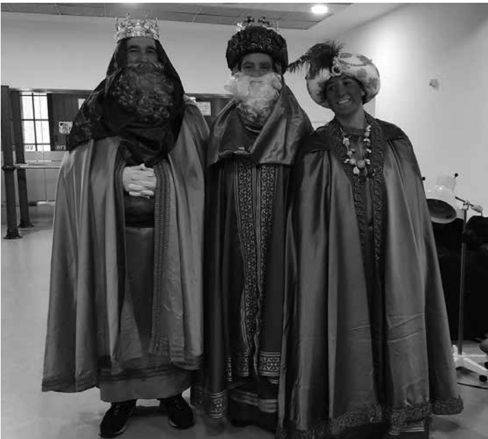
Visita de los Reyes Magos a nuestro centro.

La pasada Navidad, Amavir Argaray se llenó de alegría y música gracias a la visita de varios grupos y artistas que nos deleitaron con sus actuaciones. Entre los invitados, contamos con la presencia del coro Anapar, los colegios Jesuitas y Sagrado Corazón, el grupo Tamarindo, el grupo de jotas Navarra a Contracorriente, el mariachi Joselito, la rondalla Jus la Rocha y la Cofradía de San Saturnino. Cada uno de estos artistas trajo consigo un toque especial, llenando nuestros días de festividad y emoción. Además, el día 3 de enero, recibimos una visita muy especial: los tres Reyes Magos, acompañados de sus pajes, vinieron a llenarnos de ilusión y a repartir detalles entre los residentes. A ellos también les agradecemos su presencia y esperamos verlos de nuevo el próximo año.