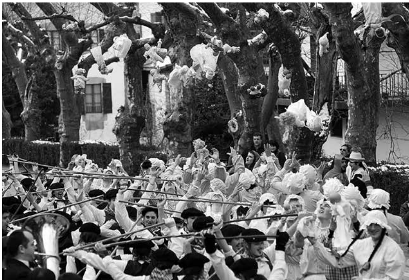
Uno de los momentos del desfile de Carnaval de Bera.

El Carnaval de Bera, celebrado en los días previos al Miércoles de Ceniza, es una de las tradiciones más queridas de Navarra. En esta festividad, los papeles se intercambian de manera divertida y peculiar. Durante el desfile de los “Inude eta Artzaiak”, los hombres se visten de nodrizas, llevando muñecos en brazos que lanzan al aire en determinados momentos, mientras que las mujeres se convierten en pastores y desfilan en parejas por la localidad. Además de los bailes, interpretan dos canciones tradicionales: “Bestarik behar bada” y “Armeniako artzaiak”. El desfile entre los distintos barrios se realiza al son de la marcha “Inudeak eta