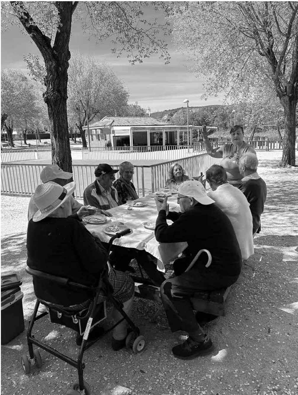
Y que no falte un buen picnic.

Con motivo de diferentes celebraciones como el Día del Deporte el pasado 6 de abril, el de la salud el 7 de abril y el de las aves migratorias el 11 de mayo, desde nuestro centro quisimos hacer salidas especiales. En relación con esta última, para concienciar de los beneficios que tienen las actividades en la naturaleza, y de paso, conocer un poco más acerca de las aves que habitan en nuestro entorno, realizamos una salida a los lagos de Caraquiz, situados en una urbanización del pueblo de Uceda. Por la mañana se aprovechó para activar el cuerpo a través de actividades que se realizaron al aire libre. Una vez finalizadas, y bien merecido, se preparó un picnic con toda la comida y las bebidas que se habían traído para la ocasión. Tras nuestro pequeño descanso, nos dispusimos a ir todos juntos a tomar un café a un bar que había cerca del parque y disfrutar un poco del paisaje que nos rodeaba. Antes de irnos, ya bien descansados de todo el trote de la mañana, nos acercamos a los lagos por la pasarela de madera para dar de comer a los patos y cisnes que se encontraban en el lugar. Agotados después de disfrutar de todo el día, volvimos a nuestra casa tan felices y contentos.