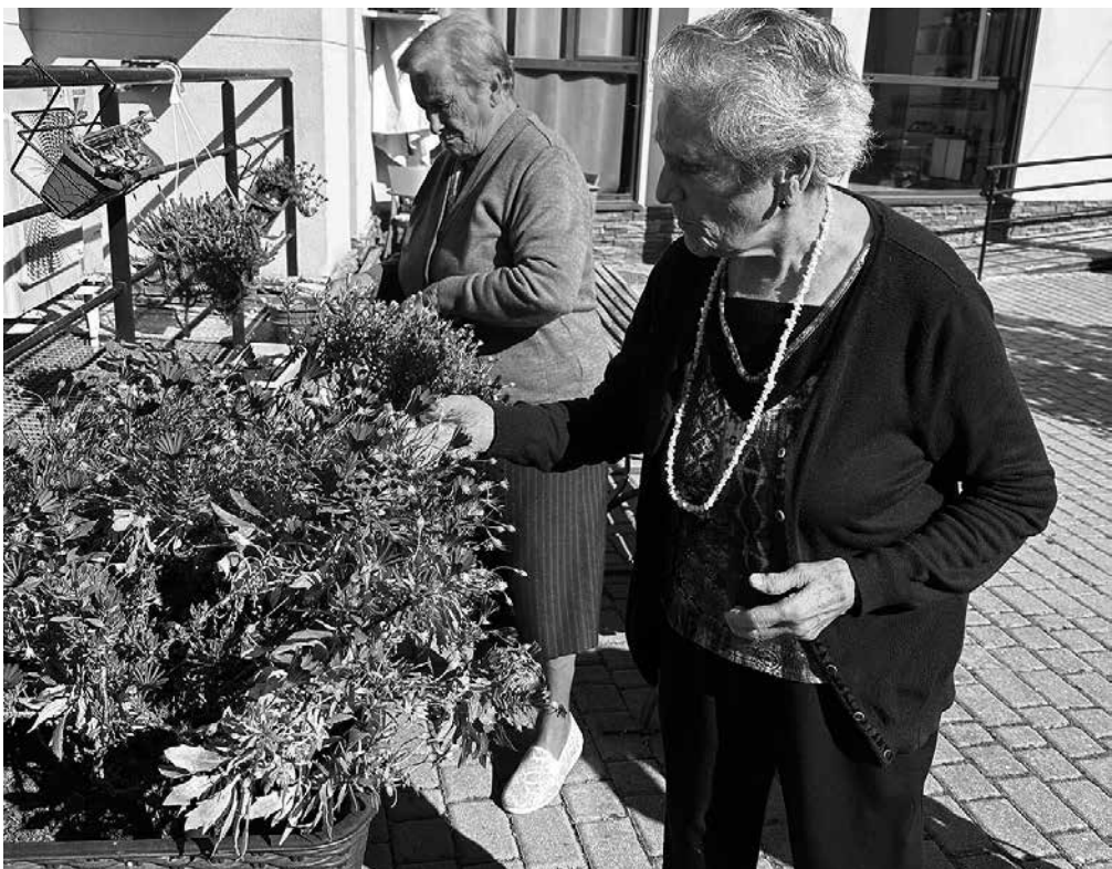
Los jardines flotantes de Patones.

El pasado mes de mayo, con el buen tiempo que hizo, decidimos volver a redecorar el patio interior de la residencia para darle algo más de color. Entre los residentes y los profesionales del centro de Patones, dedicamos un mañana entera a comprar las plantas en el vivero de Talamanca. Indecisos por todas las flores que veíamos, acabamos llevándonos unas cuantas cajas de diferentes plantas para nuestra casa. Por la tarde, aprovechando que no pegaba tanto el sol, distribuimos y trasplantamos cada una de las flores a los maceteros. Después de un duro trabajo, nos regocijamos todos juntos con unos refrescos, admirando nuestra gran obra de arte.