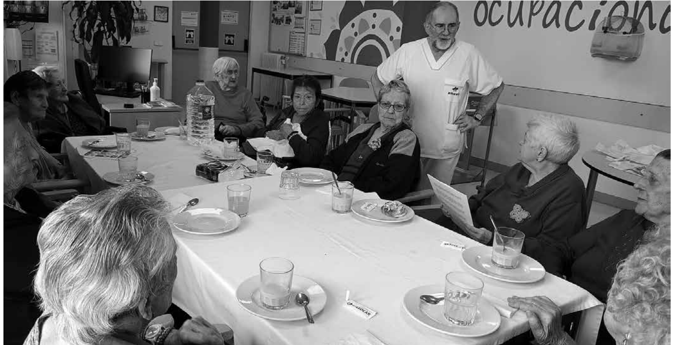
Porque su opinión nos importa.

Desde hace ya un tiempo a cada cambio de temporada y de menú, nos reunimos con nuestro consejo de residentes, el cual da voz al conjunto total de los usuarios del centro aportando sus opiniones, y son ellos quienes deciden entre las diferentes opciones los platos que se van a servir la siguiente temporada. En esas reuniones también nos acompaña la responsable de cocina, ya que es fundamental que todos escuchemos sus necesidades para mejorar día a día y así también puede transmitir a todo su equipo cuáles son los gustos de nuestros residentes. En estas reuniones que realizamos una vez al mes, repasamos qué tal han ido las comidas, vemos cada grupo de alimentos como son las verduras, legumbres, carnes, pesca-