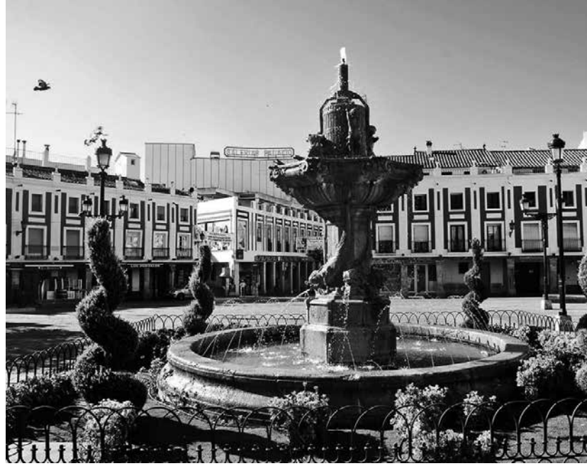
La plaza de Valdepeñas.