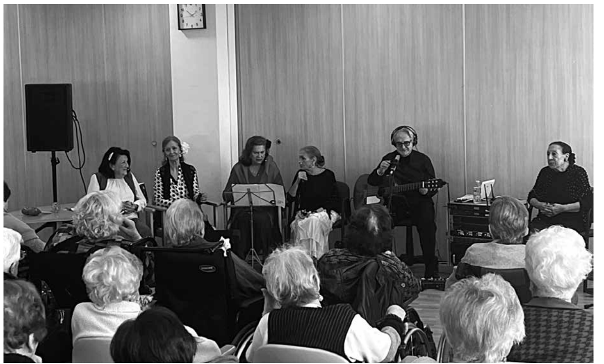
En la actuación de castañuelas.

Tuvimos el honor de ser visitados por un grupo de voluntarios dedicados a la música tradicional española, homenajeando el uso de las castañuelas, un instrumento musical de percusión utilizado por los danzadores para llevar y marcar el ritmo en una cantidad no determinada de danzas rituales de celebración y de bailes sociales. La actividad se realizó en la sala polivalente. Todos los usuarios del centro estaban invitados. Cantaron desde coplas hasta sevillanas y pasodobles en la actuación. Los usuarios se lo pasaron de maravilla, ya que lo pudieron disfrutar cantando y bailando, recordando canciones de su época. Entre canción y canción los usuarios salieron a bailar al centro del escenario. Los músicos disfrutaron de la escena tan maravillosa que vieron, disfrutaron de ver a los usuarios felices. Al finalizar el espectáculo, músicos, bailarines y usuarios