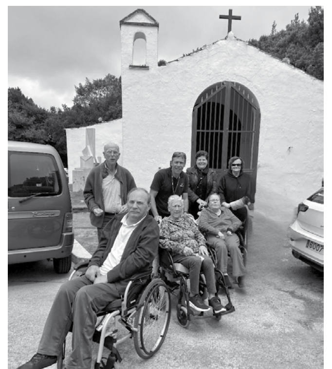
Usuarios de centro de día en la Cruz del Carmen.

una convivencia fuera del centro visitando la Cruz del Carmen, un viejo cruce de caminos situado dentro del Parque Rural de Anaga y, además, disfrutaron un rico almuerzo de comida típica canaria. Este tipo de actividades lúdicas tienen una función terapéutica esencial para fortalecer las relaciones en grupo y la autoestima.