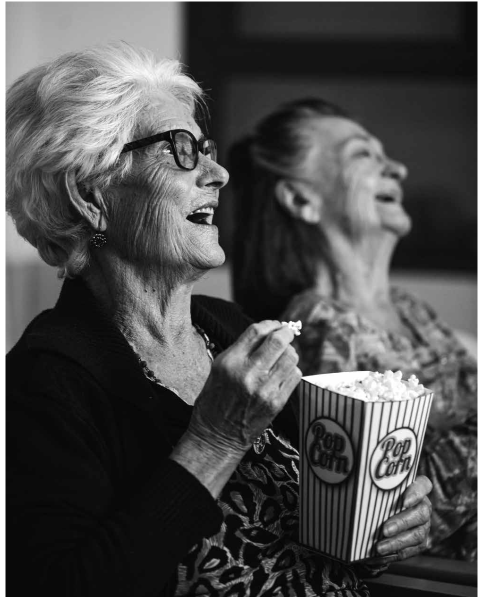
Residentes disfrutando del cine y de sus cotufas.

Aunque la construcción de “ir al cine” tiene hoy un significado muy distinto, lo que se hace en esta residencia es un regreso al pasado, a los años en los que el cine era el gran evento. Ir a la gran pantalla era un acontecimiento y se acompañaba de toda una ceremonia social que empezaba decidiendo qué película ver, el compartir las palomitas y, sobre todo, la tertulia posterior. Cada semana, la sala multisensorial de nuestro centro se transforma en una sala de proyecciones profesional, y ellos en privilegiados espectadores que disfrutaban de las películas como en cualquier cine, pero sin salir de su casa y con detalles que el tiempo y las nuevas tecnologías ya han dejado en el olvido. Se intenta cada semana homenajear a un actor o actriz diferente, donde destacamos películas de Manolo Escobar, Marisol, Cantinflas, cine de los años 60 y 70, y además se ofrece cine navideño en la época de diciembre. Asimismo, durante el mes de mayo se intentan proyectar películas rodadas en las Islas Canarias, para celebrar el Día de Canarias. Y es que estas sesiones, además del aspecto lúdico, tienen también un objetivo terapéutico, ya que activan los recuerdos de los asistentes y benefician sus mecanismos sensoriales y cognitivos.