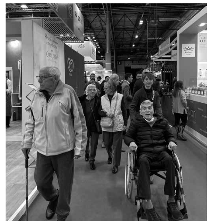
Los residentes disfrutando de la visita a IFEMA.

con gran presencia de comida ecológica para degustar. Nos ha encantado compartir presencia en el stand del Grupo Amavir en el que nuestros visitantes llenaron sus mochilas de regalos de merchandising como, por ejemplo, utensilios de aseo, productos de papelería, botellas reutilizables y caramelos tan dulces como nuestra visita.