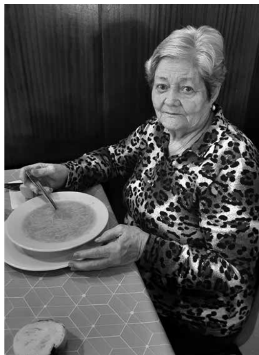
Los platos de cuchara son su especialidad, como las salsas y los buenos caldos.

Dejamos en remojo las judías durante 24 h. Después, escurrimos la legumbre y la cubrimos de nuevo con agua para hervirla y asustar el guiso 2 o 3 veces. Picamos la cebolla muy menuda para que el caldo espese, añadimos la morcilla, el chorizo y la punta de jamón con el laurel, la sal y la punta de jamón.