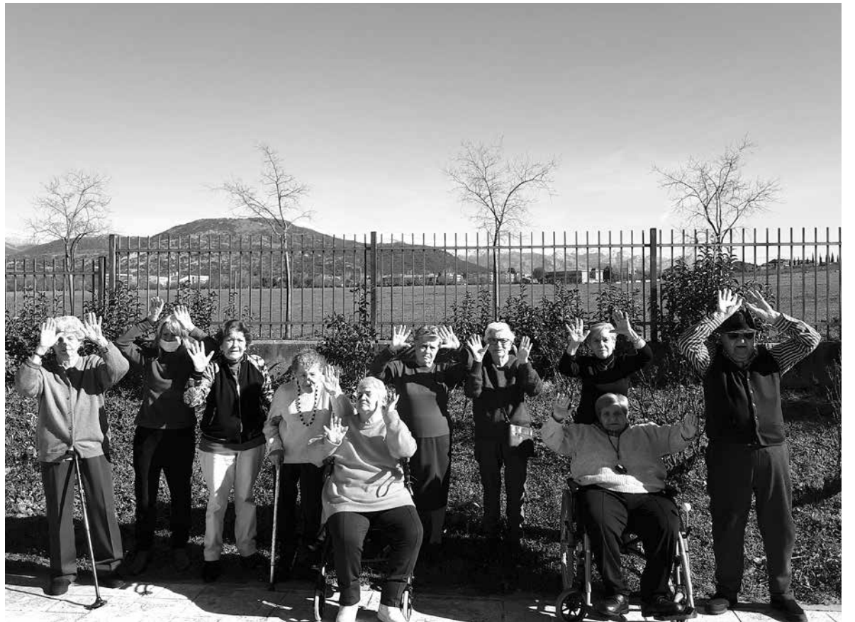
Un grupo de nuestros residentes nos saluda desde el jardín.

Esperamos que estéis teniendo un feliz día, de verdad. Para nosotros lo es a juzgar por las imágenes que tenemos desde Amavir Nuestra Casa y su estupendo entorno. Un entorno del que hemos podido disfrutar especialmente para celebrar el Día Internacional de Acción por los Ríos. Nuestros residentes aprovecharon la mañana para tomar el sol paseando por el jardín y disfrutar de la compañía de los demás, acompañados de unas estupendas vistas a las montañas cargadas de nieve que pronto llegará como agua a nuestros ríos. Es importante concienciar de la importancia de este bien tan preciado con pequeños gestos de ahorro en nuestro día a día. Cierra el grifo cuando no uses el agua y disfruta del uso responsable en tu vida cotidiana, porque el planeta azul quiere seguir siéndolo. Además, recuerda otras medidas de ahorro energético que sin duda van a suponer un excelente beneficio para todos, como, por ejemplo, apagar las luces si no las necesitas.