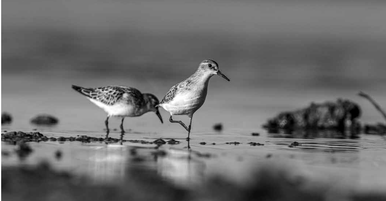
Fauna en la laguna de Pitillas.

En la falda de la sierra de Ujué, en medio del paisaje estepario, destaca un humedal de 216 hectáreas repleto de aves. Y es que, si sois amantes de las aves, no podéis dejar de visitar la laguna de Pitillas. Ubicada entre Pitillas y Santa Cara y rodeada de campos agrícolas, su principal tesoro es, sin duda, la variedad de aves acuáticas que alberga y que elige este privilegiado paraje para pasar el invierno o