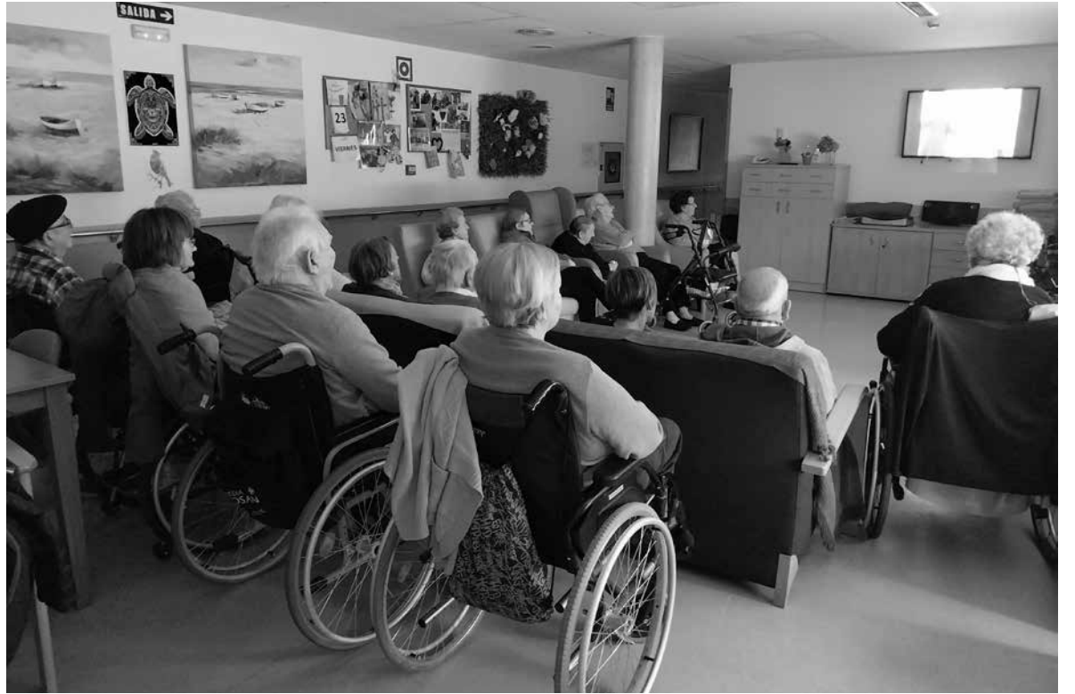
Cinefórum en el centro de día.

Las personas residentes de Amavir Mutilva tienen una nueva cita ineludible en su calendario de actividades desde el mes de febrero de este año. De manera quincenal, cada sábado proyectamos una película en el espacio de estancias diurnas. Contamos con una televisión panorámica de gran tamaño y con un sonido espectacular. La semana anterior comenzamos con los preparativos: decidiendo qué película ver, apuntándonos a la actividad, invitando a algún familiar y, sobre todo, disfrutando con la tertulia posterior. El equipo de trabajadoras del centro se empeña en cuidar al máximo esta actividad y están consiguiendo un público fiel, cerca de 30 residentes que no se pierden una proyección. Son los propios residentes los que sugieren los filmes que les apetece ver y la selección es variada para intentar cubrir todos los gustos y preferencias. Desde que comenzó la actividad se han proyectado títulos como El último tranvía, Se armó el Belén y Chica para todo. Tras terminar los títulos de crédito, se abrió un pequeño cinefórum en el que los espectadores pueden dar su opinión sobre el